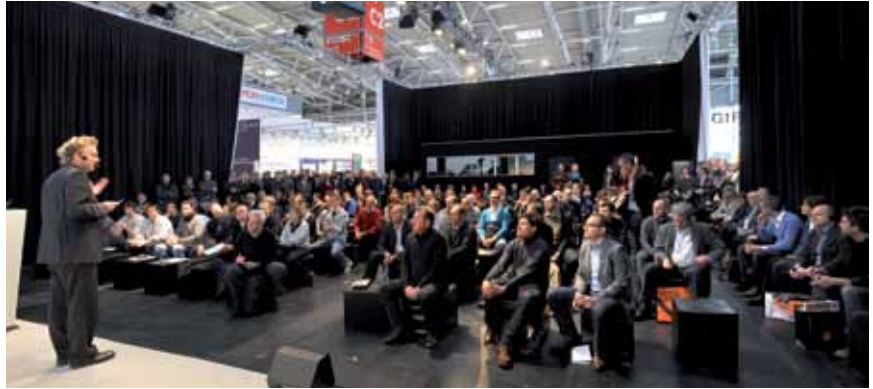
Novinska konferencija povodom siječanjskog sajma Bau

ili hlađenje građevina. Stoga je već godinama energetska učinkovitost glavni sadržaj svih rasprava. Na sajmu će se predavanjima i posebnim predstavljajima pokušati prikazati kako će se u budućnosti opskrbljivati energijom građevine i urbanističke cjeline te kakva će ih tehnološka unapređenja pratiti.