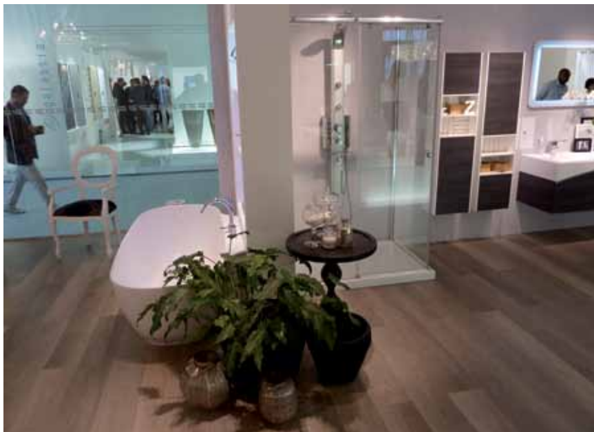
Detalji izložbenih prostora na sajmu Cersaie