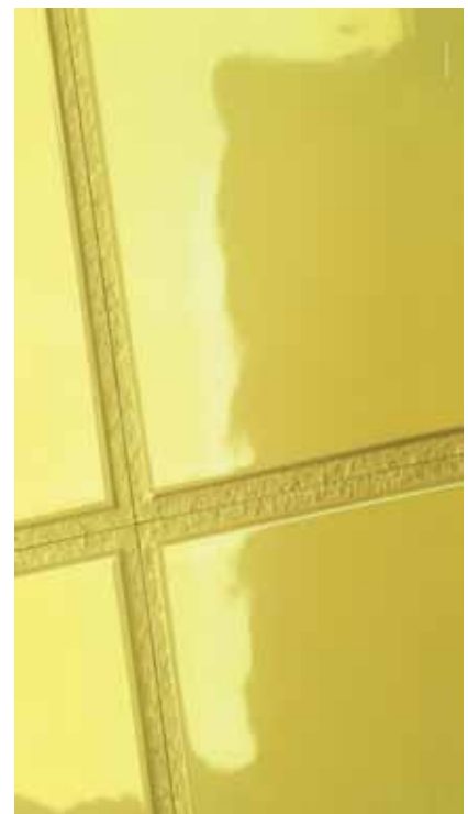
Philippe Starck - igra spojevima i rubovima pločica

Ta je iskonska misao rodila tzv. fleksibilnu arhitekturu, zapravo kolekciju pločica koja ostavlja snažan dojam na gledatelje, a ujedno je i prevratnička zbog novog pristupa uporabi keramike u graditeljstvu. Pločice napuštaju tradicijsku funkciju dekorativne obloge, a ističu se kao integralni graditeljski dio i postaju modularni ukrasni element. Osim s dizajnom u boji i teksturi, Starck se poigrao i rubovima pločica. Njihovim se slaganjem stvaraju jedinstvene površine zahvaljujući kombinacijama različitih debljina, površina, rubova i boja. Rubovi postaju dio cjelovite pločice i obrađeni su raznovrsno, od jedne do svih strana. Starck se ujedno poigrao i s debljinom proizvoda, od 7 mm za trodimenzionalni izgled ruba i 12 mm za strukturne površine, čime su ostvarene dvije osobite površine, jedna grublja i gotovo arhaična te druga koja je blago valovita, a podsjećaju na dragocjenu ručno oslikanu talijansku keramiku.