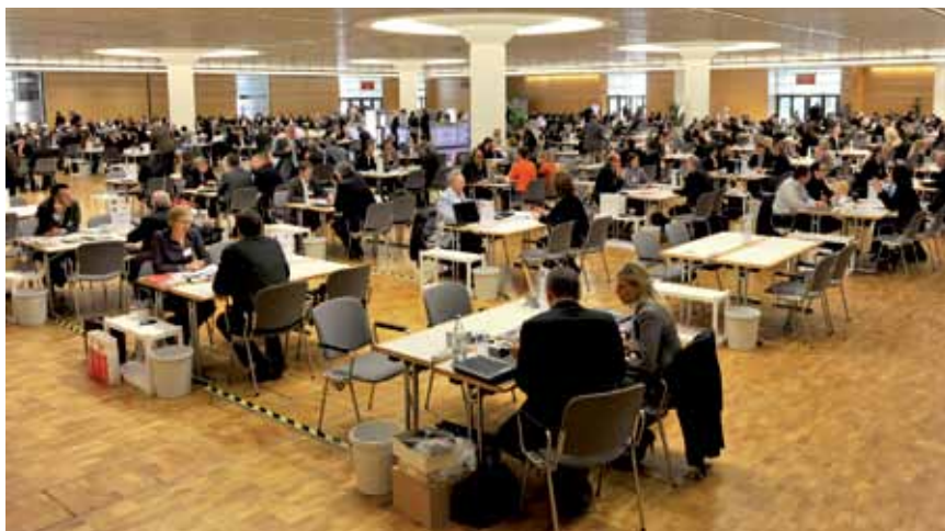
Razgovori novinara koji preta graditeljstvo s izlagačima Bau 2013 na Münchenskom sajmu u listopadu 2012.

U odnosu na suvremenu uporabu energije valja reći da sada u Europi gotovo 40 % utrošene energije odlazi na grijanje