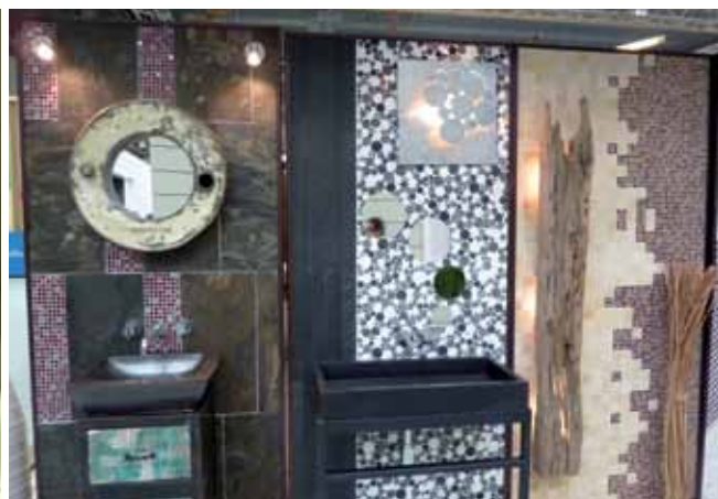
Na sajmu su predstavljeni sasvim različiti stilovi kupaonica, tj. kupaonske opreme i pločica