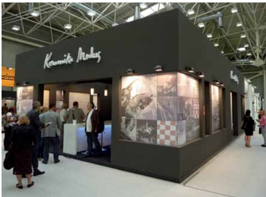
Izložbeni prostor hrvatskog izlagača Keramika Modus

Na sajmu Cersaie brojnim su poslovnim posjetiteljima i zaljubljenicima u detalje za opremanje interijera predstavljeni svi noviteti iz svijeta keramike. Međunarodni je salon keramičkih pločica i