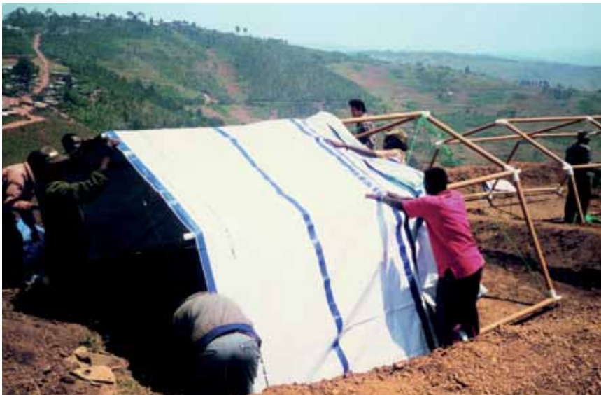
Građenje izbjegličkog logora u poslijeratnoj Ruandi

samo privilegiranim pa je stoga odlučio zagovarati one slabijega imovnog statusa, a osobito ljude stradale u katastrofama. U takvim slučajevima uvijek nedostaje kvalitetno i poželjno privremeno stanovanje. Pritom je vrlo važno uporabiti i lokalne materijale za gradnju. U njegovu se radu očituje neograničen arhitektonski potencijal jeftinih i prirodnih materijala, poput papira, kartona i bambusa, pa mu je zaštitni znak lakoća i održivost. Gradnja se uglavnom sastoji od umatanja i lijepljenja prirodnim materijalima recikliranoga papira oko aluminijske cijevi. Nakon što se papir osuši, cijev se ukloni, a stupovi oblože voskom radi vodootpornosti. Ban je naime još 1990. dobio odobrenje za uporabu kartona kao građevinskog materijala. Poznata je njegova humanitarna inicijativa u izbjegličkom logoru u poslijeratnoj Ruandi gdje su se upotrebljavale kartonske cijevi za šatore koje su Ujedinjeni narodi donirali izbjeglicama. Tim je rješenjem izbjegnuto rušenje stabala, ali i skupi metalni stupovi. Nakon potresa u Kobeu 1995., Ban je projektirao pedeset kuća za raseljene Japance. Osnova su im bili pivski sanduci ispunjeni pijeskom, čime su izbjegnuti betonski temelji. Nakon što je uspio uvjeriti lokalnog svećenika u učinkovitost i čvrstoću kartona, izgra-