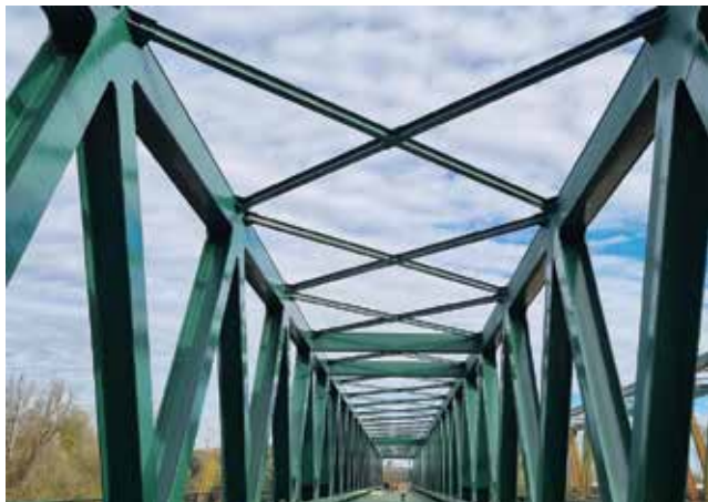
Pogled na čeličnu konstrukciju mosta Drava