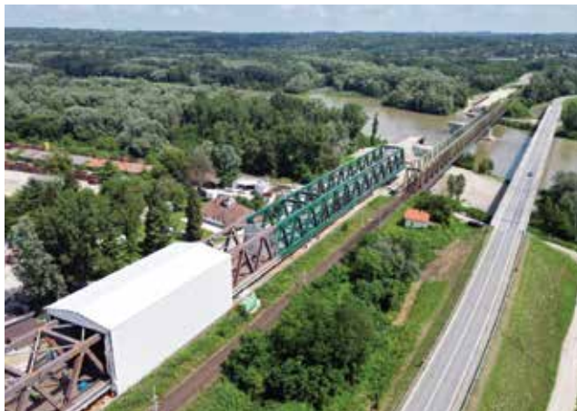
Postupak naguravanja mosta provodio se metodom uzdužnog potiskivanja

vrijedan 5,3 milijuna eura HŽ Infrastruktura d.o.o. potpisala je 23. ožujka 2020. sa zajednicom ponuditelja koju čine tvrtke Centar za organizaciju građenja d.o.o. i DB Engineering & Consulting GmbH.