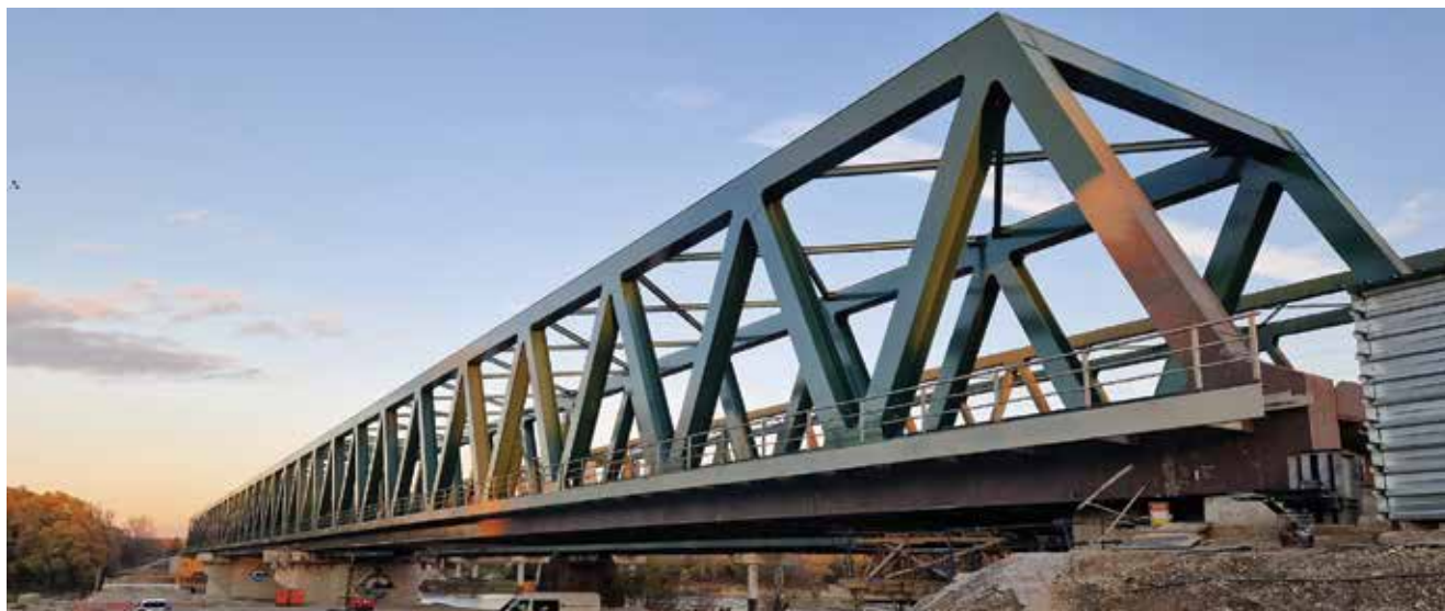
Detalj s gradilišta mosta

mediji, koji su obišli i novoizgrađeni željeznički kolodvor Novo Drnje.