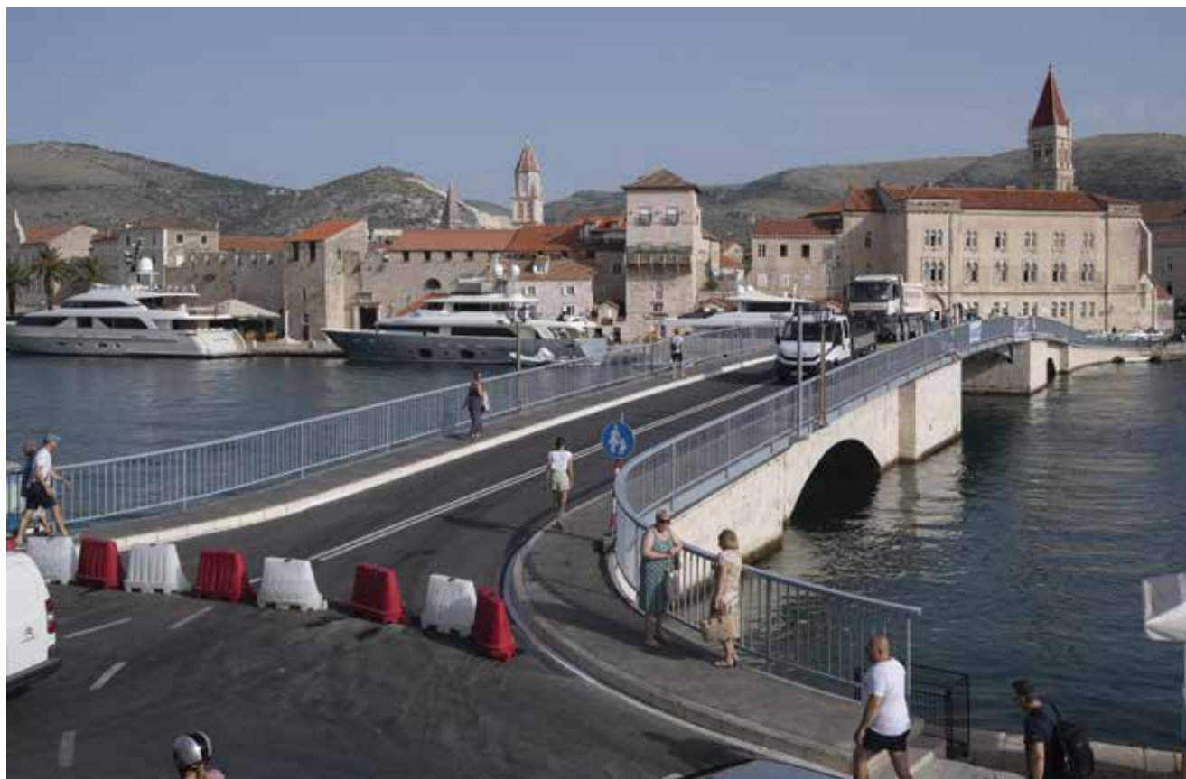
U sklopu projekta rekonstruirat će se pristupna cesta kod Starog mosta u Trogiru

Iznos od 1,07 milijuna eura namijenjen je za izgradnju obilaznice Stomorska dulji-