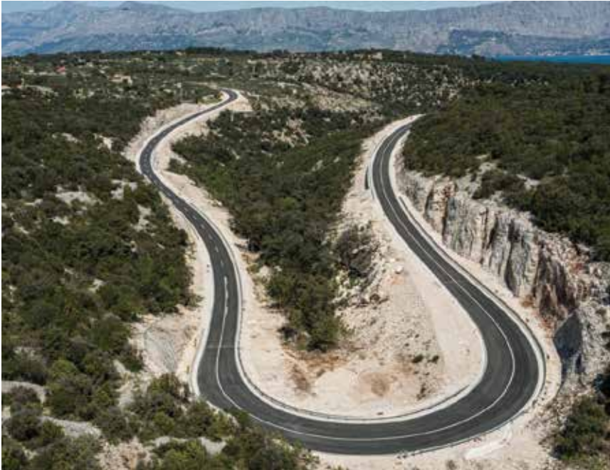
Kreće rekonstrukcija pojedinih dionica ceste na Braču

ne 1,01 km na Šolti, a koja će služiti kao pristup istoimenoj luci. Nova obilaznica s dva traka podržava planirani projekt uređenja luke Stomorska. Bez odvojenoga cestovnog pristupa luci, povećani opseg prometa ljeti bi iz godine u godinu opterećivao središte naselja.