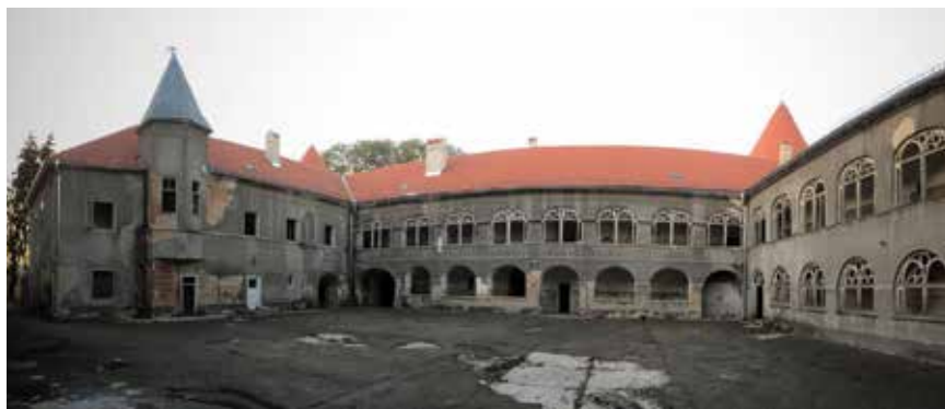
Dvorac već godinama propada, a dodatno je oštećen u potresu 2020.

katastarske karte iz 1862. te fotografija koje su snimljene nakon potresa 1880. vidljivo je kako je kaštel imao oblik zatvorenoga četverokuta s četiri ugaone kule. U 18. stoljeću, nestankom turske opasnosti, pristupilo se barokizaciji i osuvremenjivanju dvorca. Obitelj Erdödy morala je, zbog financijskih razloga, imanje i dvorac prodati sudskim putem 1852. U 19. stoljeću dvorac je najprije pripao obitelji Pallavicini, a potkraj stoljeća prešao je u vlasništvo Franje Aurela pl. Türka. Nakon potresa 1880. obitelj Pallavicini prodala je dvorac karlovačkoj obitelji Türk, koja je počela rekonstrukciju dvorca. U tom je zahvatu obnovljeno sjeverno pročelje, uklonjene su dvije južne kule te je dokinut drugi kat sjevernoga i zapadnoga krila dvorca. Godine 1922. dvorac je kupio Antun pl. Mihalović, inače posljednji hrvatski ban austrougarskoga vremena. Tijekom Prvoga svjetskog rata dvorac je bio u vlasništvu obitelji Hafner, a potom obitelji Vošnjak. Prije Drugoga svjetskog rata dvorac je bio u funkciji koncentracijskoga logora, a nakon rata u njemu je bila smještena vojska. Posljednjih godina dvorac znatno propada i čeka neka bolja vremena. Očekuje i neku novu namjenu, koja će, po svemu sudeći, biti kulturno-obrazovna.