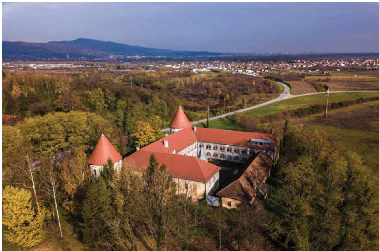
Pogled na dvorac Erdödy Kerestinec

Gradnja dvorca počela je oko 1575., a na temelju starije građevine (kurije) iz prve polovine 16. stoljeća. Povijesni izvori bilježe sudjelovanje kerestinečkih kmetova, nastanjenih oko dvorca, u velikoj Seljačkoj buni 1573. Pregrađivan je u 18. i 19. stoljeću, a temeljito uređen početkom 20. stoljeća. Riječ je o jednokatnoj građevini četverokutnoga tlocrta s cilindričnim ugaonim kulama i otvorenim arkadnim hodnikom s dvorišne strane. Kategorizira se kao renesansni nizinski kaštel, dominantno obrambenoga karaktera. Na temelju