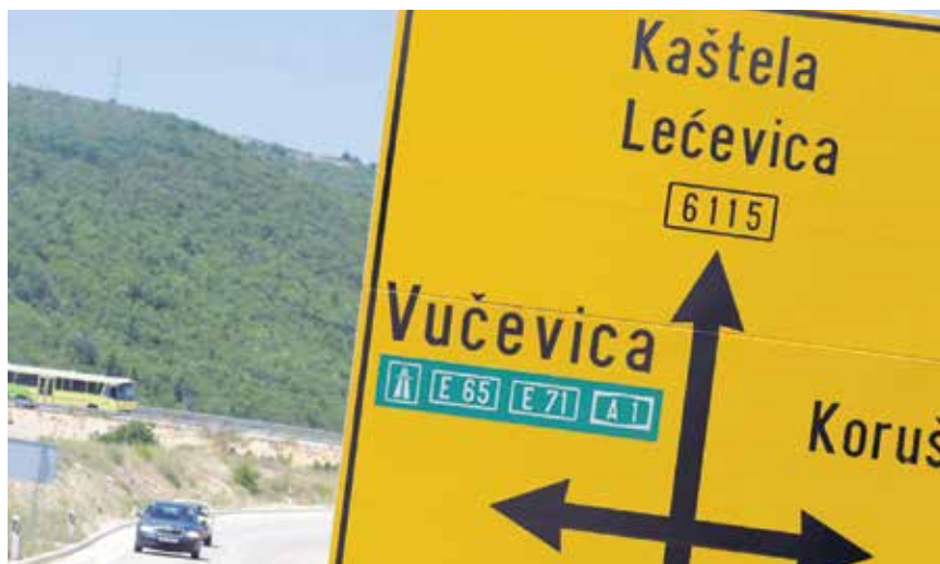
Započela je gradnja spojne ceste kojom će Split dobiti novi ulaz na autocestu A1

mrežu javnih cesta sjeverno od planine Kozjak, uključujući autocestu A1, dionicu Prgomet – Dugopolje, s vezom u čvoru Vučevica i županijskih cesta ŽC6115 i ŽC6098, koje se protežu sjevernije od autoceste i služe kao važna prometna