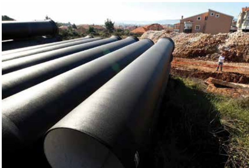
U 60 projekata vodnokomunalne infrastrukture u Hrvatskoj trenutno se ulaže 25,8 milijardi kuna