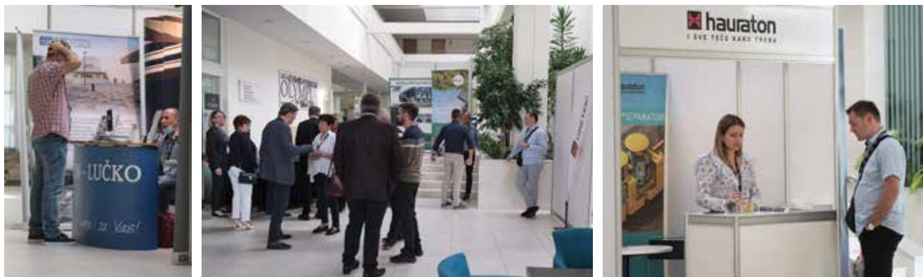
Brojne su se rasprave vodile s predstavnicima tvrtki koje su izložile svoje proizvode

ru Hrvatskom savezu građevinskih inženjera te podržao okupljanje predstavnika građevinskoga sektora, koje omogućuje razmjenu iskustava i predstavljanje najboljih poslovnih praksi. Budući da Predsjednik nije mogao doći osobno i sudjelovati u radu 8. Sabora hrvatskih graditelja, njegov izaslanik bio je prof. dr. sc. Stjepan Lakušić, dekan Građevinskog fakulteta Sveučilišta u Zagrebu, koji je u ime Predsjednika izrazio nadu u oporavak građevinskoga sektora uz pomoć novoga investicijskog vala, pri čemu će znatnu ulogu imati Nacionalni plan oporavka i otpornosti, koji je ujedno bio glavna tema plenarne sjednice u radnome dijelu skupa.