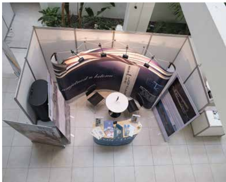
Izložbeni je prostor tradicija Sabora hrvatskih graditelja

Ministarstvo obavlja upravne i druge poslove koji se odnose na istraživanje, proučavanje, praćenje, evidentiranje, dokumentiranje i promicanje kulturne baštine, na središnju informacijsko-dokumentacijsku službu, na utvrđivanje svojstva zaštićenih kulturnih dobara, na propisivanje mjerila za utvrđivanje programa javnih potreba u kulturi Republike Hrvatske, na skrb, usklađivanje i vođenje nadzora nad financiranjem programa zaštite kulturne baštine, na osnivanje ustanova za obavljanje poslova djelatnosti zaštite kulturne baštine i nadzor nad njima, na ocjenjivanje uvjeta za rad pravnih i fizičkih osoba na restauratorskim, konzervatorskim i