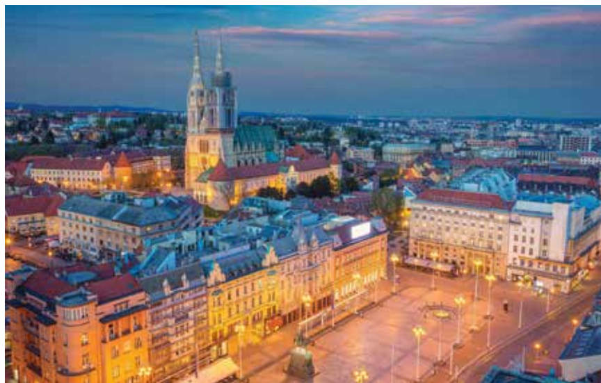
Panorama Zagreba s pogledom na katedralu

Zagrebačka katedrala tek je krajem 19. stoljeća, odnosno početkom 20. stoljeća, dobila svoj današnji izgled koji su kanonici Zagrebačke biskupije zamislili u 14. stoljeću, kada su na pečatnjak dali ugravirati oblik crkve s dvama tornjevima. Tijekom povijesti pretrpjela je niz požara i rušenja. Zvonici su građeni prema nacrtima i pod nadzorom austrijskog arhitekta Hermana Boléa u razdoblju od 1889. do 1902. U siječnju 2014. na 102. metru južnoga zvonika zagrebačke katedrale pronađena je pisana poruka. U poruci je Bollé napisao: "A dao dobri Bog, kada iza vjekovah opet na javu dodje sadanja spomenica... da se tada nadju svi Hrvati kao dobri ka-