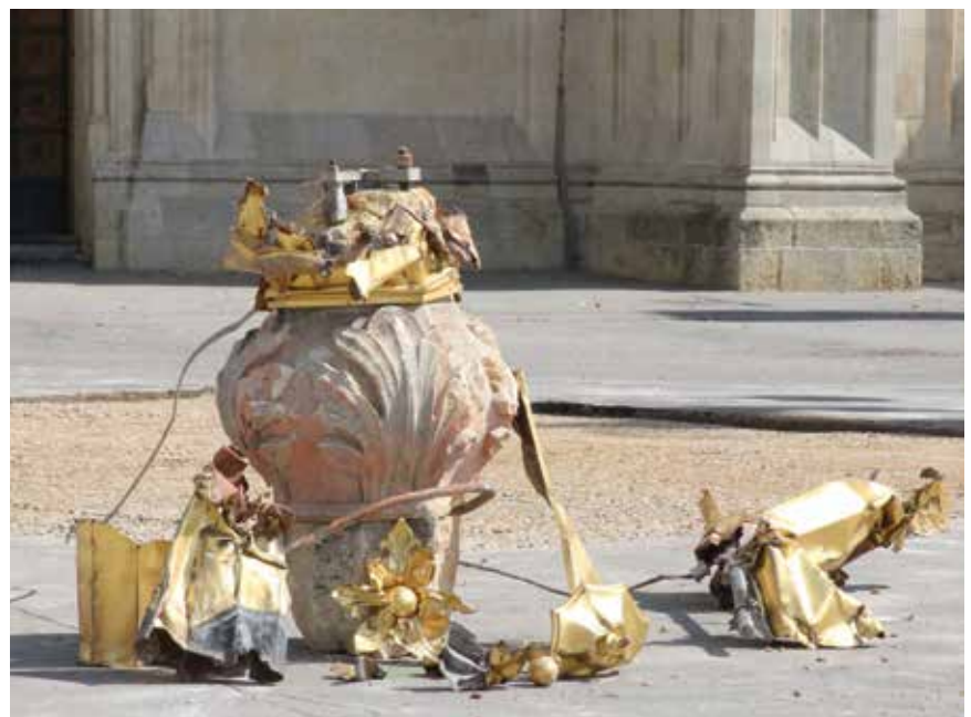
Metalni pozlaćeni križ s vrha tornja katedrale raspao se na brojne dijelove

mide krova iznad južnoga stubišta koje vodi od katedrale do krova na apside, a dio vrha na sjevernome stubištu kod oltara sv. Ladislava ostao je nagnut i nije pao. U unutrašnjemu dijelu katedrale inženjere je zatekla velika količina žbuke koja je otpala sa zidova, a na podu su bili i komadi kamenih rebara.