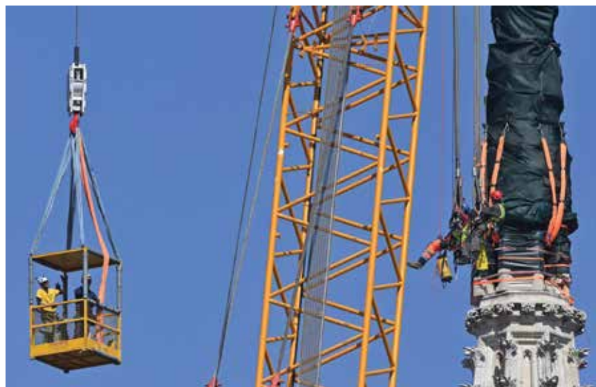
Alpinisti u provedbi povijesne akcije

Završnu radnju prije detonacije i odvajanja ponovno su izveli alpinisti koji su pričvrstili sajle s dizalice za gurtne oko vrha zvonika. Nakon prvog pokušaja učvršćivanja zaključeno je da treba korigirati duljinu sajle, što je uspješno učinjeno u drugome pokušaju. Nakon što su se alpinisti spustili, pristupilo se konačnoj pro-