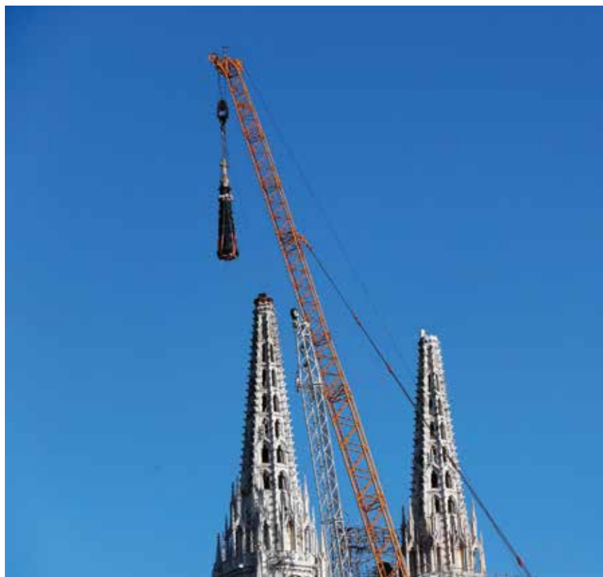
Spuštanje vrha sjevernog zvonika