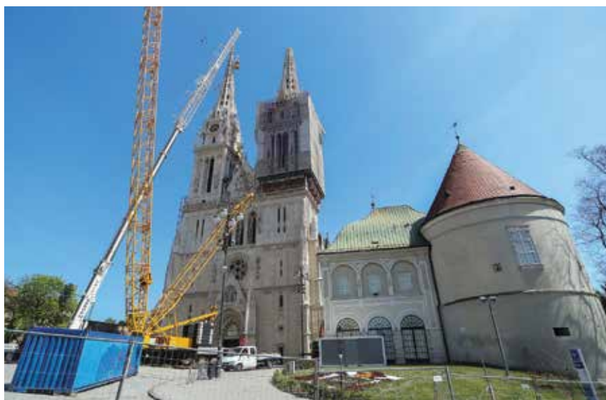
Pripreme za skidanje vrha sjevernoga zvonika trajale su danima

Na snimljenim fotografijama uočena su oštećenja na kamenim elementima sjevernoga tornja. Nakon pregleda dronskih videosnimki potvrđena su znatna oštećenja, a nakon ponovljenoga snimanja za-