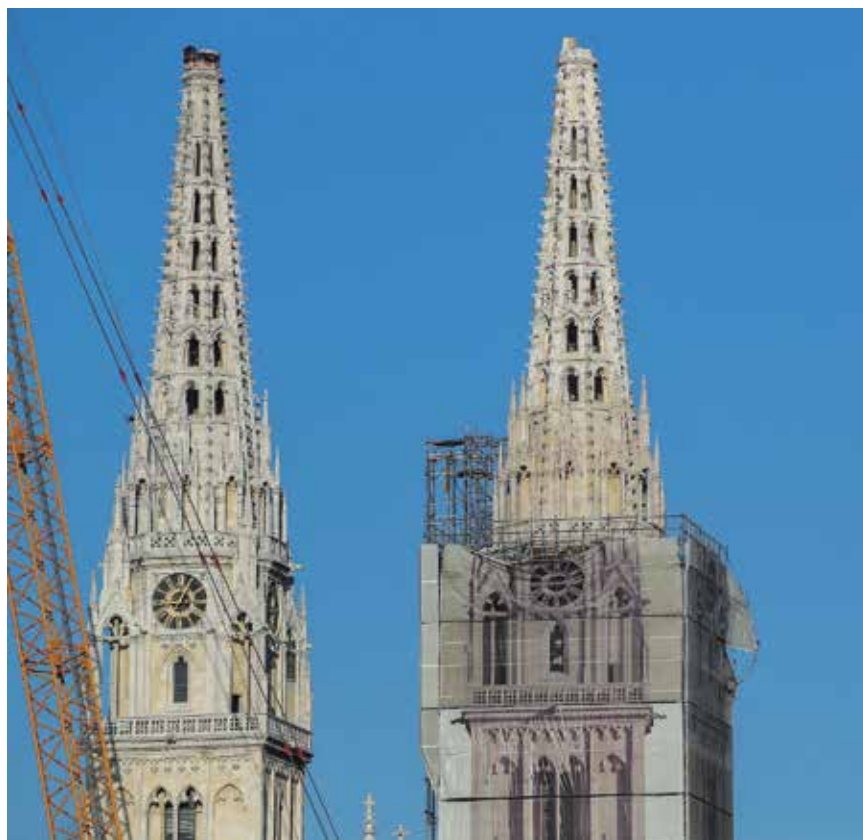
Današnji izgled Zagrebačke katedrale

Bio je to jedinstven, ali i vrlo opasan pothvat, jer u Hrvatskoj do sada nije zabilježena slična operacija uklanjanja dijela građevine na tako velikoj visini. Srećom, zahvaljujući dobroj pripremi te znanju i iskustvu multidisciplinarnoga tima stručnjaka, sve je prošlo u najboljem redu. Najveća opasnost koja je prijetila urušavanjem sakralnoga objekta sada je uklonjena, a zagrebačku katedralu čekaju godine obnove kako bi opet zasjala u punome sjaju.