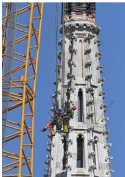
Alpinisti osiguravaju vrh sjevernog zvonika za skidanje

Od 1. do 10. travnja 2020. provodile su se aktivnosti na mjerama hitne sanacije unutar katedrale, demontirano je kompletno svetište s klupama, korom i svim skulpturama i rasvjetom. Alpinisti su se s unutarnje strane sjevernoga tornja uspjeli na visinu od 92 metara i u središte zvonika postavili hrastove drvene klade koje su trebale pomoći pri samom dizanju vrha zvonika.