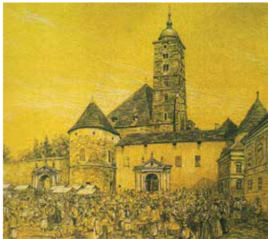
Izgled katedrale prije Velikog potresa 1880.