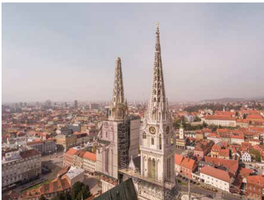
U potresu koji je 22. ožujka 2020. pogodio Zagreb srušen je dio južnog zvonika

Glavni uzročnik propadanja kamena litavca i litotamnijeskoga vapnenca na zagrebačkoj katedrali utvrđen je još prilikom obnove 1938. kada je mineraloškim, petrografskim i kemijskim analizama kao glavni uzročnik površinskoga propadanja kamena tipa “Bizek” utvrđeno to da se događa kemijska transformacija ili pre-