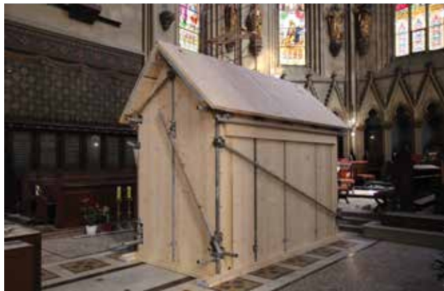
U unutrašnjosti katedrale zaštićeni su sarkofag i svi ostali kipovi i liturgijski predmeti