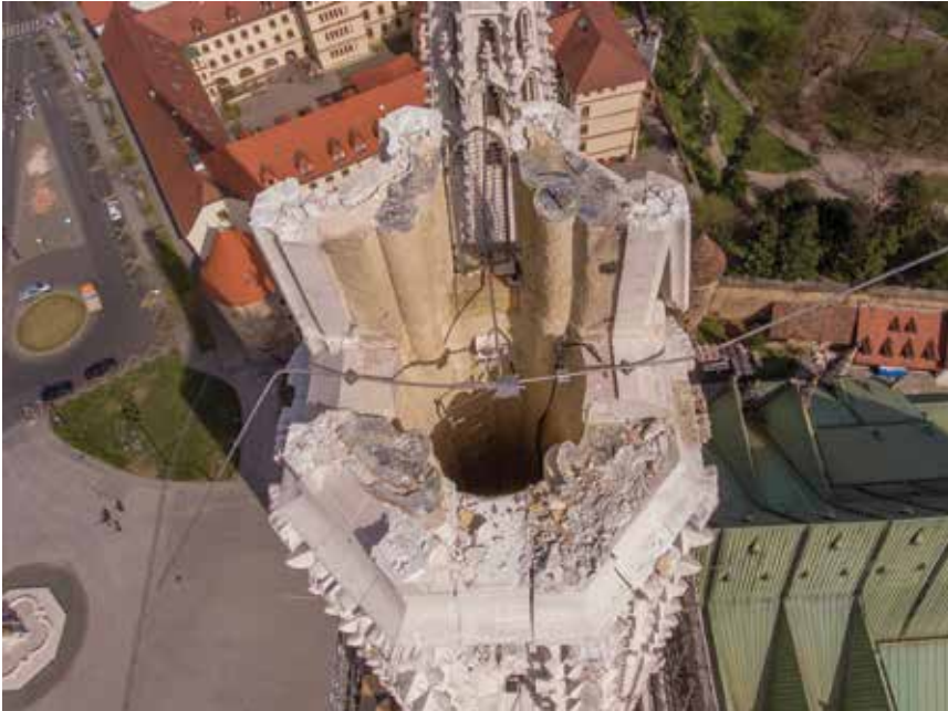
Lom južnog tornja dogodio se na visini lanterne od 93 metra

obrazba kalcita u gips. Do te pretvorbe dolazi pod djelovanjem sulfatno-kiselih oborina na litavac. Nakon toga gips u dodiru s vodom bubri i razara strukturu kamena tako da se on osipa u manjim ili većim komadima. U analizama koje su rađene 1999. sulfati su pronađeni i na dubinama od 20 centimetara. Katedrala se danas obnavlja kamenom tipa S. Pietro classico , a uvozi se iz Italije.