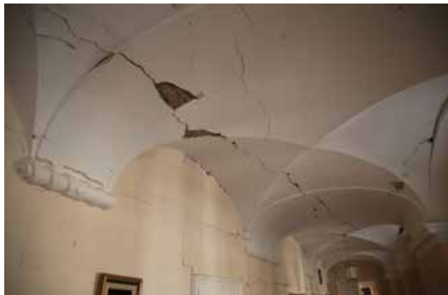
Kompletno svetište i svod u potresu su popucali, a stvarna šteta moći će se procijeniti kada se u katedrali postave skele

Demontirani su i deponirani drveni kipovi proroka u apsidi katedrale te su uklonjeni svi liturgijski predmeti: svijećnjaci, raspela i ostali pokretni dijelovi s oltara. Projektirana je skela unutar apsida i izvan nje. Skele će omogućiti demontažu vrijednih vitraja i oštećenih kamenih elemenata rozeta bifora i trifora. Unutarnja skela služiti će ujedno za podupiranje puknutih svodova te poslije za izvođenje radova na sanaciji. Vanjska skela služiti će i za radove na obnovi vanjskih dijelova pročelja apsida. U unutrašnjosti katedrale stolari su demontirali kompletne rezbarene klupe iz svetišta. Popravljene su rupe na bakrenome limu nastale od krhotina južnoga tornja i uz dva krovna polja na jugu i sjeveru postavljeno je više od 15 m 3 zaštitnoga platna. Na južnim kontraforima demontirani su kameni elementi baldahina.