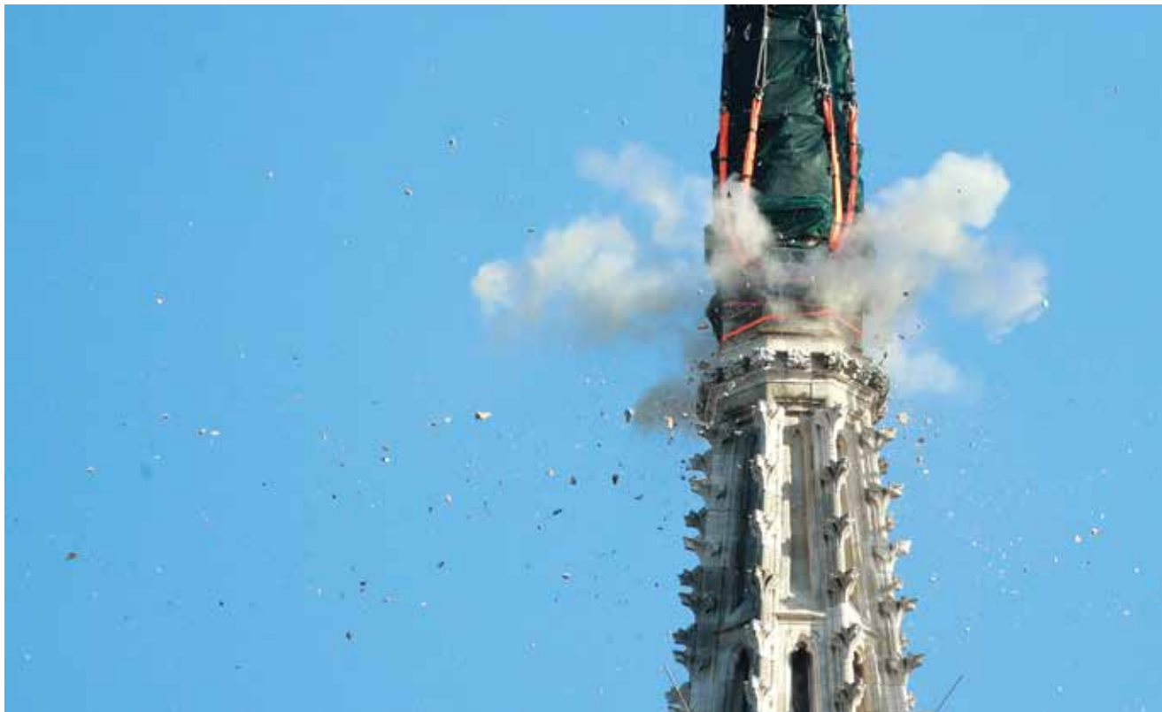
Trenutak detonacije eksploziva koji je korišten za odvajanje vrha zvonika

nost ljudi i katedrale, okupila je čitav niz stručnjaka. Inženjeri, alpinisti, dizalčari, građevinski radnici, pripadnici Hrvatske vojske, stručnjaci s Rudarsko-geološko-naftnog fakulteta Sveučilišta u Zagrebu, policija, snimatelji i drugi zajedničkim su djelovanjem izveli jedinstvenu operaciju sanacije sakralnoga objekta.