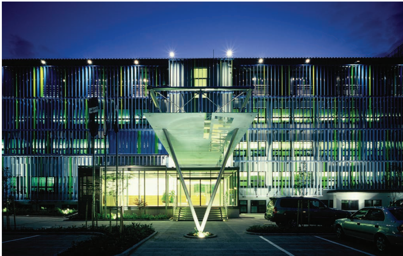
Pročelje poslovne zgrade Plinacro

panoramskih dizala na njegovu mjestu. Ostakljene kabine dizala postavljene su između ostakljenih stijena okna dizala. Tako ulaz u zgradu i stubište koje je njezin glavni prostorno-funkcionalni zglobov postaju najreprezentativniji prostori. Odgovoriti minimalnim brojem neophodnih sredstava pokazatelj je gustoće jezika – takvim višeznačnim, gustim elementima nabijena je dobra arhitektura: kompleksna, a naizgled jednostavna... Takvim tretmanom pročelja postignuta je ravnoteža u mjerilu s užim i širim gradbenim okolišem. Ostvaren je korporacijski identitet, ali kao individualan i kontekstualan, a ne generički i autistički... Upravo na teritoriju najstrožih ograničenja (zaštićeno pročelje) arhitekti su konzekventnim traganjem pronašli vlastito područje izražajne slobode [4].