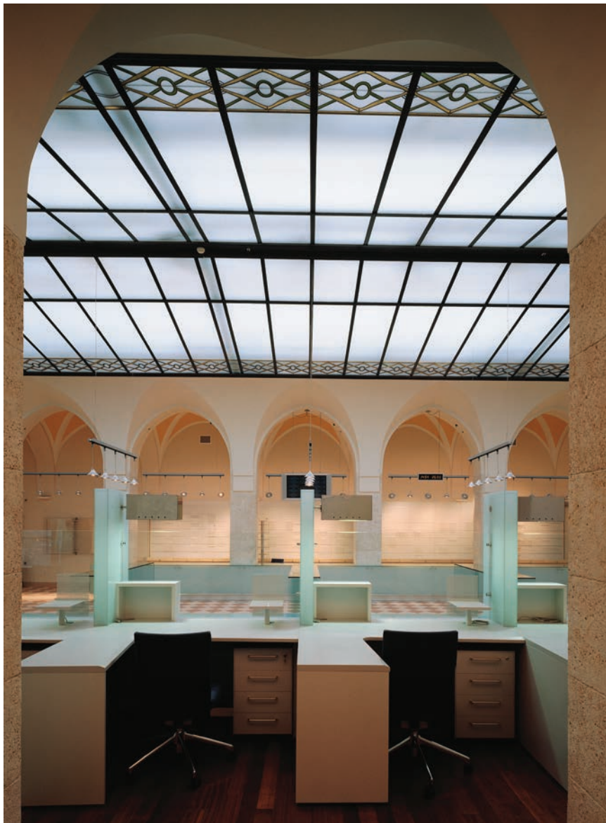
Pogled na veliku dvoranu Glavne pošte, Jurišićeva, Zagreb

stupno u izravnome iskustvu prostora, koje, kada je riječ o arhitekturi, ništa ne može zamijeniti. Redizajn Studija A , koji se temelji na postupku restitucije uvjetovane spomeničkim statusom kuće, poput otkrića nekoga starog notnog zapisa omogućio je posjetiteljima da ponovno čuju dobru staru glazbu. Time je omogućio da izražajnost prostora pokaže sve svoje potencijale i donese suptilne doživljaje i ugodu dobre arhitekture [1].