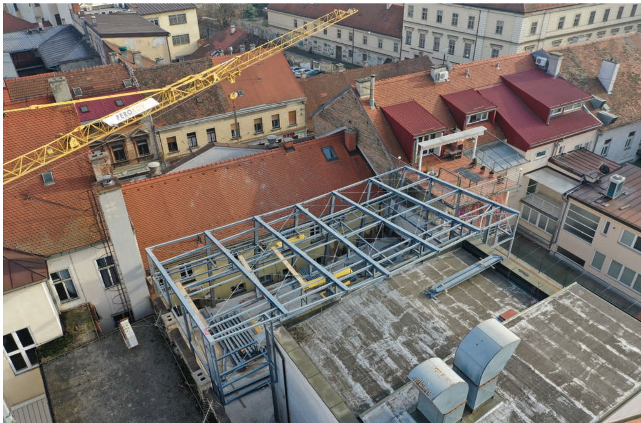
Radovi na dvorišnoj zgradi kazališta Gavella

Prostor kazališta između ulične zgrade u Frankopanskoj ulici 8 - 10 u Zagrebu i dvorišne zgrade, prostor bivšega ulaznog dvorišta, danas atrij kazališta, bio je natkriven krovom koji nije bio odgovarajuće ostakljen te je procurio. S obzirom na to da svakome kazalištu stalno nedostaje prostora za probu i igru, posebno Gavelli , Studio A predložio je sanaciju krova nadogradnjom pomoćne dvorane kao pokusne dvorane kazališta u kojoj bi postojala mogućnost izvođenja predstava manjeg opsega do 120 gledatelja. Dvorana je projektirana kao "lebdeći" objekt iznad prostora "između" i postala je krov atrija te je formirala podne plohe nove dvorane na razini balkona prvoga kata kazališta,