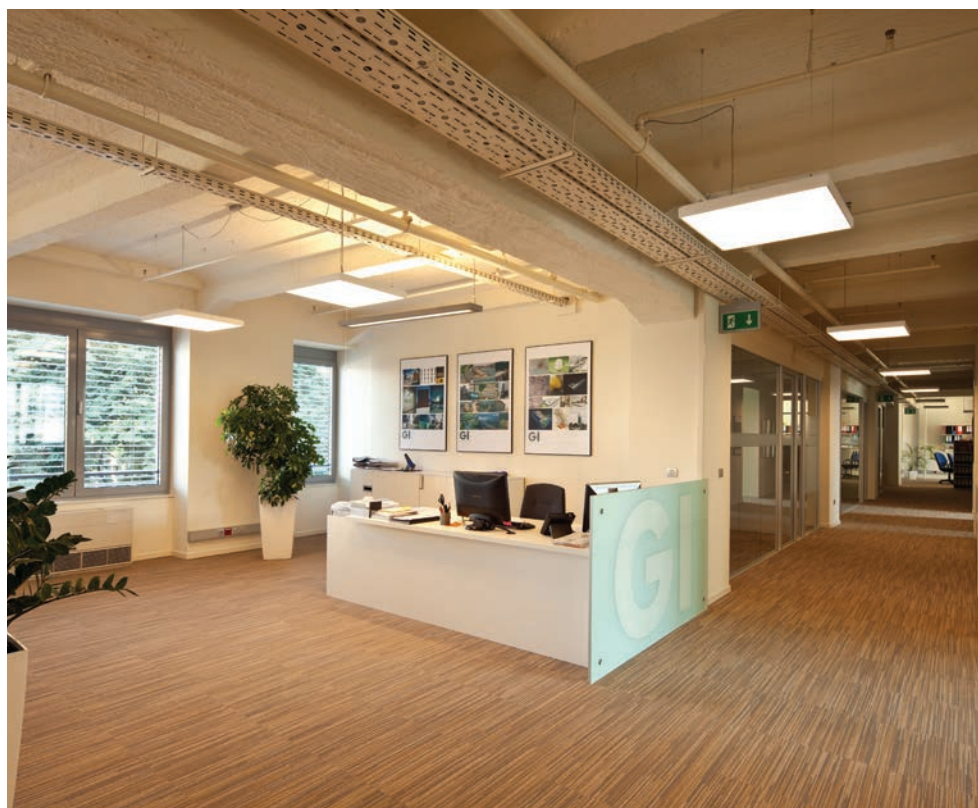
Ulazni prostor ureda u Banjavčičevoj ulici u Zagrebu

Na izvornoj zgradi najveća se izmjena zbila rušenjem mansarde i izgradnjom zamjenskoga kata na njezinome mjestu te smanjenjem veličine lijepih industrij-