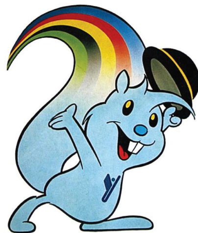
Povod za osnivanje tvrtke bila je Univerzijada '87, na slici popularna maskota Zagi