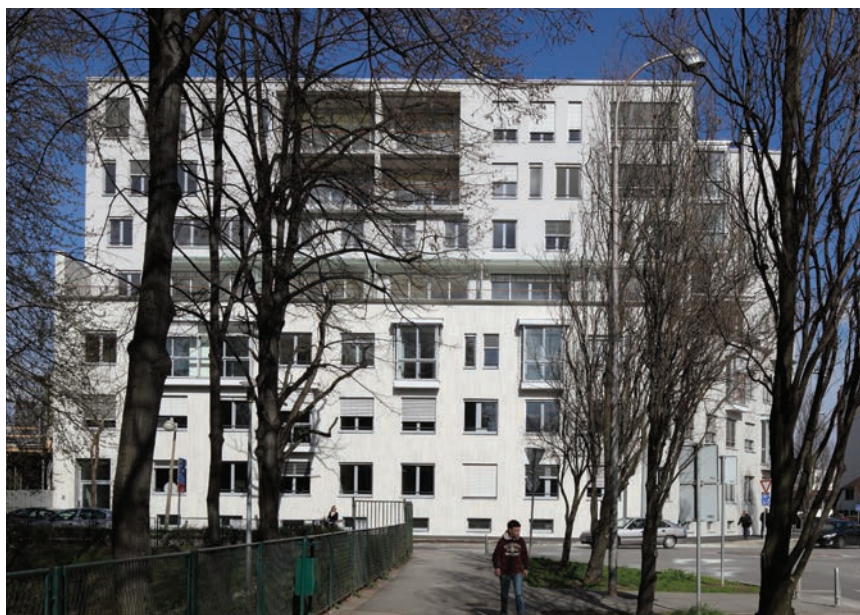
Projektiranje, stručno-financijski nadzor, upravljanje projektom i građenjem - projekt Tuškanova (2008.-2009.), Studio A

Studio A odlikuju timski rad te stalna suradnja s partnerima, klijentima i suradnicima. Djelovanje unutar GI Grupe u stručnome smislu pruža im mogućnost razmjene mišljenja, racionalizacije i stručnoga sučeljanja, a poslove vode najprikladniji stručnjaci, ovisno o kojemu se projektu radi.