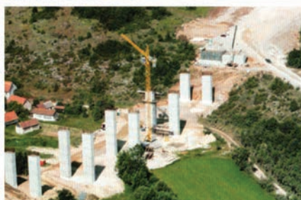
Nadzor nad gradnjom autoceste Zagreb-Split (2002.-2004.), Babića most (gore i dolje desno) i Vijadukt Moko Polje (dolje lijevo)

Na gradnji autoceste Zagreb – Split za investitora Hrvatske autoceste tvrtka je obavila stručni nadzor na dionici od 50 km između Jezerana i Ličkog Lešća. Na izgradnji Hypo Alpe Adria Centra površine 86.000 m 2 obavila je uslugu stručnoga nadzora, projekt menadžera i građevinskoga menadžera. Spomenuti su projekti bitno utjecali na organizaciju i razvoj tvrtke te na njezino pozicioniranje na tržištu.