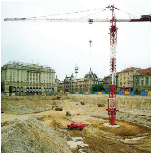
Importane centar u Zagrebu, upravljanje projektom i građenjem (1993.-1995.)

U GI Grupi brinu i o cjeloživotnome obrazovanju svojih zaposlenika. Kako bi aktivno potaknuli zaposlenike na kontinuirano obrazovanje, GI Grupa sponzorira pohađanje stručnih seminara i konferencija kao i daljnje obrazovanje svojih zaposlenika. Unutar Grupe redovito se organiziraju predavanja i rasprave vezane uz projekte na kojima se radi kako bi se stečeno znanje prenijelo svim članovima tima, koji će ih dalje prenositi tijekom rada s klijentima i vanjskim suradnicima. Često se organiziraju i aktivnosti team buildinga poput organiziranoga jedrenja ili obilazaka udaljenih lokacija projekata na kojima se radi.