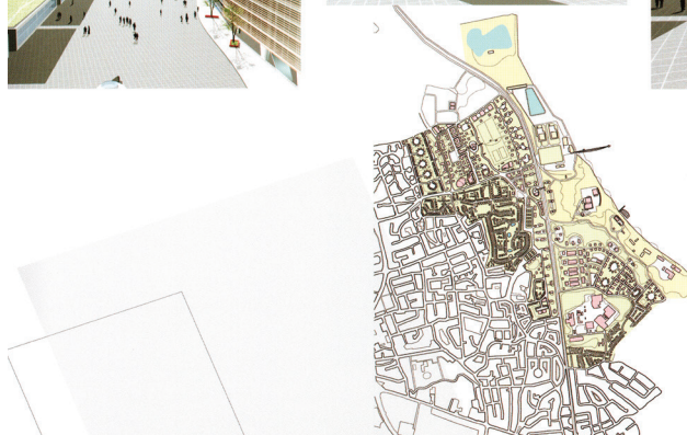
Jedna od brojnih suradnji sa stranim projektnim timovima i investitorima - Thorton urbanistički plan 2001.