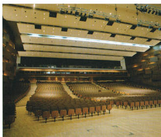
Prvi posao Investinženjeringa - nadzor na adaptaciji Kongresne dvorane Vatroslav Lisinski

Investinženjering je ustrojen kao konzultantska tvrtka u graditeljstvu i bavi se isključivo pružanjem savjetodavnih usluga, nadzorom, projektnim menadžmentom i građevinskim menadžmentom. Inženjer Jeričević objašnjava da pojedinačno, prethodno iskustvo partnera i prvih zaposlenika stečeno na provedbi složenih projekata, tijekom postojanja i razvoja tvrtke prerastalo je u timsko znanje i iskustvo pa se Investinženjering vrlo brzo prilagođavao tržišnim uvjetima te je udovoljavao zahtjevima klijenata u provedbi ugovorenih poslova. Tvrtka je brojčano mala, no dobro organizirana i fleksibilna te klijentima pruža kvalitetne usluge. Neprestanim ulaganjem u vlastiti kadar izborila se za svoje mjesto na tržištu. Sposobna je paralelno provesti više složenih projekata u sklopu svoje osnovne djelatnosti.