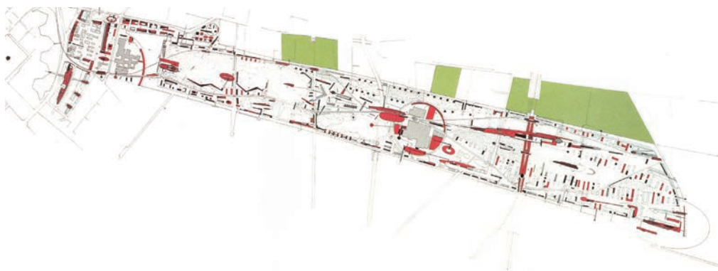
Natječaj Orestaden (1994.-1996.), projekt Tower 151 Architects