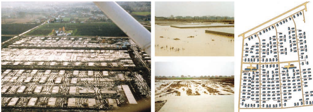
Konzalting, urbanizam, projektiranje i nadzor naselja za prognanike Rakovci (1992.-1994.)

pokazalo dobrom odlukom. Jedinstvenost se temelji na motiviranosti koja izvire iz grupnoga potencijala za provedbu zajedničkih i parcijalnih interesa, a tek potom iz vlasničke strukture. Zajedništvo se unutar grupe temelji na međusobnome poštovanju i razumijevanju zajedničkoga i pojedinačkoga položaja na tržištu arhitektonskih, konzultantskih i inženjerskih usluga.