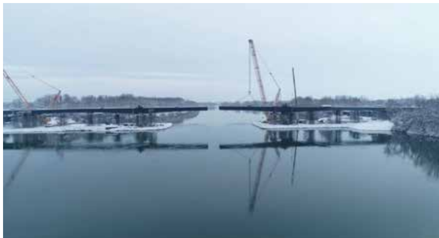
Pogled na gradilište, snimljeno u veljači 2019.

dilište. Na gradilištu je okrupnjena u veće sklopove (makroelemente) koji su bili deponirani unutar inundacije rijeke Save. Spajanje obiju strana mosta trajalo je četiri dana, a most je spojen 28. veljače 2019. Montaža makroelemenata na glavnome rasponu izvedena je uz pomoć 600-tonskih dizalica. Broj radnika na gradilištu, ovisno o zahtijevnosti pojedinih projektnih stavki, varira između 50 i 150.