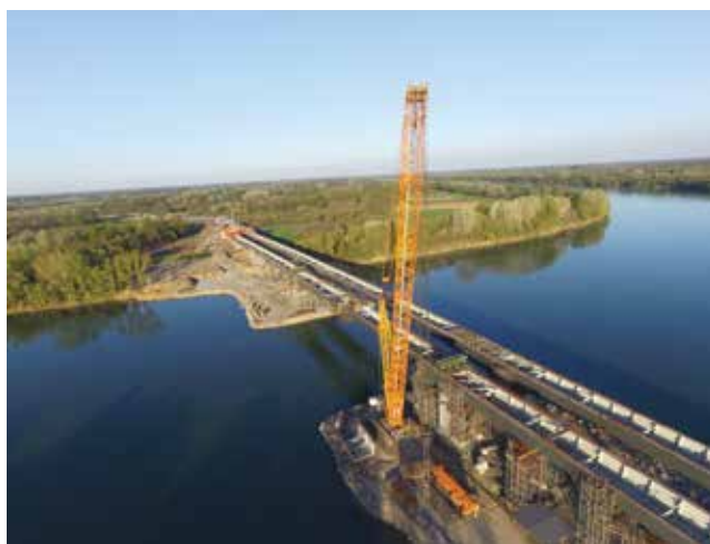
Detalji s gradilišta

Ukupna širina mosta jest 13,50 + 2,0 + 13,5 = 29,0 m. Tlocrtno je u pravcu, a niveleta je u vertikalnoj kružnici R = 10000 m. Cijela je građevina dilatacijska cjelina,