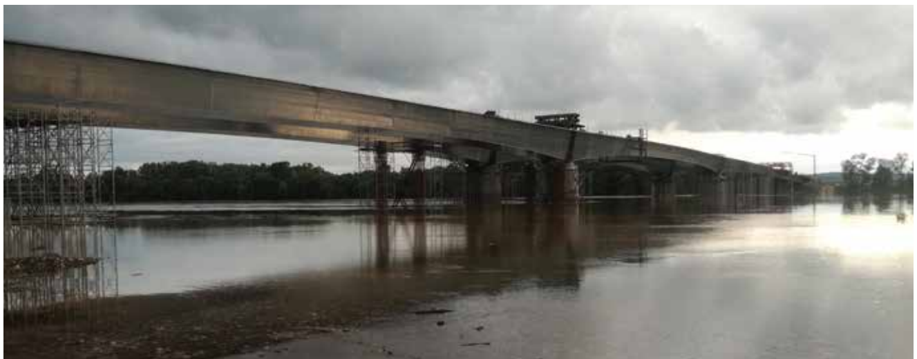
Most snimljen nakon spajanje obiju strana

Otvori rasponskog sklopa su 70,0 + 85,0 + 100,0 + 130,0 + 100,0 + 85,0 + 70,0 = 640,0 m između osi upornjaka. Čelična rasponska konstrukcija mosta izvedena je u segmentima i montirana dizalicama s terena uz izvedbu pomoćnih stupova za pridržanje montažnih segmenata, osim srednjega otvora, gdje je izvedena slobodnom konzolnom gradnjom, simetrično s obje strane mosta.