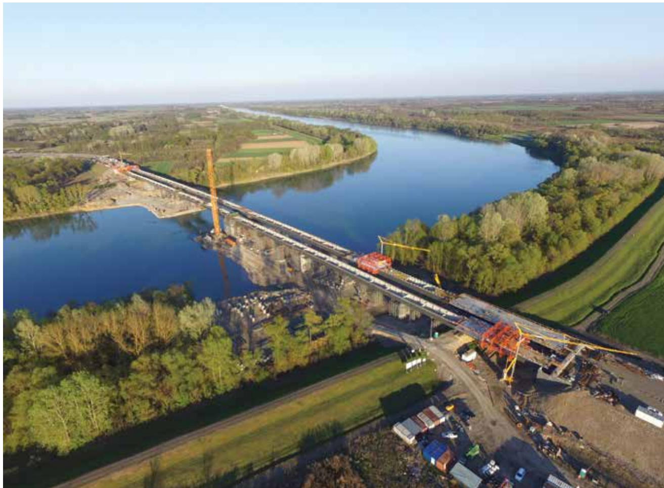
Pogled iz zraka na gradilište mosta Svilaj