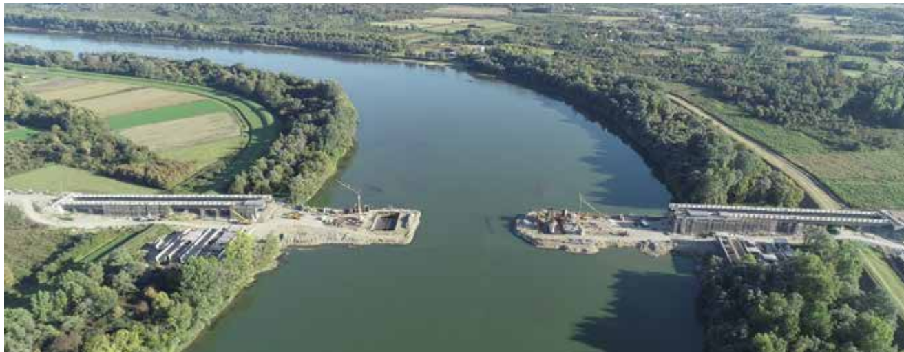
Pogled na gradilište prilikom izgradnje stupa u koritu rijeke Save

tehničkim uslugama. Na koridoru Vc Hering je uspješno dovršio radove na složenim objektima poput poddionice Drivuša – Klopče u Zenici, čije smo gradilište posjetili i prikazali u Građevinaru 6/2017.