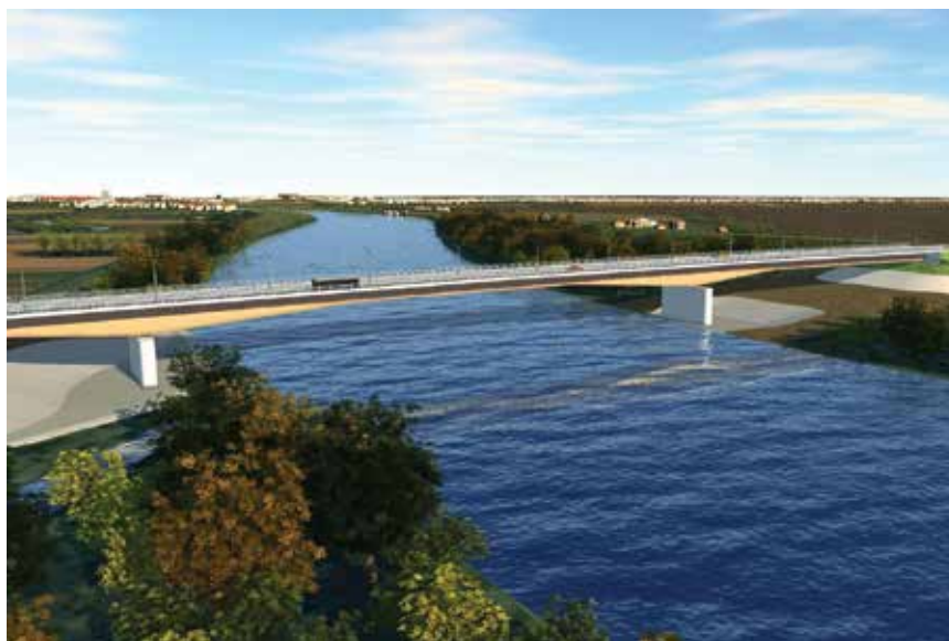
Vizualizacija mosta Gradiška

Most kod Gradiške bit će dug 462 m i širok 22,6 m. Imat će četiri prometna traka, od kojih će svaki biti širok 3,75 m. Glavni rasponski sklop preko rijeke i poplavnoga dijela obale čini čelični sandučasti nosač s tri raspona, od kojih je onaj središnji, preko plovnoga korita rijeke Save, dug 170 m. Minimalna širina plovnoga gabarita ispod mosta iznositi će 91 m. Temeljenje će biti na pilotima. Kada novi most bude izgrađen, promet više neće teći kroz središte Gradiške. Procjenjuje se to da će za desetak godina preko novoga mosta prelaziti čak