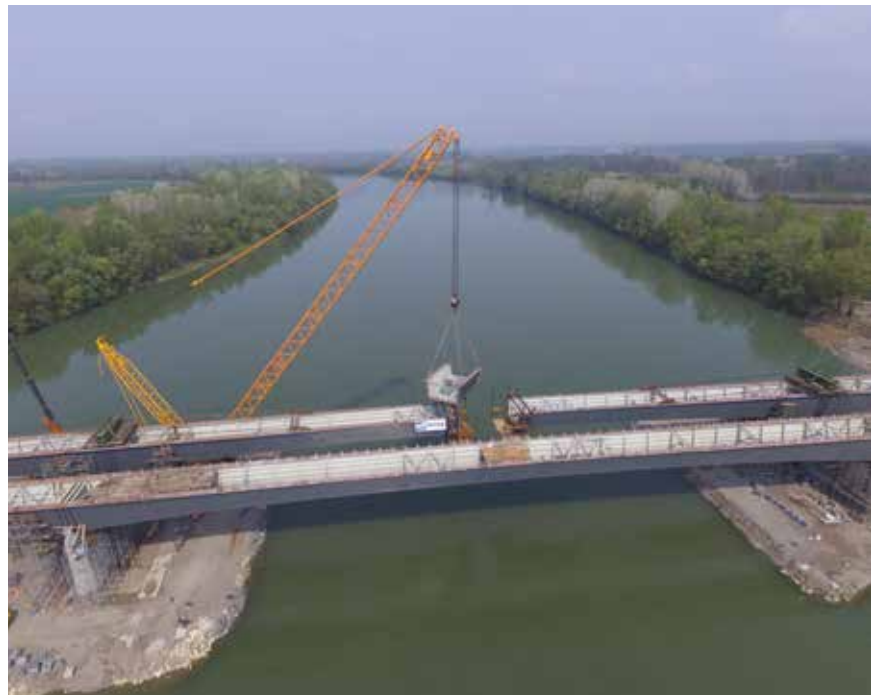
Ugradnja posljednjeg makroelementa čelične konstrukcije mosta

a prijelazne naprave nalaze se na upornjacima. Temeljen je na armiranobetonskim pilotima promjera 150 cm i duljine 18 m. Temeljenje stupova izvedeno je tako da je naglavna greda pravokutnoga oblika oslonjena na armiranobetonske pilote promjera 150 cm i duljine 18 m. Prema glavnome projektu, predviđeno je šest stupnih mjesta različitih dimenzija. Stupovi su punoga eliptičnog presjeka i temelje se na temeljima prvokutnoga oblika koji su na pilotima dužine od 18 do 20 m. Upornjaci su monolitne izvedbe, potkovastog oblika, jedinstveni za oba mosta. Temelj je upornjaka pravokutan i s 12 pilota, čiji promjer iznosi 150 cm. Za poprečni presjek kontinuiranoga sklopa odabran je spregnuti sandučasti nosač promjenjive visine, s horizontalnom donjom pločom ukrućenom torzijski krutim trapeznim rebrima. Čelik je za sve dijelove konstrukcije isti (kvaliteta S355J2G3).