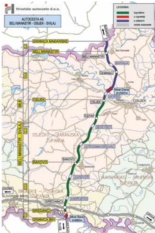
Shematski prikaz autoceste A5 Beli Manastir - Osijek - Svilaj