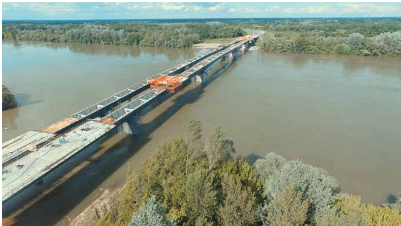
Pogled na gradilište mosta iz zraka