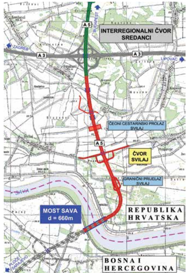
Položaj mosta Sava (Svilaj) na zemljovidu