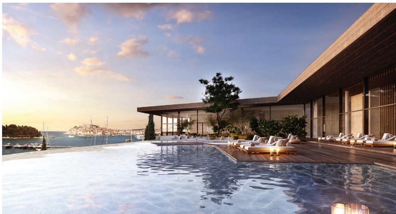
Infinity pool na najvišoj etaži hotela

ne površine, koje se prostiru na svakoj etaži s morske strane, a na kraju ulaze u prirodni okoliš. U konstrukciji su one izvedene armiranobetonskim zidnim nosačima nestandardnog oblika koji se pružaju kroz sve etaže okomito na morsku obalu. Drugim riječima, one su zapravo izvedene kao ravni krovovi iznad soba pa je trebalo osmisлити kvalitetno projektantsko rješenje detalja hidroizolacije, što je ujedno zahtijevalo maksimalnu pozornost i kvalitetu izvođača prilikom izvođenja.