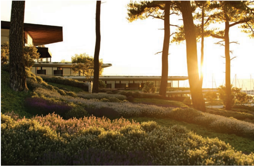
Grand Park projektiran je kao hotel u šumi

izgrađeni zajednički bazenski kompleks hotela Eden i Lone te restoran Oleander . Uz to je u cijelosti preuređen wellness i spa -centar u Edenu. Te su godine ukupna ulaganja iznosila oko 50 milijuna kuna. Cijelo područje uvale Lone, plaža i šetnica u cijelosti su obnovljeni 2014. investicijom od približno 25 milijuna kuna. Projekt plaže Mulini osvojio je brojne domaće i međunarodne arhitektonske nagrade.