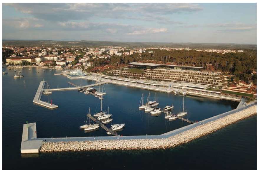
Pogled na novu ACI marinu ispred hotela Park

To je marina na Jadranu koja posluje u segmentu luksuza, kako u smislu uređenja