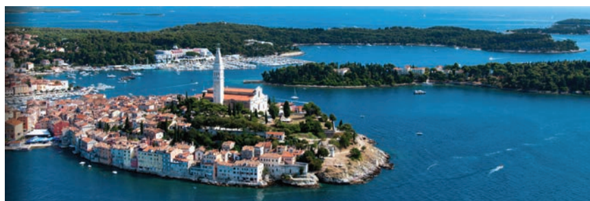
Pogled na Rovinj i turističku zonu Monte Mulini u pozadini

Dvije godine nakon što je otvoren hotel Monte Mulini , prve goste primio je hotel Lone . U njegovu gradnju Adrisova tvrtka kći Maistra uložila je oko 350 milijuna kuna, što je do danas čini jednom od najvećih greenfield investicija u hrvatski turizam. Lone je bio prvi dizajnerski hotel s pet zvjezdica u Hrvatskoj, a koncipiran je kao hotel za kongresni turizam te uz desetak kongresnih dvorana, od kojih najveća raspolaže sa 600 mjesta, nudi wellness i spa-centar na 1700 četvornih metara. Osmislio ga je renomirani tim hrvatskih kreativaca mlađe generacije; arhitekata, konceptualnih umjetnika, produkt, modnih i grafičkih dizajnera. Adris grupa d.d. nastavila je s investicijama u zonu Monte Mulini i 2013., kada su