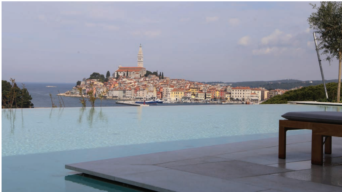
Pogled na stari grad Rovinj iz hotela

stičke ponude. U ovom ćemo prilogu opisati projekt izgradnje Grand Park Hotela , no prije toga ukratko ćemo prikazati plan razvoja turističke zone u kojoj je izgrađen.