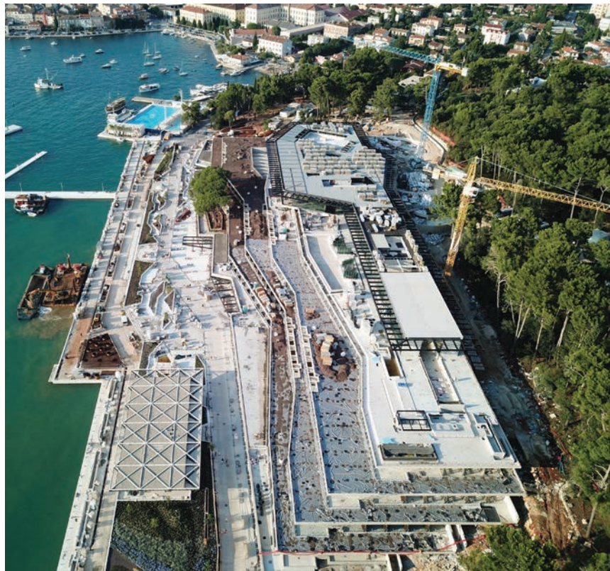
Pogled na gradilište

Kopneni dio funkcionira kroz dvije konceptijske razine: reprezentativnu, koja predstavlja prvi kontakt nautičara s marinom u Rovinju (od recepcije preko restorana / caffe-lounge bara do agencija i trgovina) i u interakciji je s korisnicima javnih gradskih i turističkih sadržaja poput prolaznika na šetnici ili gosta Grand Park Hotela , i operativnu, koja je u funkciji servisa i pružanja usluga korisnicima marine. Sklop marine je oblikovan u jedinstveni volumen umetnut u koncept šetnice i vidljiv je isključivo svojim pročeljem na razini obale. Iznimku čini ostakljeni restoran / caffe lounge bar koji se uz klupe za sjedenje, zelene otoke i urbane atrakcije nalazi na krovu građevine i proširuje sadržaje gradske šetnice. Slučajni prolaznik usmjerava se na komercijalne sadržaje, daleko od servisa i tehničkih prostora marine, a nautičar jasnim sustavom signalizacije biva vođen kroz njemu namijenjene sadržaje. Promet iz smjera grada diskretno je spušten na kotu obale gdje je omogućen pristup interventnim vozilima i vozilima dostave te osiguran dio parkinga za potrebe marine. Vidljivo pročelje na koti obale