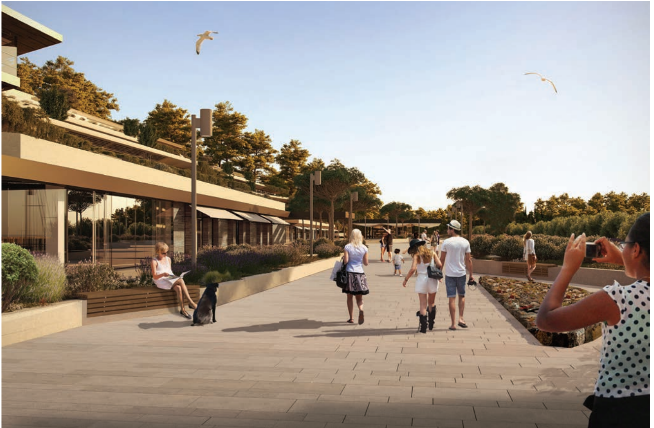
Šetnica ispred hotela

Sobe su površine 40 m 2 , a apartmani i do 175 m 2 , a većina soba ima i manje hidromasažne bazene, tzv. plunge pool. Zanimljivo je da su bazeni, ulazni lobi i recepcija, restorani i kongresne dvorane na najvišoj etaži, a sobe na nižim razinama. Uz arhitekta i projektanta svi angažirani izvođači radova su iz Hrvatske. Gradilište je završeno i opremljeno u ožujku 2019., a nakon svečanog otvorenja hotel je i službeno otvoren za novu turističku sezonu.