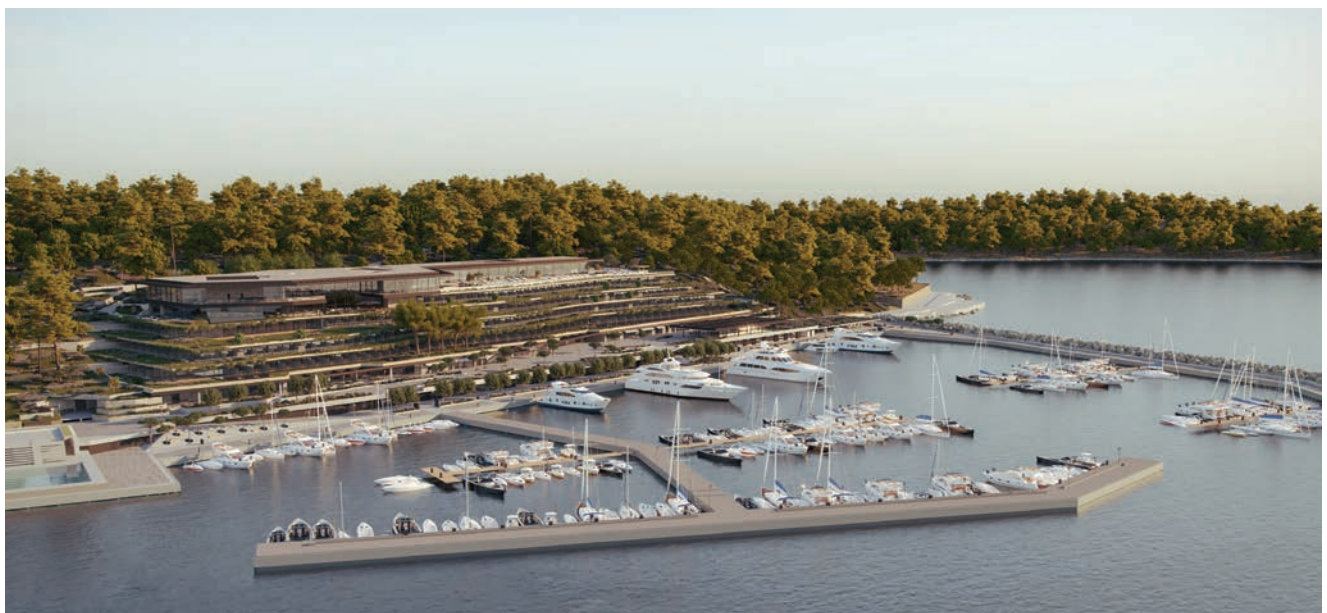
Pogled na Grand Park Hotel i ACI Marinu Rovinj

Tom je investicijom zapravo zaokružena ponuda turističke zone Monte Mulini , koja će u konačnici obuhvaćati četiri hotela: Lone , Monte Mulini , Eden i Park te sve ostale prateće sadržaje. Tako će svi međusobno prostorno bliski i dijelom povezani hoteli poboljšati svoje mjesto na tržištu, produljiti svoje poslovanje na cijelu godinu i dostići punu učinkovitost. To postižu tzv. MICE ponudom (kratica od meetings – sastanci, incentives – promotivni skupovi, conventions – kongresi i exhibitions – izložbe), što neće utjecati na standardnu turističku ponudu povezanu s iskorištavanjem slobodnog vremena i godišnjih odmora. Kategorizacija hotela od četiri i više zvjezdica postignuta je brownfield investicijama, odnosno rušenjem starih hotela i izgradnjom novih radi podizanja standarda i kvalitete turi-