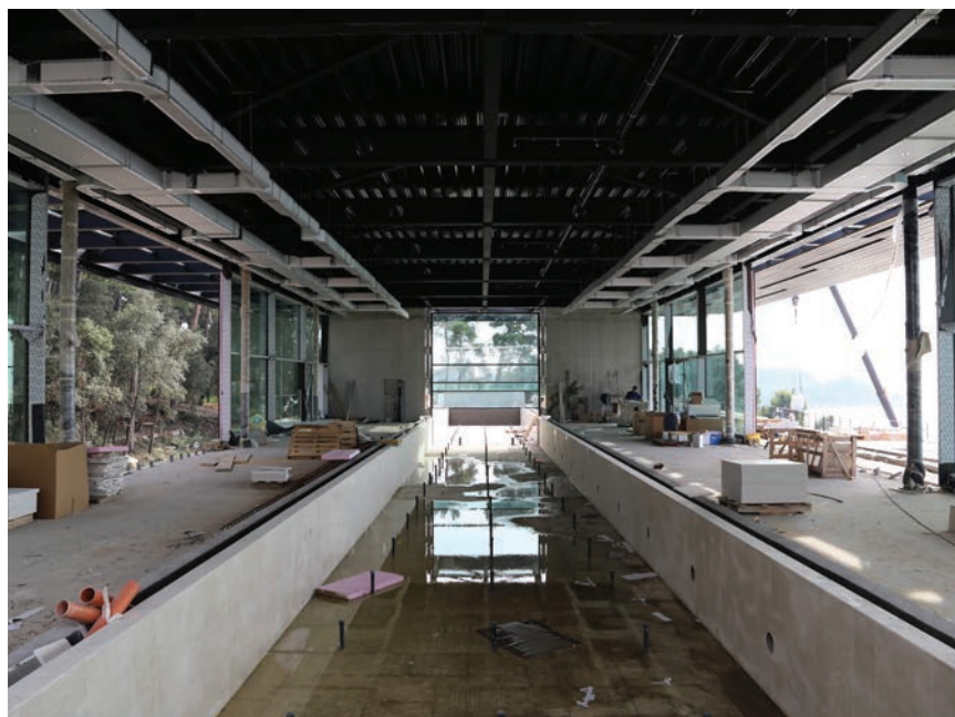
Detalj s gradilišta

nome, nadzemnome dijelu s pogledom na more sadrže smještajne jedinice, dok su u podzemnome, ukopanome dijelu prostori servisa i garaže. Etaža prizemlja, koja je u razini šetališta i trga ispred hotela, uz još jedan ulazni prostor za goste sadrži trgovačke i ugostiteljske prateće sadržaje.