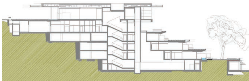
Poprečni presjek građevine