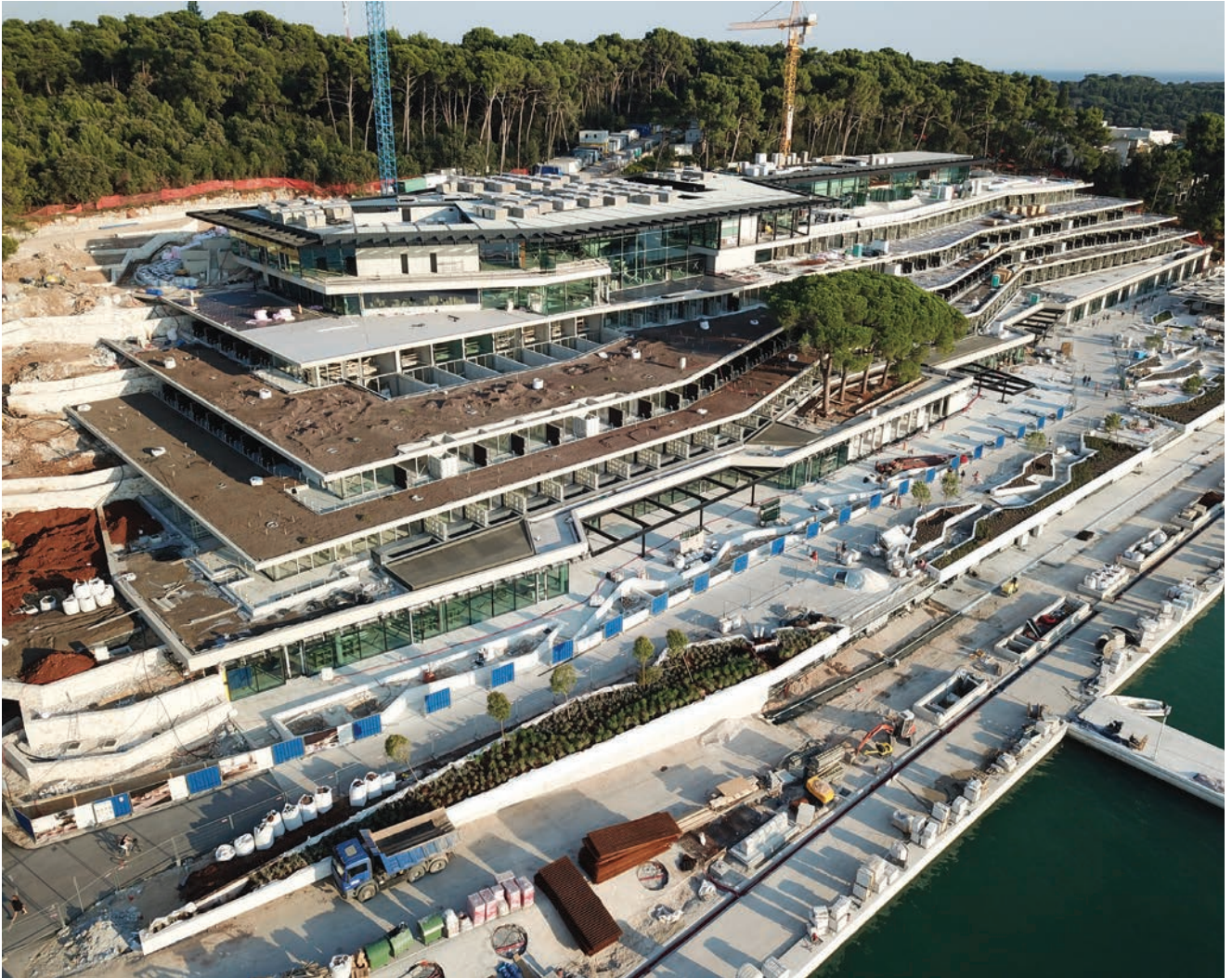
Pogled iz zraka na gradilište hotela, snimljeno u listopadu 2018.

u širem kontekstu spaja staro gradsko tkivo s turističko-parkovnim prostorima zone Monte Mulini te je zamišljena kao trg s različitim sadržajima – zonama mirovanja, druženja i okupljanja nadopunjena trgovačkim i ugostiteljskim sadržajima hotela Park . Vodenim površinama, popločenjem i zelenilom stvoren je ugodan ambijent, uokvirene su pojedine sadržajne cjeline te je čitav prostor postao atraktivan i pristupačan.