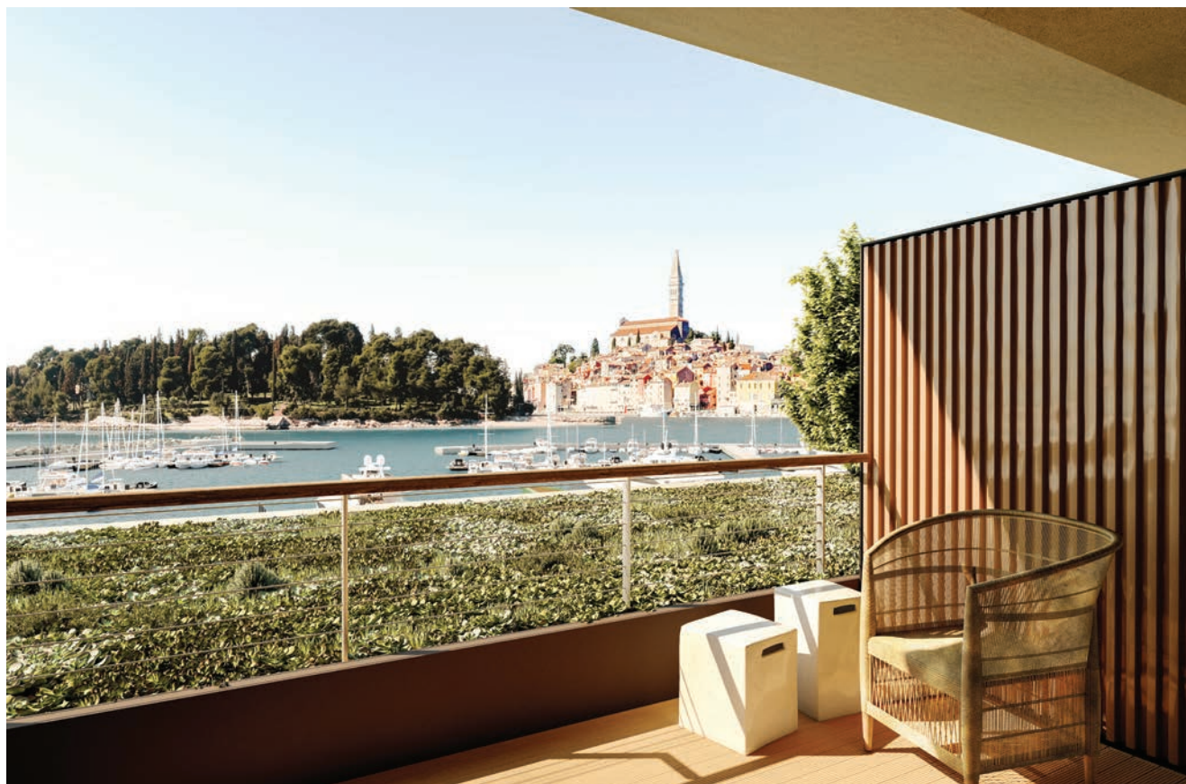
Pogled iz soba na marinu i stari grad

Radovi su počeli u jesen 2016. uklanjanjem staroga hotela koji je na tome mjestu izgrađen 70-ih godina prošloga stoljeća i poslije nekoliko puta rekonstruiran