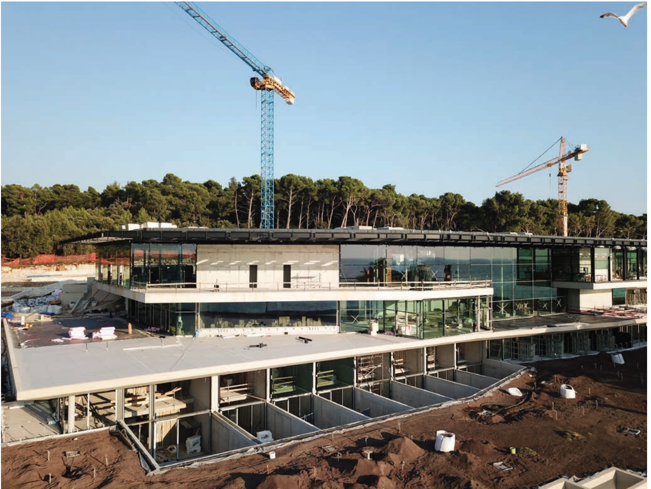
Pogled na kongresnu dvoranu u kojoj je postavljena staklena stijena dimenzija 15 x 3,5 m