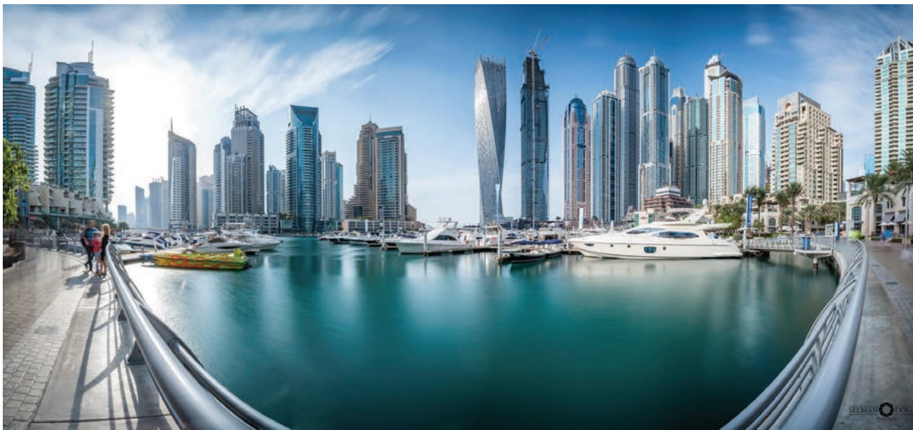
Panorama Dubajja

Prva asocijacija na spomen Dubaia, jednog od sedam Ujedinjenih Arapskih Emirata, je raskoš. To odredište slovi kao turistička meka i središte poslovnog svijeta. Gotovo je teško povjerovati u to da je nekada jedino prijevozno sredstvo u Dubajju bila deva. Prije manje od jednog stoljeća Dubaj je bio tek selo u pustinji kojim su lutala beduinska plemena i doseljenici, a glavne su djelatnosti stanovnika bile ribolov te uzgoj školjki. Situacija se drastično promijenila s pronalaskom tzv. crnog zlata pa se to ribarsko mjesto pretvorilo u jedan od najbogatijih svjetskih gradova koji svojim posjetiteljima nudi luksuz kakav mnogi mogu samo sanjati. Procjenjuje se to da se na području UAE-a nalazi oko 10 posto svjetskih rezervi nafte, no većina se rezervi ne nalazi u Dubajju, već u susjednome Abu Dhabiju. Upravo je to jedan od glavnih razloga zbog kojih Dubai postaje sve veće turističko i trgovačko odredište.