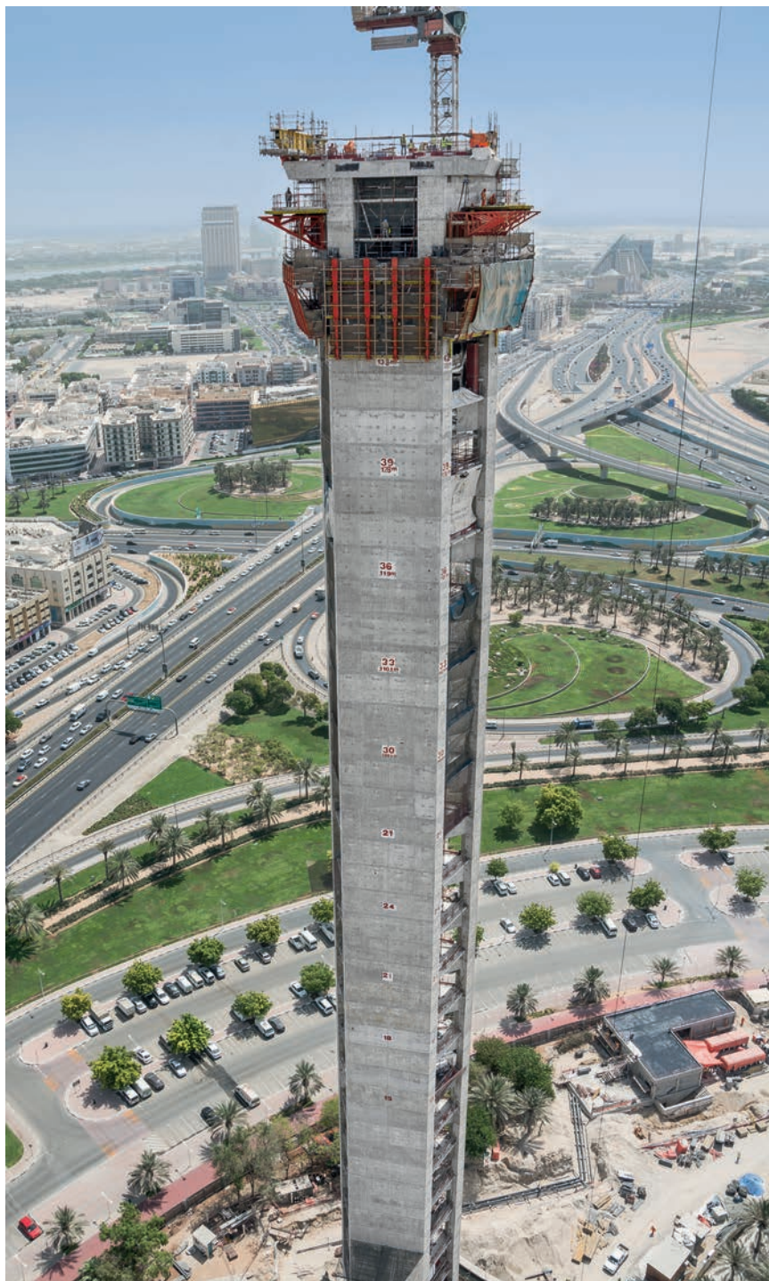
Dubai Frame izveden je tzv. tehnologijom penjajućih oplata

U projekt je uloženo približno 45 milijuna dolara, a njegov je vanjski dizajn inspiriran logom Expoa 2020. Prema nekim procjenama, godišnje će ga posjećivati približno dva milijuna posjetitelja. Ta brojka možda i ne čudi ako se uzme u obzir činjenica da se sve dnevne ulaznice za tu atrakciju rasprodaju u rekordnom roku, a novi vidikovac privlači turiste iz cijelog svijeta koji uživaju u pogledu na futurističke nebudere, ali i nova gradilišta. U ovome trenutku Dubai ulaže desetke milijardi dolara u Svjetsku izložbu 2020. Vrijednost projekata povezanih s izložbom, prvom takvom na Bliskome istoku, u ožujku 2018. iznosila je čak 42,5 milijardi dolara. Među većim je projektima proširenje međunarodne zračne luke Al Maktoum koja će nadopuniti postojeći aerodrom. Emirat također ulaže 2,9 milijardi dolara u novu liniju metroa koja će glavne točke povezivati s izložbenim prostorima. Vlasti u Emiratima očekuju da će Expo 2020. potaknuti tržište nekretnina i sektor hotelijerstva te otvoriti 300.000 radnih mjesta.