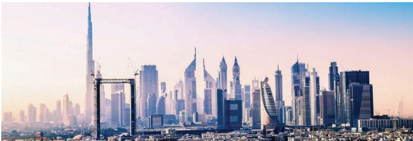
U kadru Dubai Framea nalazi se Burj Khalifa

http://www.thedubaiframe.com/ https://www.peri.ae/projects/skyscrapers-and-towers/dubai-frame-project.html https://www.designbuild-network.com/projects/dubai-frame-dubai/