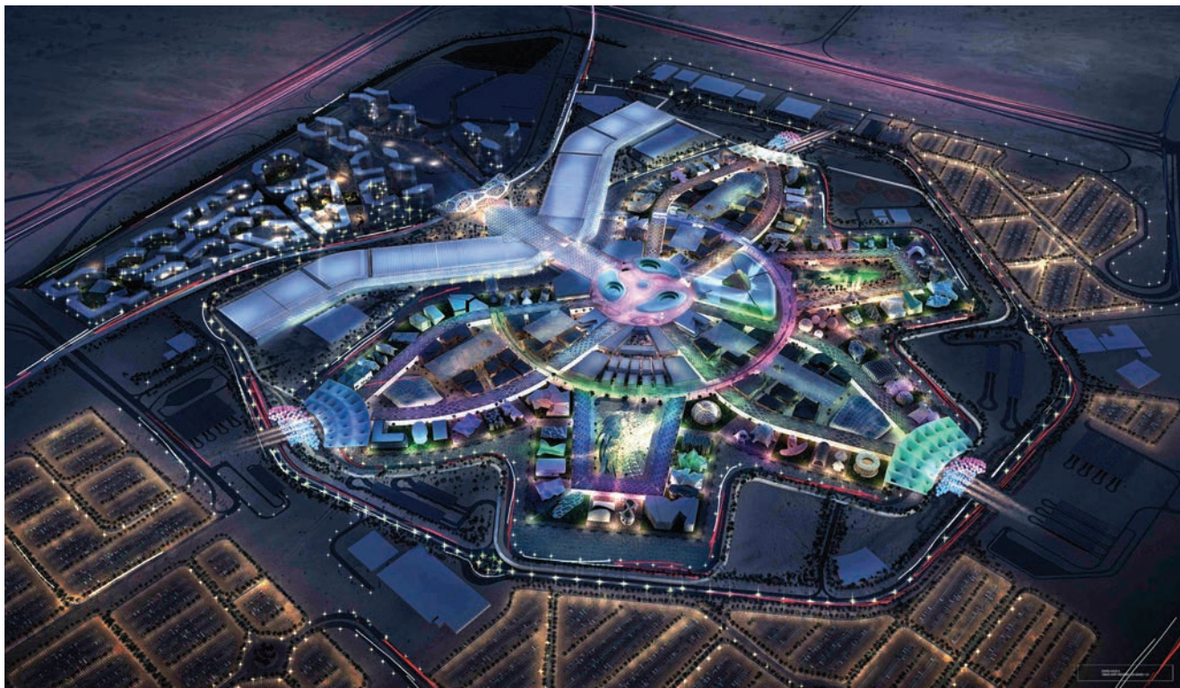
Vizualizacija izložbenog prostora za World Expo 2020

mobilitnosti. Veliki trg koji će se nalaziti u središtu projekta zamišljen je kao prostor za prezentacije i raspravu te će biti glavno mjesto "povezivanja" posjetitelja.