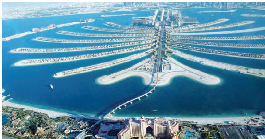
Pogled na Dubai Palm

Povijest Dubajja vodi u davnu 1830. kada ga je preuzela obitelj šeika Maktouma, čiji potomci i danas upravljaju gradom i istoimenim emiratom. Šeik Rashid bin Saeed Al Maktoum razvio je ideju kako Dubai učiniti bogatim gradom, jer rezerve nafte ondje nisu vječne. Tako je počeo razvijati emirat i istoimeni grad, pretvarajući ga u vodeće svjetsko turističko mjesto. Sav novac koji je zaradio na nafti potrošio je na brzu izgradnju metropole. Čak je stranim trgovcima koji su tada trgovali biserima, ribom i začинима ukinuo obvezu plaćanja poreza, što je privuklo mnogo trgovaca iz svih dijelova svijeta,