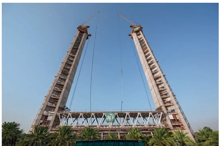
Detalj s gradilišta

Oba tornja izvedena su kombinacijom čeličnih i betonskih konstrukcija s tlocrtom u obliku trapeza. Unutar zavojite jezgre morali su se betonirati dijelom