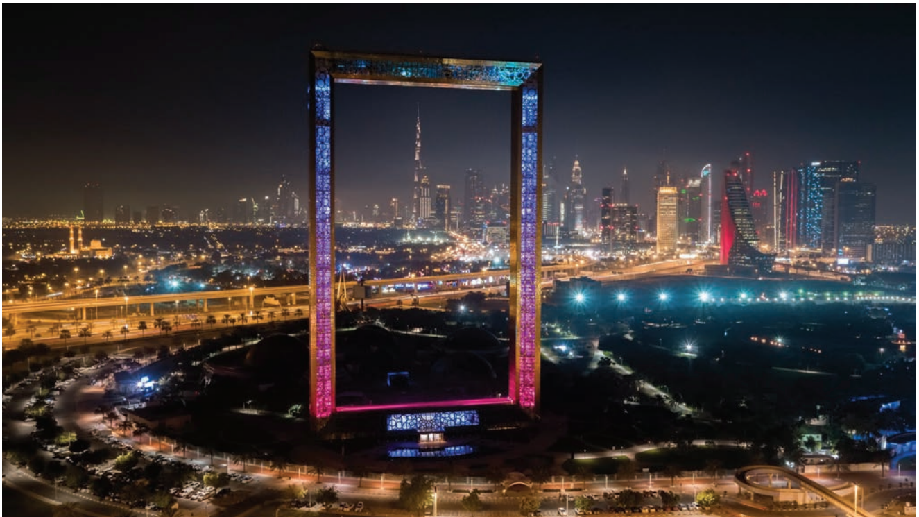
Nova atrakcija u Emiratima – Dubai Frame

Na donjim je katovima smješten muzej koji podsjeća na put koji je Dubai prešao od ribarskog sela tijekom 90-ih godina prošlog stoljeća do danas svjetski poznatoga turističkog odredišta.