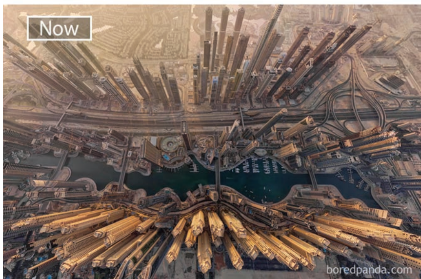
Usporedba Dubajja snimljenog 90-ih godina prošlog stoljeća i današnjega grada

Povijest Dubajja vodi u davnu 1830. kada ga je preuzela obitelj šeika Maktouma, čiji potomci i danas upravljaju gradom i istoimenim emiratom. Šeik Rashid bin Saeed Al Maktoum razvio je ideju kako Dubai učiniti bogatim gradom, jer rezerve nafte ondje nisu vječne. Tako je počeo razvijati emirat i istoimeni grad, pretvarajući ga u vodeće svjetsko turističko mjesto. Sav novac koji je zaradio na nafti potrošio je na brzu izgradnju metropole. Čak je stranim trgovcima koji su tada trgovali biserima, ribom i začинима ukinuo obvezu plaćanja poreza, što je privuklo mnogo trgovaca iz svih dijelova svijeta,