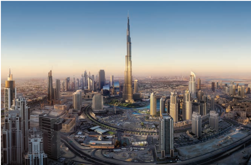
Pogled na najvišu zgradu u Dubaiju – Burj Khalifa

debljine 3,8 cm, a koji je tri puta deblji od leda na klizalištima u američkoj hokejskoj NHL ligi. Najveći grad Ujedinjenih Arapskih Emirata može se pohvaliti i brojnim poslovnim kompleksima, muzejima te golemim džamijama.