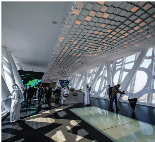
Fasada konstrukcije inspirirana je logom Svjetske izložbe 2020.

prihoda. Svjesni toga da se zalihe tzv. crnog zlata bliže kraju (neke prognoze daju im još samo pet godina), Emiračani su mudro i na vrijeme odlučili investirati u turizam, građevinarstvo i stvaranje novih poslovnih prostora. Fasadu jedne kuće u starome dijelu Dubajja krase izreka koja glasi: "Uspjeh nije stvar slučajnosti, već rezultat čovjekova truda" i ona možda najbolje opisuje mentalitet Emiračana. Megalomaniji, naravno, nema kraja pa Dubai planira uložiti još 1,7 milijardi dolara u novi megaprojekt Marsa Al Arab , luksuzno odmaralište koje bi trebalo povećati broj posjetitelja Ujedinjenih Arapskih Emirata na 20 milijuna na godinu. Nasipavanje i gradnja dvaju novih otoka također je dio priprema za Svjetsku izlož-