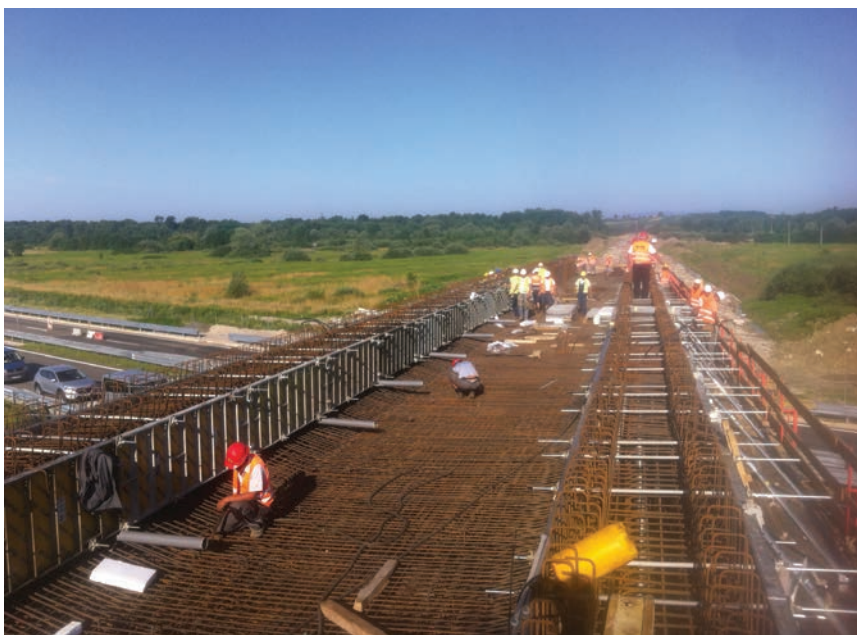
Postavljanje armature na nadvožnjaku HŽ-HAC

Izrada tehničke dokumentacije toga projekta započela je još 2003. godine. Prve dozvole potpisane su 2006., a do sada su ishođene tri lokacijske, dvije građevinske dozvole, dvije potvrde projekta te njihove izmjene i dopune te produljenja. Doznali smo to kako je u pripreмноj fazi projekta najveći problem stvaralo rješavanje imovinsko-pravnih odnosa. Naime, ukupno je u otkupu bilo 1078 katastarskih čestica u sedam katastarskih opći-