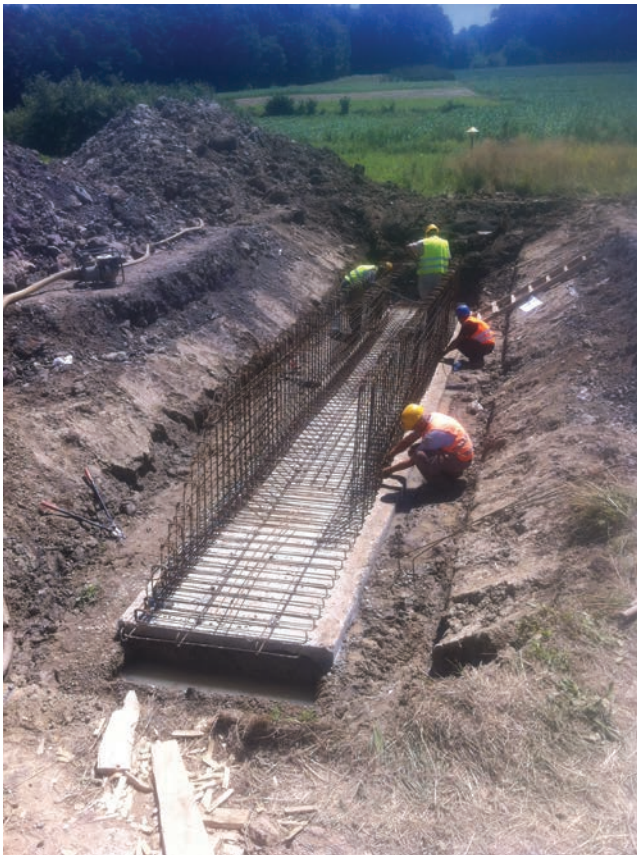
Prikaz radova na izgradnji propusta