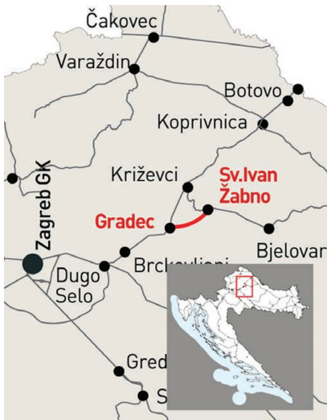
Položaj nove pruge na zemljovidu

U središnjici HŽ Infrastrukture 26. kolovoza 2015. potpisan je s tvrtkama Comsa i Wiebe ugovor o izgradnji te nove jednokolosiječne neelektrificirane željezničke pruge. Nova trasa dugačka je 12,2 km, a prema značaju koji će imati u međunarodnom i unutarnjem prijevozu, pruga će se svrstati u željezničke pruge od značaja za lokalni promet. U lipnju 2015. Ministarstvo pomorstva, prometa i infrastrukture i HŽ Infrastruktura potpisali su Ugovor o dodjeli bespovratnih sredstava čime je osi-