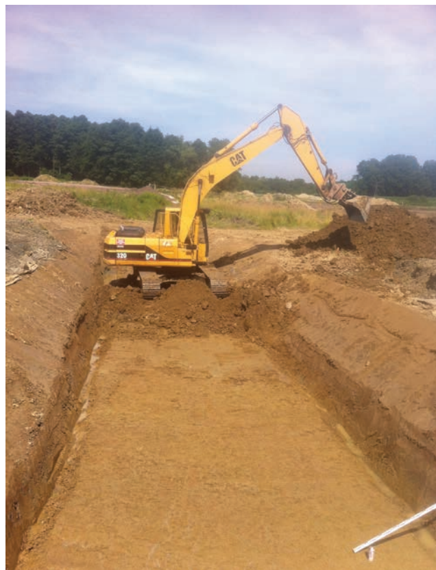
Zemljani radovi na pruzi