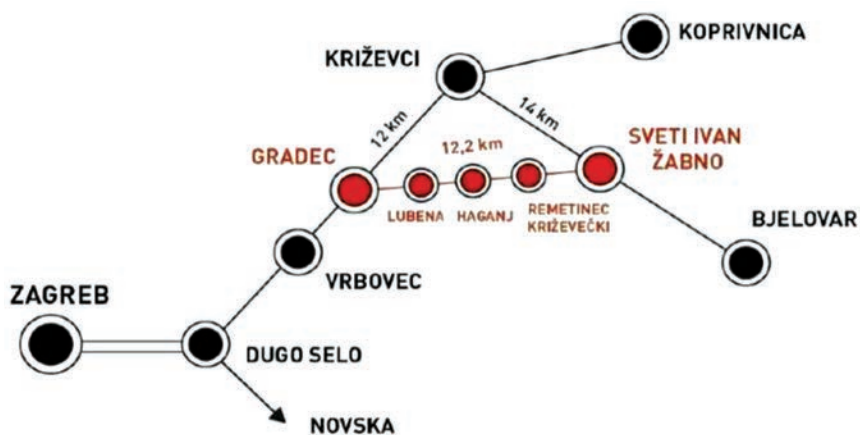
Shematski prikaz nove željezničke pruge

Zagrebom povezan željezničkom prugom duljine 89,2 km. Zbog dotrajalosti pruge maksimalna brzina vlakova između Bjelovara i Križevaca iznosila je tek 50 km/h. Dugoročni razvoj cjelokupnog sustava hrvatskoga željezničkog prometa usmjeren je u nekoliko osnovnih razvojnih smjerala, a jedan od njih odnosi se na izgradnju