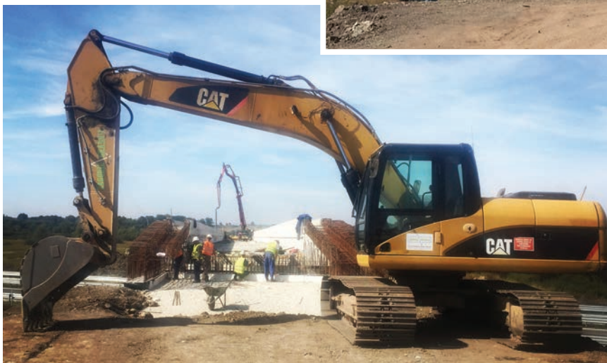
Detalj s gradilišta, izgradnja nadvožnjaka HŽ-HAC

kog projekta. Modernizacijom željezničke infrastrukture na željezničkoj relaciji Bjelovar – Zagreb može se očekivati znatniji porast opsega teretnog i putničkog željezničkog prijevoza.