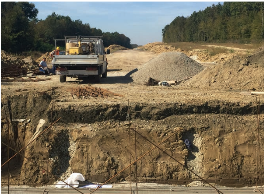
Prikaz tla poboljšano metodom izvedbe šljunčanih pilota