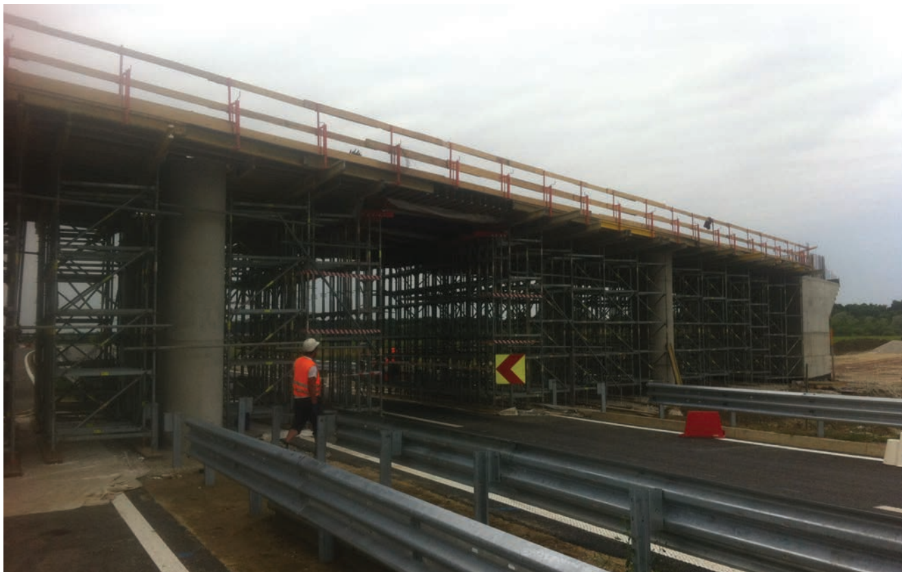
Detalj s gradilišta