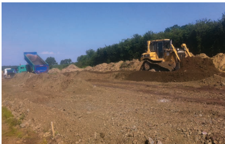
Radovi na izradi nasipa

Od voditelja projekta doznali smo to kako je krajem rujna 2016. realizacija izvođača iznosila 49 milijuna kuna (šest privremenih situacija), a nadzora 3,9 milijuna kuna (12 privremenih situacija). U 46 posto vremena potrošeno je približno 25 posto sredstava. Trenutačno se na gradilištu izvode ponajprije zemljani radovi (radovi manje vrijednosti) pa prolazno vrijeme, kako kaže Milas, pretjerano ne zabrinjava, a radovi se izvode po dinamičkome planu. U prvoj polovici 2017. predviđeni su radovi na pružnom gornjem ustroju, te prometno-upravljačkom i signalno sigurnosnom podsustavu u koje se ulaže 55% vrijednosti projekta.