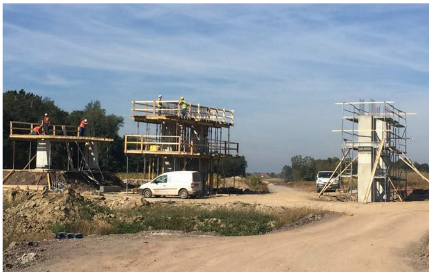
Detalj s gradilišta

Zanimljiv je podatak da je upravo pruga Gradec – Sveti Ivan Žabno prva nova pruga koja se u Hrvatskoj gradi nakon 50 godina. U konačnici, kada svi radovi budu dovršeni, Bjelovarčanima će prometovanje modernom željeznicom omogućiti skraćivanje putovanja do Zagreba sa sadašnjih 1,45 sati na približno 50 minuta. Kada se sve zbroji, nakon nekoliko desetljeća čekanja, do tog će se trenutka trebati strpjeti barem još godinu dana jer tada se očekuje završetak toga strateš-