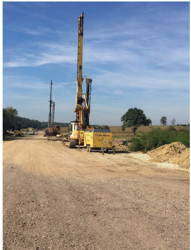
Strojevi za ugradnju šljunčanih pilota

dubine do sedam metara zbog prolaska pruge ispod ceste Lubena – Salajci te drugi usjek najveće dubine do devet metara zbog prolaska pruge ispod državne ceste D28 Zagreb – Bjelovar. Širina pružnog planuma iznosi sedam metara, s nesimetričnim dvostrešnim nagibom od pet posto, jer je prilikom projektiranja u obzir uzeta činjenica da će se pruga u budućnosti elektrificirati. Inženjer Zec rekao nam je to da se na trasi željezničke pruge grade armiranobetonski most Glogovica, tri cestovna podvožnjaka: Lubena, Paromlinska i Mali Gaj te dva cestovna nadvožnjaka: Remetinec i Škrinjari. Zbog odvajanja nove željezničke pruge od magistralne pruge Dugo Selo – Botovo – DG potrebno je izgraditi novi kolodvor Gradec. Za osiguranje kolodvora predviđena je izgradnja štitnoga kolosijeka duljine 50 m. U kolodvoru je predviđena gradnja perona širine 6,10 m i duljine 160 m. Prilaz putnika na peron bit će omogućen pješačkom rampom nagiba 1 : 12 s čela perona.