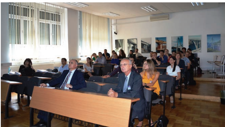
Dio sudionika simpozija o doktorskome studiju građevinarstva

Za prvi je simpozij doktorskog studija građevinarstva priređeno 19 predavanja