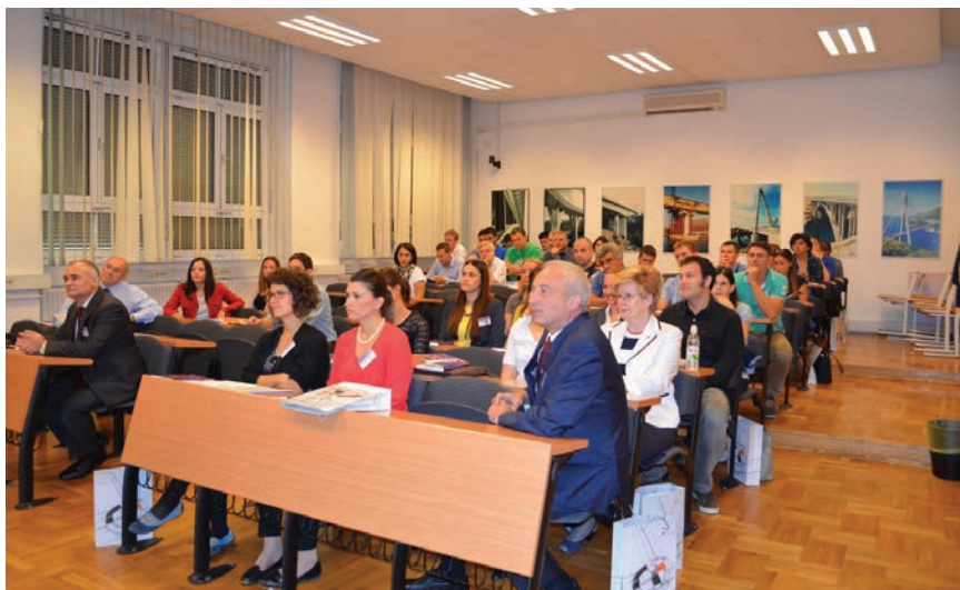
Sudionici pozorno prate izlaganja

u sedam sekcija te dva pozivna predavanja onih koji su svoje doktorske disertacije obranili u prošloj i ovoj godini.