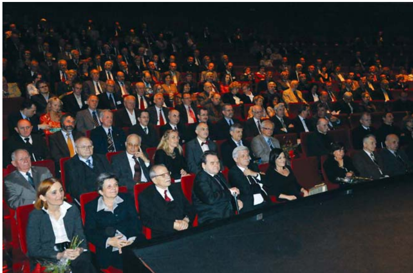
Čestitari u novoj krakovskoj operi

prigodnim govorom. Prije „govorancija“ nastupio je gudački kvartet, a između govora bili su najprije nastupi folklornoga sastava čiji su članovi studenti ili djeca nastavnika Politehnike (sastav djeluje već 34 godine), a zatim mješovitoga pjevačkoga zbora slična članstva, a vodi ga slavljenikova kći! A gledalište – puno čestitara! Pokušao sam procijeniti koliko ih je bilo: najmanje četiri stotine! Zašto sam rekao čestitara, a ne gle-