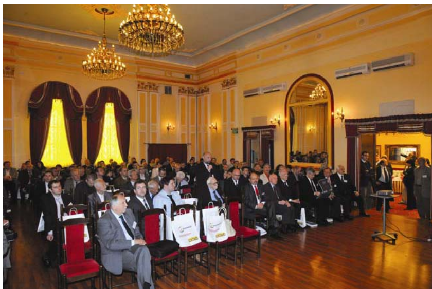
Znanstveno-stručni skup u hotelu Europejski

ture odavanja priznanja. To bismo i mi trebali (a i mogli) nasljedovati, naravno, primjereno zaslugama.