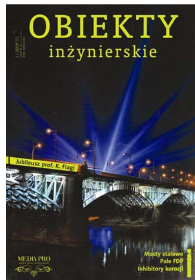
Poseban broj časopisa Objekty inżynierskie posvećen prof. Fragi

ture odavanja priznanja. To bismo i mi trebali (a i mogli) nasljedovati, naravno, primjereno zaslugama. Sam znanstveni-stručni skup bio je na razini boljih regionalnih skupova kakvi se danas priređuju diljem Europe. Meni je to bio treći poljski skup na kojem sudjelujem nakon demokratskih promjena i mogu samo reći: kapa dolje! Moram posebno istaknuti jedan dobar običaj: nakon svakog izlaganja (a trajala su približno dvanaest minuta) voditelji su sjednica tražili da se postavljaju pitanja i ona su nakon gotovo svakog izlaganja i postavljana. Inače, prikazao sam Kolni most preko Save u Zagrebu (tzv. Savski most), koji je također star sedamdeset godina, a znamenit je po tomu što je prvi veći spregnuti most na svijetu. Očekivao sam da ću iznenaditi slušateljstvo tim podatkom, ali je slavljenu, postavljajući mi pitanje, spomenuo da o tom mostu imakratak prikaz u skriptama njegova prethodnika na katedri.