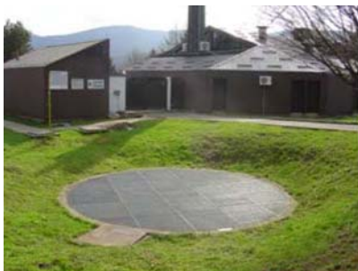
Mali pročišćivač ugrađen 1980.

Dr. Elmar Dorgeloh iz novootvorenog nezavisnog Savjetodavnog i informacijskog centra Abwasser dezentral (decentralizirane otpadne vode) na Institutu za ispitivanje i razvoj tehnike otpadnih voda u Aachenu ( www.abwasser-dezentral.de ) izračunao je da četiri milijuna ljudi u Njemačkoj i u budućnosti neće biti priključeno na javni sustav za pročišćavanje otpadnih voda. Njihove se otpadne vode trenutno pročišćavaju decentralizirano u oko dva milijuna malih pročišćivača, kapaciteta od četiri do 50 prosječnih opterećenja otpadne vode po stanovniku. Prema procjeni Dorgeloha više od pola ovih uređaja trebalo bi do 2015. zamijeniti novima ili ih barem sanirati u skladu s najnovijom tehnologijom.