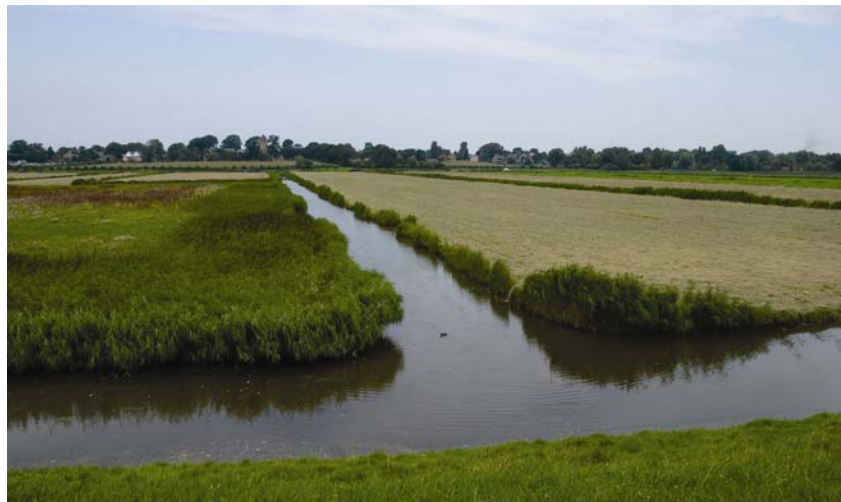
Izgled održavanoga poldera

ne preplavi. Izgradnjom poldera, primjerice, Nizozemska je dobila mnogo novog teritorija – proširila se na račun Sjevernog mora. Polder se upotrebljava kao i svako drugo zemljište – za poljoprivredu, gradnju naselja, prometnica. I amsterdamska se zračna luka nalazi u polderu.