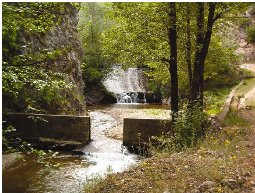
Brana na maloj rječici

no je uređeno pet područja koja prikupljaju vodu.