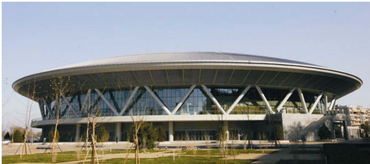
Pogled na Laoshan Velodome

tirali su je poznati njemački arhitekti iz tvrtke Schuermann Architects.