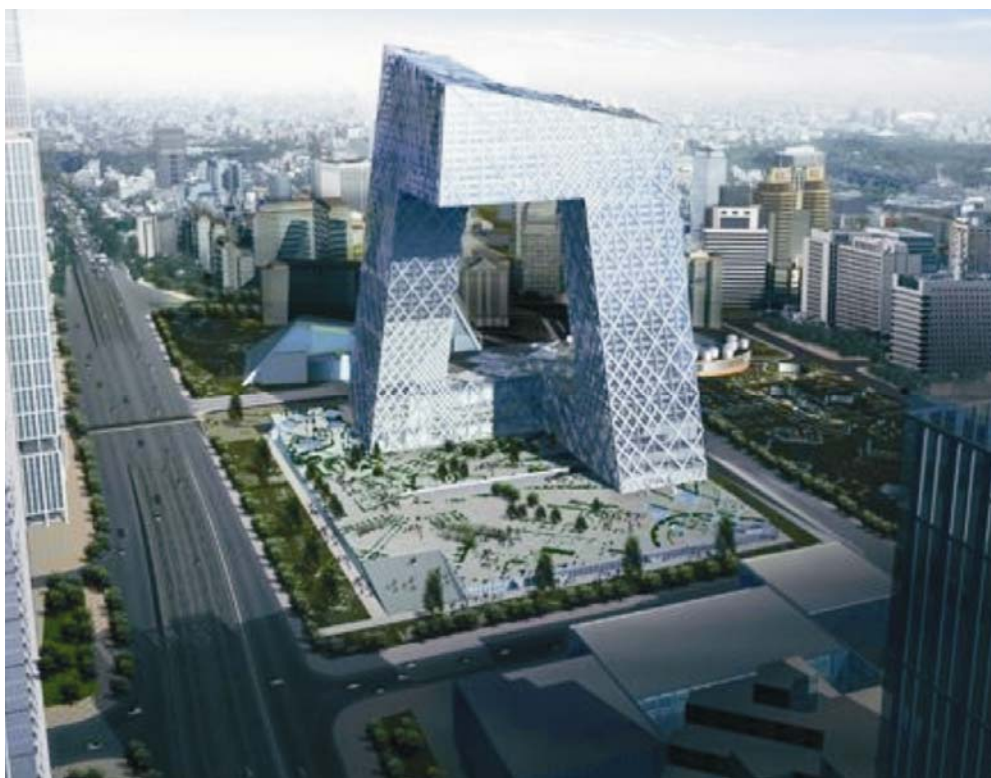
Zgrada kineske nacionalne televizije