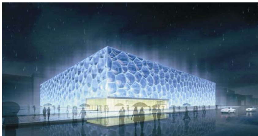
Vodena kocka – kompjutorski model

Nacionalno vodeno središte, poznatije kao Vodena kocka , dom je olimpijskoga bazena koji na tribinama može ugostiti 17 tisuća gledatelja. Vodena je kocka dugačka 177 metara, visoka 31 metar, a zauzima površinu od 65 tisuća četvornih metara. Poput ostalih građevina, sagrađena je posebno za Olimpijske igre.