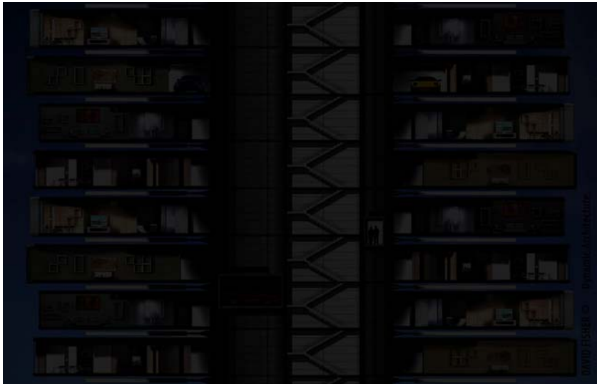
Dio presjeka tornja

Zgrada u Dubaiju trebala bi biti dovršena do 2010. Neboder će imati