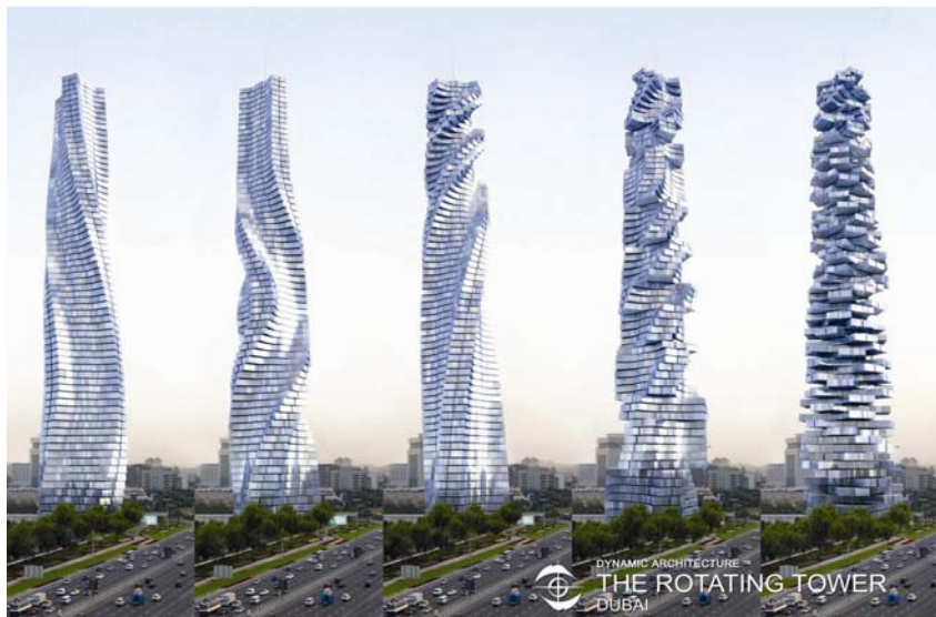
Prikaz promjenjivosti oblika rotirajućeg tornja u Dubajju

pothvati upućuju na to da visina nije jedino obilježje novih nebodera. U Dubajju se gradi dinamički tornaj