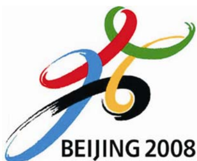
Simbol Pekinških olimpijskih igara

Odluka da se Olimpijske igre 2008. održe u Pekingu donesena je 13. srpnja 2001. Uz Peking kandidati su bili Toronto, Pariz, Istanbul i Osaka. Glavni grad Kine, poznat po veličanstvenoj arhitekturi, palačama i hramovima starim stoljećima, dobio je nov izgled koji graniči s znanstvenom fantastikom.