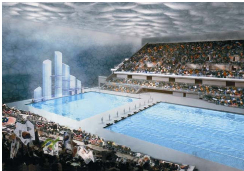
Unutrašnjost nacionalnoga središta za sportove na vodi

kog odbora i može se piti. Svaki od tri bazena u Vodenoj kocki ima svoju opremu i uređaje za filtriranje i čišćenje, radi održavanja standarda za čistoću vode. Materijal propušta dnevno svjetlo u zgradu i omogućuje solarno zagrijavanje vode. Trajat će godinama, po procjenama najmanje tridesetak. Nakon toga vodene će kocke biti zamijenjene. Postoji i sustav samočišćenja, a vanjsko je pročelje otporno na prašinu i nema potrebe za vanjskim ručnim pranjem.