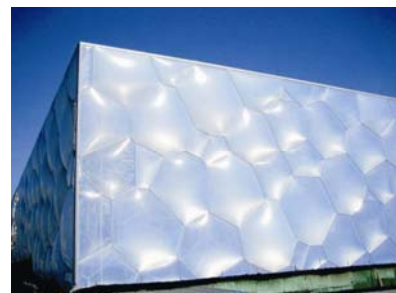
Dio pročelja s napuhanim jastucima

vati kako se zrak širi, a ako je hladno, zrak se upumpava i građevina se ponaša kao da je živa.