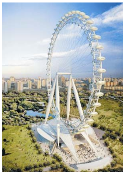
Budući najviši kotač na svijetu

Kineski će zid dobiti konkurenciju. Peking je otkrio ambiciozni plan izgradnje najvećeg i najvišeg kotača na svijetu.