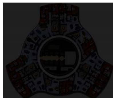
Tlocrt jednog kata rotirajućeg tornja

Neboderi, smatraju investitori, trebaju pridonijeti, u okviru širih građevinskih projekata, jačanju turističke infrastrukture i gradova. Najnoviji