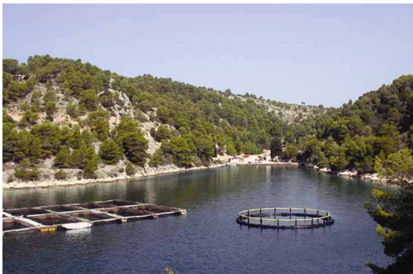
Uzgoj tune u Maloj Lamljani na Ugljanu

darskog Odsjeka za marikulturu u Upravi ribarstva Ministarstva poljoprivrede, šumarstva i vodnog gospodarstva. Hrvatska je inače redovita članica međunarodne organizacije za zaštitu atlantskih tuna ICCAT ( International Commission for the Conservation of Atlantic Tunas ).