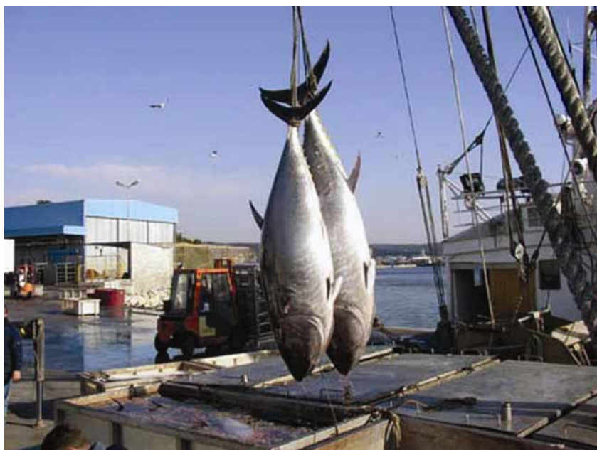
Smrznute tune spremne za transport u Japan

Za daljnji je razvoj te djelatnosti potrebno izmijeniti pristup dodjeljivanja koncesija za dijelove pomorskog