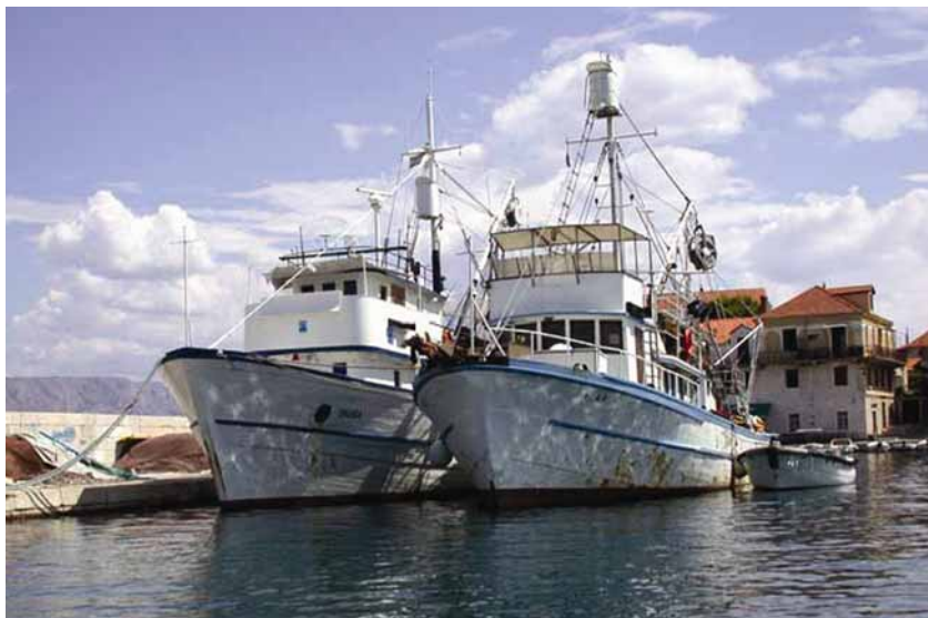
Brodovi koji dovoze hranu za tunogajališta

Tonči Božanić, predsjednik hrvatskoga ribarskog ceha, u čestim obraćanjima javnosti upozorava da se