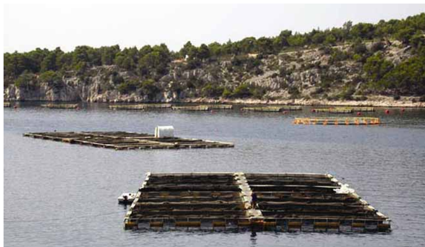
Kavezi za marikulturu i uzgoj tuna

No čini se da su takva katastrofična upozorenja pretjerana. Barem tako misli dr. sc. Vjeko Tičina, koji u Institutu za oceanografiju i ribarstvo prati uzgoj tuna, i koji ujedno tvrdi da su mnogo veća opasnost za živi svijet u moru balastne vode koje ispuštaju brodovi. U znanstvenoj literaturi nije opisano nikakvo masovno poboljšavanje tuna, ni posebna ugroženost nekom bolešću. Većina se stručnjaka slaže da bi izlov tuna ipak trebalo smanjiti radi očuvanja ili povećavanja njihove prirodne populacije. Prema procjenama u vremenu od 1970. do 2000. njihova se ukup-