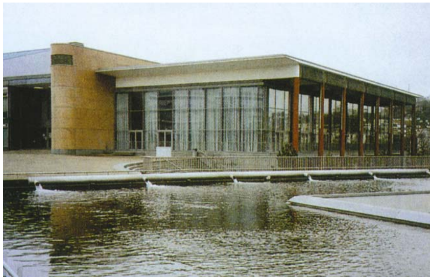
Na oko 5.000 m 2 površine bazena s 30 cm vode stalno teče velika količina vode

Pri planiranju sanacije trebalo je poštivati i lokalnu povećanu vlagu starih slojeva. Zaštitni sloj od lijevanog