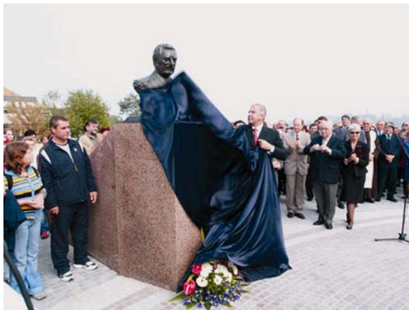
Svečano otvorenje novoga trga i otkrivanje biste dr. Franje Tuđmana

U razgovoru s ing. Nediljkom Bešlićem saznali smo da je to samo prva faza uređivanja trga i da će se u drugoj fazi, za koju se ne zna kada će započeti, urediti i dio trga na sjeveroistoku ispred hotela Dunav . Tako je uostalom predviđeno i projektom idejnog rješenja uređivanja Trga Republike Hrvatske koji je 2000. kao poklon izradio ondašnji Gradski zavod za planiranje razvoja grada i zaštitu okoliša grada Zagreba u suradnji sa Zavodom za prostorno pla-