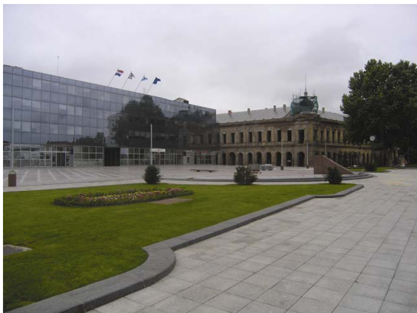
Uređeni dio trga ispred Gradskog poglavarstva

gradskog područja Vukovara koji je izradio Zavod za urbanizam Arhitektonskog fakulteta u Zagrebu (1996.) i geodetskoj snimci postojećeg stanja koji je izradila tvrtka Pro-Heni d.o.o. iz Zagreba (1999.).