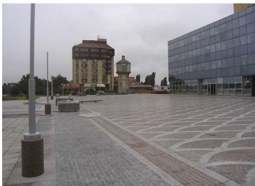
Trg sa starim vodotornjem u pozadini

jedan dio bio potopljen i popločan starom kaldrmom, a prilazilo bi joj