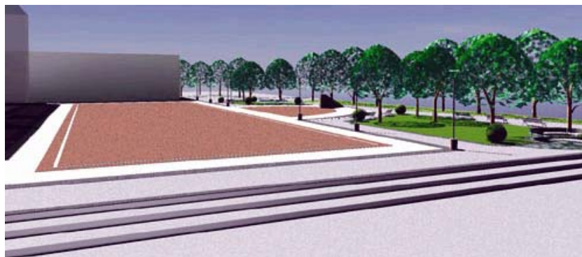
Izgled trga u projektnoj dokumentaciji

Sada je zapravo uređen jugozapadni dio trga, dio koji je i prije Domovinskog rata bio opremljen i dograđivan i na kojem je bio smješten spomenik žrtvama fašizma. Riječ je o trgu ome-