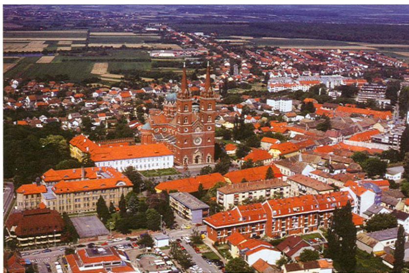
Pogled na Đakovo iz zraka

nih 16 godina, od toga 4 godine za vanjske radove, a 12 godina za unutrašnje uređenje. Utrošeno je 7 milijuna komada najbolje opeke (pečene u Đakovu), a ispod sjevernog zida i tornja, tlo je ojačano sa 394 pobodena hrastova pilota. Kamen se dopremao iz Istre, Mađarske, Austrije, Italije i Francuske. Projektanti su bili bečki arhitekti Karlo Rösner i Fridrich Schmidt. Unutrašnje je uređenje povjereno njemačkim slikarima koji su živjeli u Rimu, ocu i sinu