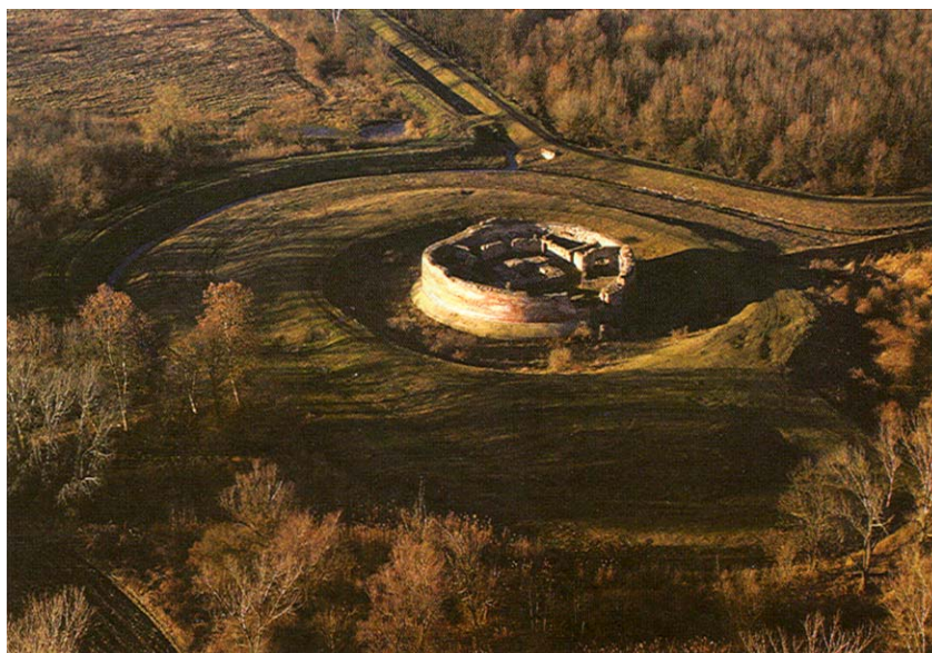
Pogled iz zraka na utvrdu Korođ i njezin okoliš