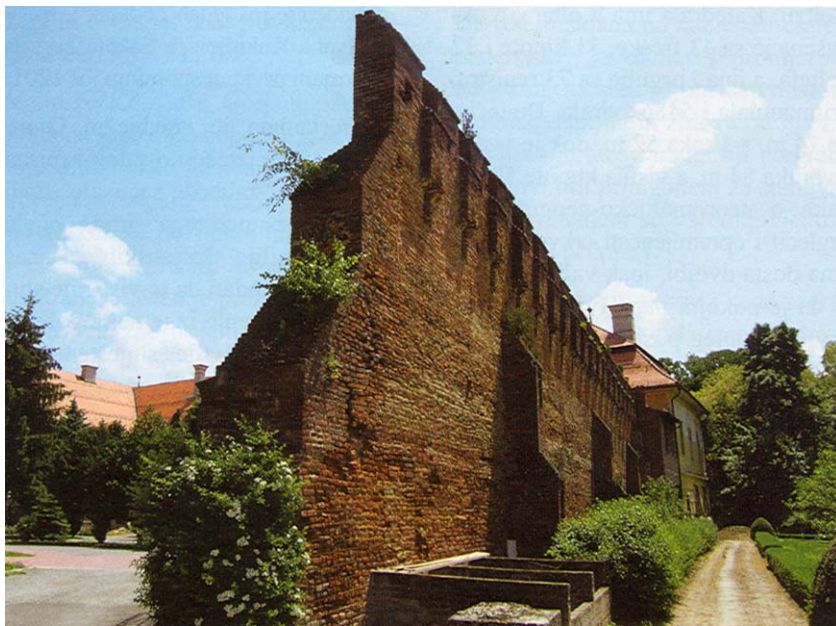
Ostaci obrambenog zida iza katedrale i biskupskog dvora