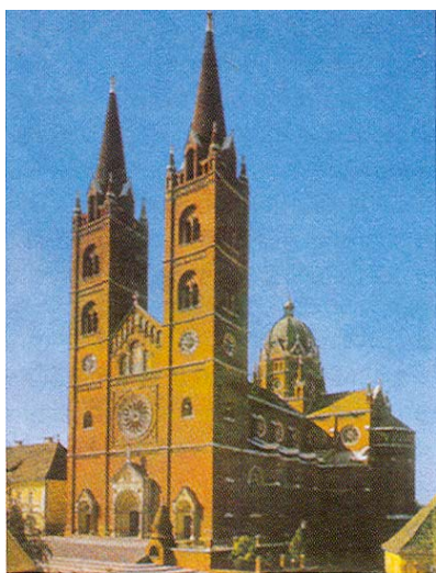
Katedrala u Đakovu

i proširio katedralu, izgradio novi biskupski dvor, novi franjevački samostan, kanoničke kurije i 1751. osnovao prvu pučku školu. Svakako valja spomenuti da je biskup Antun Mandić krajem 18. st. otvorio i bogoslovno sjemenište, najstariju visokoškolsku ustanovu na području Slavonije i Baranje.