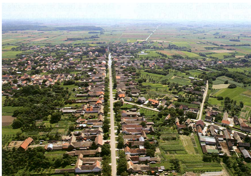
Pogled iz zraka na Gorjane (kapelica Sv. Tri kralja je na glavnom raskršću

Druga se bitka zbila 1537. kada je Ivan Katzianer poveo svoje čete protiv Turaka u taj dio Slavonije. On je neposredno prije bitke pobjegao, a