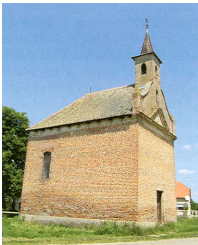
Crkva Sv. Tri kralja u negdašnjoj kuli Jaić-bega

njegovu su vojsku kod Gorjana Turci potpuno uništili. Bio je uhapšen, ali je nakon bijega pokušao pridobiti hrvatske plemiće za savez s Turcima. Potom ga je Zrinski dao smaknuti.