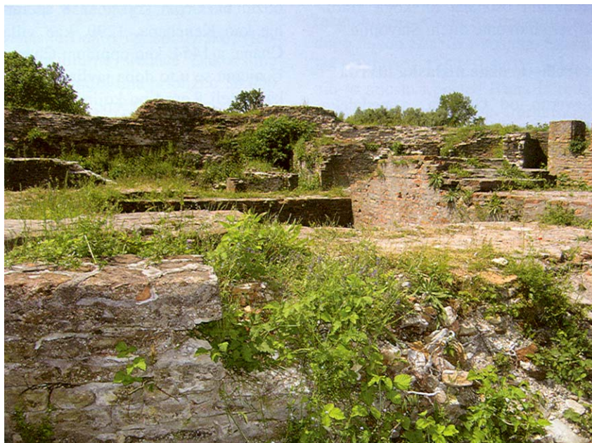
Unutrašnjost utvrde Korod