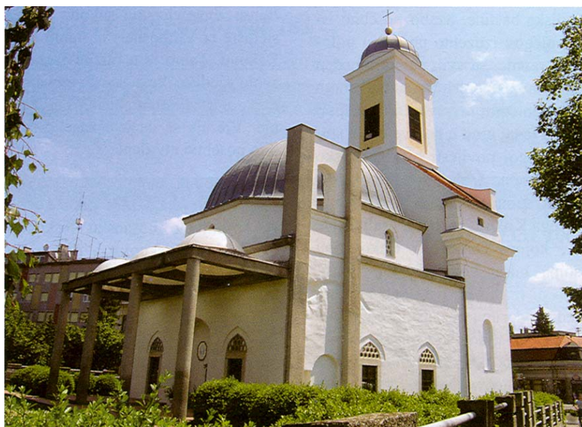
Župna crkva Svih Svetih u Đakovu

Kako je car Leopold I. potvrdio bosanskim biskupima pravo na Đakovo i okolicu, đakovački se biskupi vraćaju i podižu novo Đakovo. Jednu su džamiju preuredili u crkvu i pokraj nje izgradili franjevački samo-