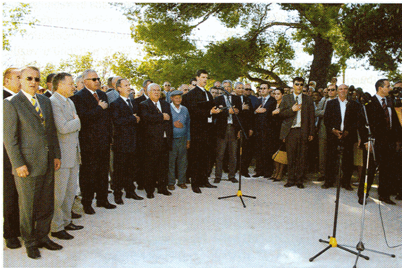
Sudionici otvaranja radova kanalizacije Kaštela – Trogir u mjestu Žedno na Čiovu

Hidrotehnički tunel Čiovo ima ulazni-sjeverni portal na oko 200 metara južno od samostana Sv. Križ. Tunel se pruža u pravcu sjever-jug i dug je 2771 m. Izlazi na južnoj strani otoka Čiova u uvali Orlice. Ima ulogu provođenja otpadnih voda kanalizacijskog sustava Kaštela-Trogir kroz otok Čiovo do podmorskog ispusta u uvali Orlice. Od uređaja za pročišćavanje u Divuljama otpadne vode će se transportirati s dva podmorska tlačna cjevovoda. Izgradnja hidrotehničkog tunela Čiovo obuhvaća sve objekte i opremu potrebnu za ispravno funkcioniranje građevine i kompletan kanalizacijski sustav Kaštela-Trogir. Pristupna cesta do pri-