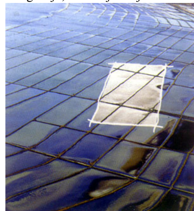
Vizualizacija mora i solane

Nenad Fabijanić je slobodni umjetnik koji se u početku svoje profesionalne fotografske karijere bio specijalizirao za arhitektonsku i pejzažnu fotografiju, a sada je uključen u sve