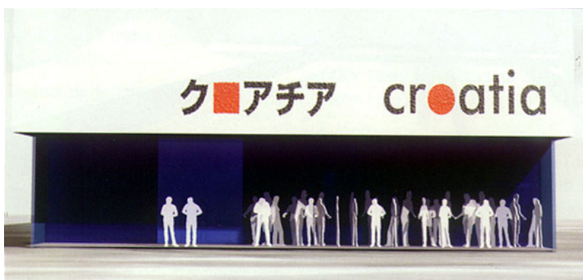
Prikaz ulaza u hrvatsku izložbu