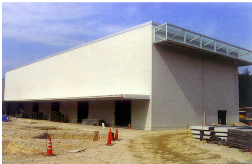
Paviljon u izgradnji u kojemu će biti smještena hrvatska izložba

Aichi je inače jedna od ukupno 47 japanskih provincija, a smještena je u središnjem Japanu i dvjestotinjak je kilometara udaljena od glavnoga grada Tokija. Expo 2005 smješten je nedaleko od provincijskog središta Nagoye i podijeljen je na šest globalnih cjelina uokolo središnjih paviljona u kojima se predstavljaju Japan i pokrajina Aichi. U tim su globalnim cjelinama, radi lakšeg snalaženja posjetitelja, smještene kontinentalne cjeline poput Azije, obje Amerike, Europe, kojoj su namijenjena dva paviljona, Afrike te jugoistočne Azije s Oceanijom i Australijom. Svoje je sudjelovanje potvrdilo više od 120 zemalja. Očekuje se približno 15 milijuna posjetitelja, što možda i nije pretjerano jer je već dosad prodano više od 7 milijuna ulaznica. Cijeli je prostor pažljivo planiran kako bi nakon izložbe postao mjes-