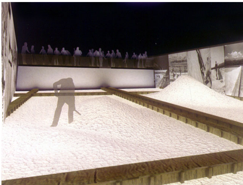
Prikaz rada u solani za posjetitelje izložbe