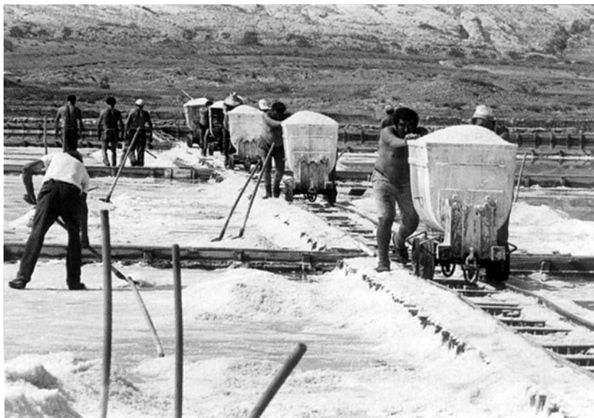
Paška solana na slici Nenada Fabijanića

Potom će posjetitelji u određenom vremenskom intervalu ulaziti u prostor glavne dvorane i nastavljati "putovati" kroz more. Put će im biti osvjetljen na podu, a u plavkastoj polutami na oba bočna zida bit će projicirani dijapozitivi s motivima paške solane. Projekcije će kontrolirati