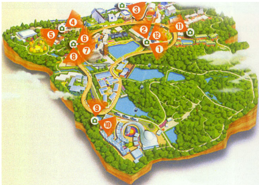
Smještaj pojedinih cjelina na EXPO 2005. Hrvatska je na cjelini 3

Umjetničkog paviljona na Tomislavovu trgu, jedan od simbola hrvatskoga glavnog grada.