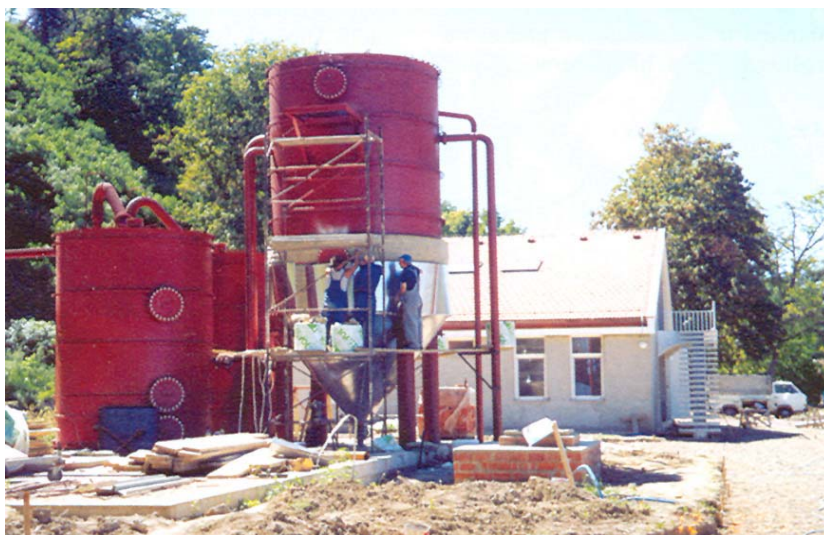
Završni radovi na montaži aeratora-flokulatora