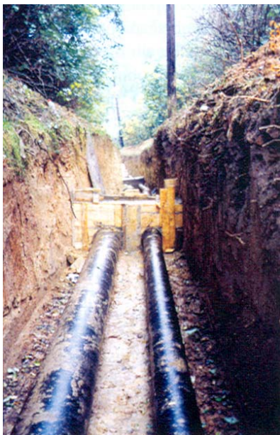
Polaganje tlačnog cjevovoda

vršen proces sanacije crpilišta i da količine vjerojatno premašuju sadašnje potrebe. No mogućnosti su novih zdenaca ograničene stiješnjenošću crpilišta u naselju te se, ako bude potrebno, preporučuje daljnji razvoj crpilišta sjevernije na inundacijskom području Dunava. Inače kakvoća je vode takva da se za vodoopskrbu može rabiti bez ikakve prerade. To međutim nije slučaj s crpilištem Bapska koje je zbog velikog povećanja nitrata (povremeno su dostizali i do 50 mg/l, a maksimalna je dozvoljena količina 10 mg/l) isključeno iz vodoopskrbe, a stanovništvo se opskrbljuje iz Iloka.