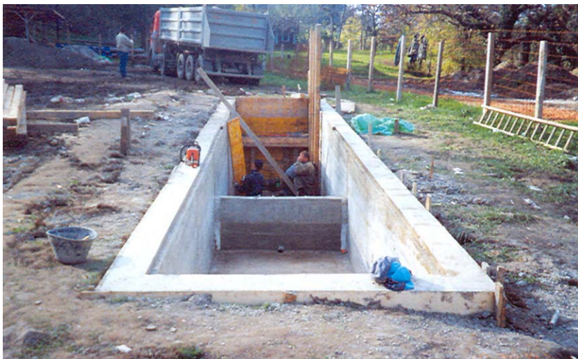
Početak gradnje novog uređaja za preradu vode – gradnja crpnog bazena

dacije ispod prapornog ravnjaka. No ni to nije bilo najsretnije rješenje jer je voda iz izvora bila često zagađena procjeđivanjem otpadnih voda iz gradske kanalizacije.