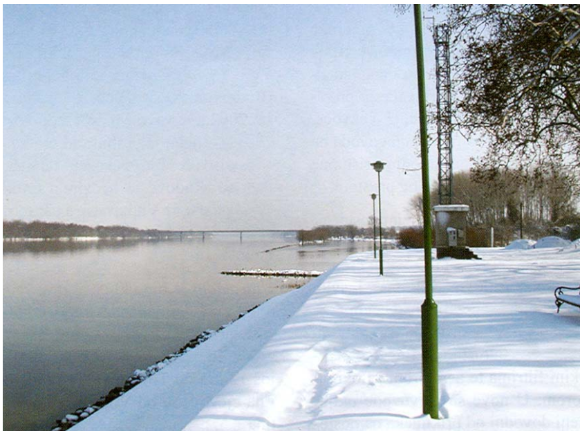
Pogled na obalu Dunava i most preko Dunava