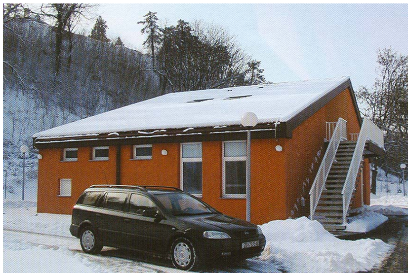
Zgrada uređaja tijekom posjeta

Posjetili smo dakako i novu precrpnu stanicu s uređajem za preradu u predjelu zvanom Skela, gdje je nekad bio važan riječni prijelaz. Za našeg posjeta bilo je zaista obilje snijega pa su se nova zgrada i prostor oko njega doimali nekako uređenije i svečanije. Primijetili smo da unatoč hladnoći jedan refuler stalno čisti i produbljuje Dunavac, koji u buduć