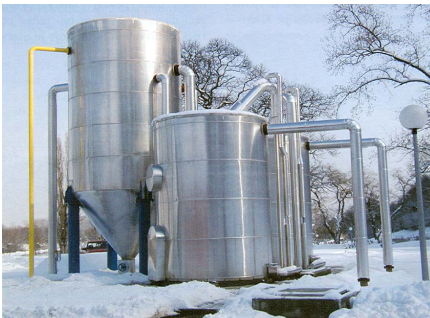
Blok uređaja za pročišćavanje u probnom radu