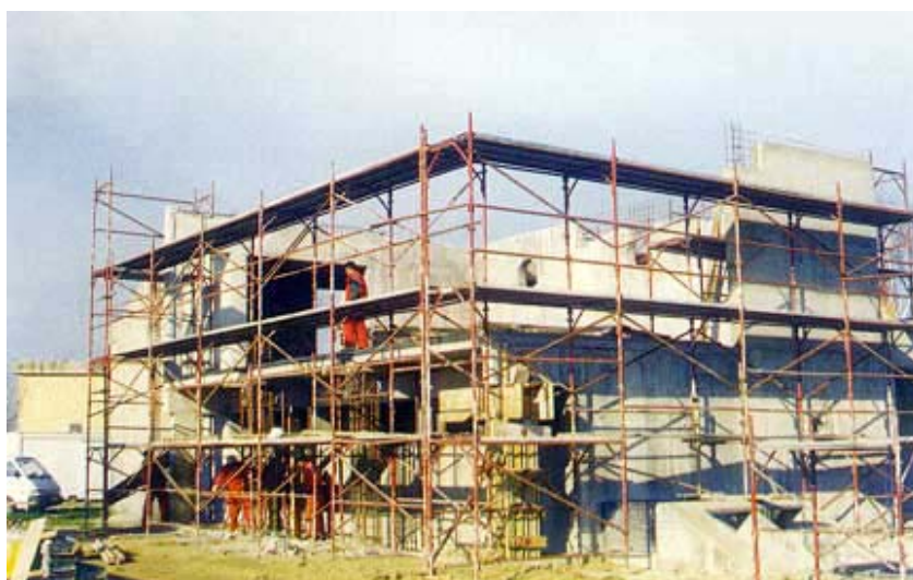
Obnova zgrade komande

Zadržano je postojeće prostorno i arhitektonsko rješenje, a zadržane su i sve zgrade bez obzira na stupanj oštećenja konstrukcije, a rasklopna su polja popunjena s dvije nove relejne kućice. Najviše je problema u obnovi zgrada bilo s najvećom, zgradom komande koja je bila najoštećenija. U toj će zgradi biti smještena oprema i telekomunikacijski sustavi s neprekidnim napajanjem. Valja još dodati da je predviđeno upravljanje i nadziranje rada trafostanice Ernestinovo u više razina: na razini rasklopnog polja, na razini objekta, daljinsko nadziranje i upravljanje iz Centra daljinskog upravljanja u Osijeku i nadzor i upravljanje iz središnjeg dispečerskog centra u Zagrebu. Inače je predviđeno da trafostanica bude bez stalne posade te da se u normalnom pogonu njome upravlja iz Osijeka i Zagreba, a upravljanje i nadzor u samoj stanici predviđeno je kao rezervno.