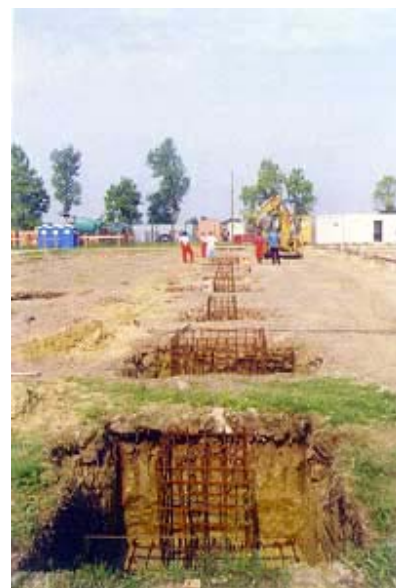
Obnova temelja čeličnih stupova