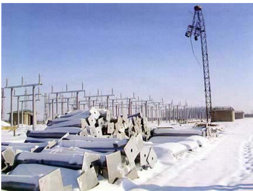
Pogled na rasklopno postrojenje od 110 kV

zbog izuzetne hladnoće, možda i najnižih temperatura zabilježenih ove zime u Osijeku. Tamo smo ipak zatekli Dinka Zorića, dipl. ing. el., voditelja projekta i glavnoga nadzornog inženjera. On nam je rekao da su za 110 kV i 400 kV rasklopno postrojenje izgrađeni su temelji postolja aparata. Dio je postolja napravljen, a dio još treba napraviti. Konstruktivna sanacija zgrada je u tijeku.