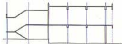
Skica presjeka zgrade komande

troprivreda d.d. – Direkcija za prijenos iz Zagreba. Radovi su započeli 18. travnja 2002., a trebaju biti završeni u studenom 2003. Valja reći da je u ovom velikom poslu izuzetno