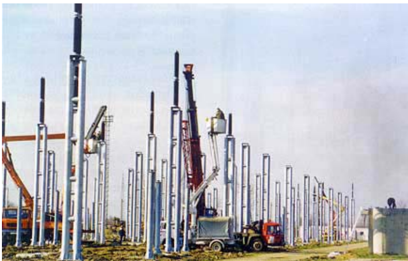
Obnova rasklopnog postrojenja 400 kV

kiralište. Zapravo pred glavnim ulazom u postrojenje predviđeno je uređenje otvorenog prostora s javnim parkiralištem i spomen-obilježjem na ratne strahote. Vanjsko otvoreno skladište nastavlja se na vanjsko parkiralište i bit će ograđeno posebnom ogradom.