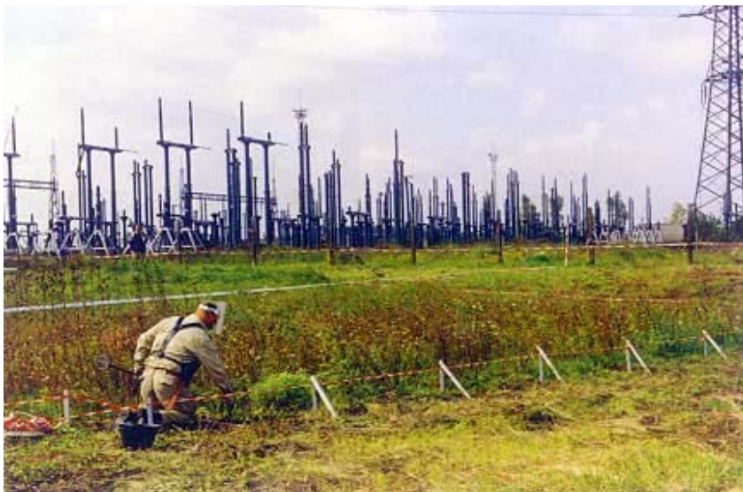
Razminiranje područja trafostanice Ernestonovo u 1998. godini

Obnova trafostanice Ernestinovo, zajedno s obnovom i izgradnjom 400, 220 i 110 kV dalekovoda na ovom i na drugom području, te izgradnjom trafostanice Žerjavinac blizu Zagreba, jedno je od najvećih ulaganja danas u Hrvatskoj. Investitor Hrvatska elektroprivreda (HEP) novac je osigurao zajmom Hrvatske banke za obnovu i razvoj. Iz tiska, koji je o tome pisao prije početka radova, saznali smo da su za financiranje gradnje bile zainteresirane i strane banke, posebno Europska banka za obnovu i razvoj i Europska investicijska banka, iako taj podatak nismo mogli nigdje provjeriti. No njihov je uvjet bio da u međunarodnom natječaju moraju sudjelovati samo tvrtke koje su u posljednjih nekoliko godina gradile slična pos-