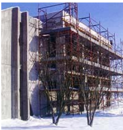
Obnova zgrade komande u zimskim uvjetima

zapadnom i sjevernom te južnom Europom, posebno s Grčkom. Ernestinovo će vjerojatno omogućiti i Srbiji da izvozi svoje viškove energije. Ujedno će Hrvatskoj elektroprivredi omogućiti da počne dobivati struju iz termoelektrane Obrenovac u koju je prije rata uložila gotovo 500 milijuna eura. Konačno, iako to ing. Cavor nije rekao, preko ove će se velike trafostanice, kao i one u Žerjavincu, moći pokušati opskrbljivati veliki korisnici jeftinijom strujom iz inozemstva, što zakon dopušta, ali još nitko nije iskoristio.