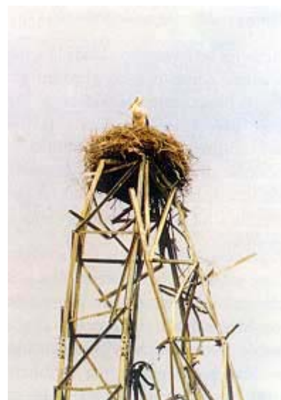
Roda u gnijezdu na oštećenom stupu