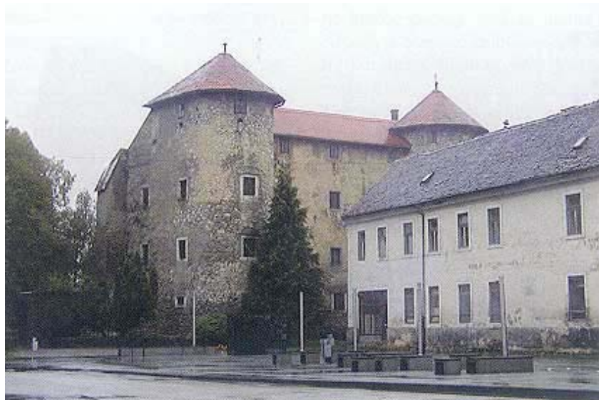
Sadašnji izgled utvrde

utvrdu zaposjela posada od 30 pješaka, a 50 je konjanika razdijeljeno na gradove Otočac, Brinje i Ogulin. Time je utvrda Ogulin dospjela u kraljeve ruke, a Frankopani su držali