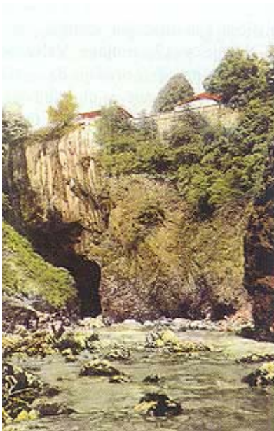
Đulin ponor na staroj razglednici

Pretpostavlja se da je ogulinski kraj bio naseljen od davnina. O tome posredno svjedoče okolni toponimi koji čuvaju uspomene na davne gradine. Ipak ovaj grad, smješten u samom središtu neobične hrvatske potkove i na pola puta između Zagreba i Rijeke, ima gotovo precizan datum nastanka. Za godinu se njegova nastanka uzima 1500. kada je Bernardin Frankopan, nakon rušenja Modruša 1493., završio izgradnju utvrde iznad strmog i nepristupač-