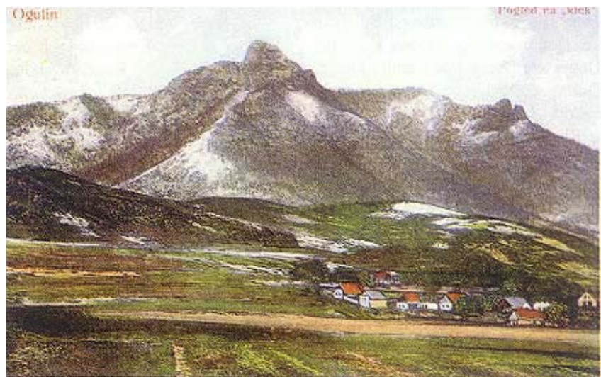
Klek na staroj razglednici

vrde odredio i međe novoga grada između Modruša i Vitunja. Vjerojatno ime Ogulina potječe od latinskog naziva "ob gula", što bi značilo oko ili iznad ponora ili ždrijela. Ako je to točno, ta bi izvedenica bila i korijen imena ponora Dobre koji se nalazi upravo ispod utvrde. On se naziva Đulin ponor, a ime je po predaji dobio zato što se u njega sunovratila djevojka po imenu Julija (Jula, Đula ili Zulejka), kći jednog od Frankopana, zbog nesretne ljubavi prema siromašnom vojniku. Po analogiji se i ogulinska utvrda naziva Đulin-grad, Julin-grad ili Zulumgrad, ali to su