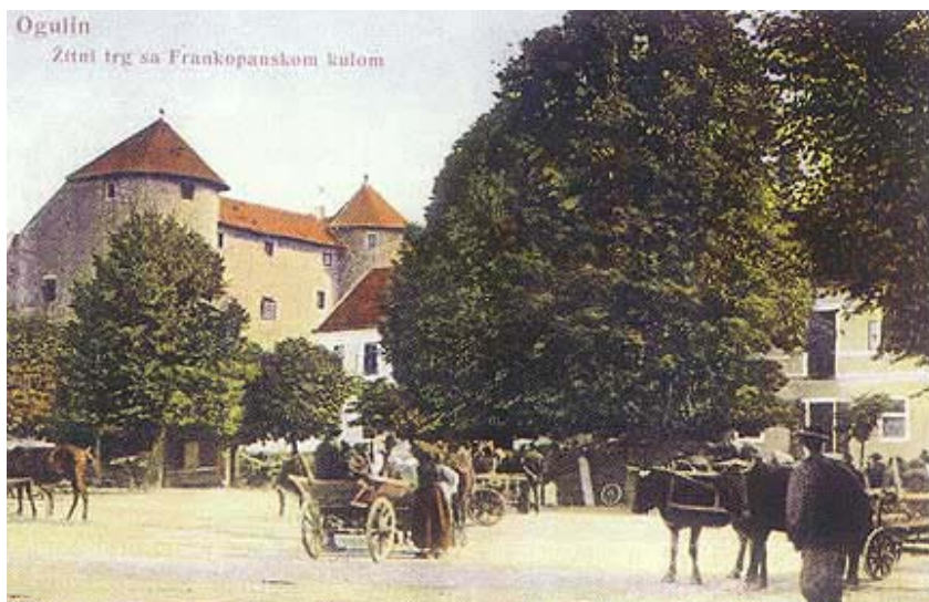
Središte Ogulina na staroj razglednici

reb-Split, te da je u Ogulinu sjedište hrvatske podružnice tvrtke Bechtel , ovaj se grad svrstao među jedinice lokalne samouprave s najvećim poreznim prihodima, a mnogi su Ogulinci zaposleni u raznim poslovima i službama vezanim uz građenje. Narasli su prihodi odmah iskorišteni za izgradnju suvremene kanalizacije i rekonstrukciju vodoopskrbe. Zahvaljujući pomalo iznenađujućem gospodarskom prosperitetu, a i pod utjecajem nedavnog rata, broj se žitelja značajno povećao, pa grad danas ima više od 17.000 stanovnika.