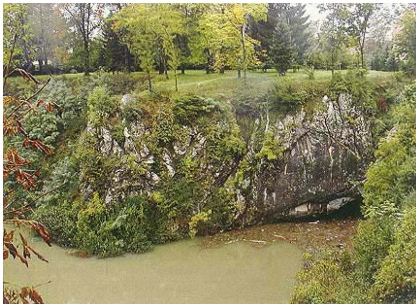
Đulin ponor za nedavnih kiša

Ogulin sredinom 18. stoljeća ima 2500 stanovnika i potpuno napušta stari i utverdama opasani Ogulin te se počinje razvijati u ravnici što se pruža pred starim frankopanskim gradom. Sačuvao se jedan dio gradskog zida i stari kaštel, ponajviše, kao što je već rečeno, zahvaljujući činjenici da je služio kao zatvor pa ga se moralo stalno popravljati i obnavljati. Sadašnji Ogulin zapravo potječe iz tog vremena i već je na prvi pogled