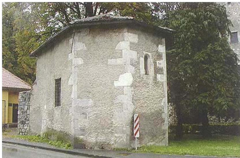
Kapelica u sastavu Ogulinske utvrde

Sve se završilo nakon gotovo godinu i pol tako da su dvojica kolovođa