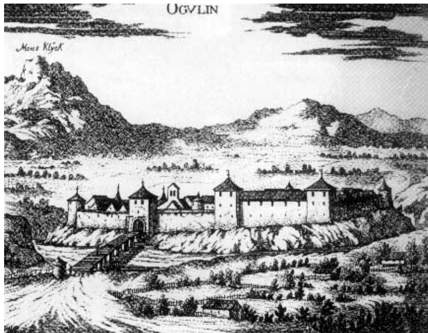
Ogulin na crtežu J. W. Valvasora

Ogulin je grad u graničnom dijelu Gorskog kotara i Like, smješten u prostranoj kotlini nad kojom se sa zapada nadvio Klek, planina (greben) sjeveroistočnog dijela planinskog masiva Velike Kapele. Najviši su vrhovi Veliki Klek (1181 m) i Klečica (1062 m). Klek je gora zastrašujućeg oblika i čudesne ljepote. Poznat je mnogim hrvatskim planinarima jer je kolijevka gotovo 130 godina starog hrvatskog planinarstva i alpinizma. Klek obiluje botaničkim endemima i reliktima (runolist, kitajbelov jaglac, gorski ljiljan...) te zaštićenim životinjskim vrstama među kojima su medvjed, vuk i ris te tetrijeb gluhan. Zbog svega toga Klek je zaštićen kao značajan krajolik. Inače, još je u 17. stoljeću Valvasor zabilježio narodnu predaju da se na vrhu Kleka, u ponoć za olujnih noći, skupljaju vile i vještice koje u Ogulin hrle iz dalekih krajeva. Klek je vizualni zaštitni znak Ogulina i s nedalekom Bjelolasicom (sa skijaškim centrom) te Bijelim i Samarskim stijenama (koje su kao strogi prirodni rezervat pod najvećim stupnjem zaštite), zajedno s obližnjim jezerima Sabljaci i Bukovik, temelj turistič-