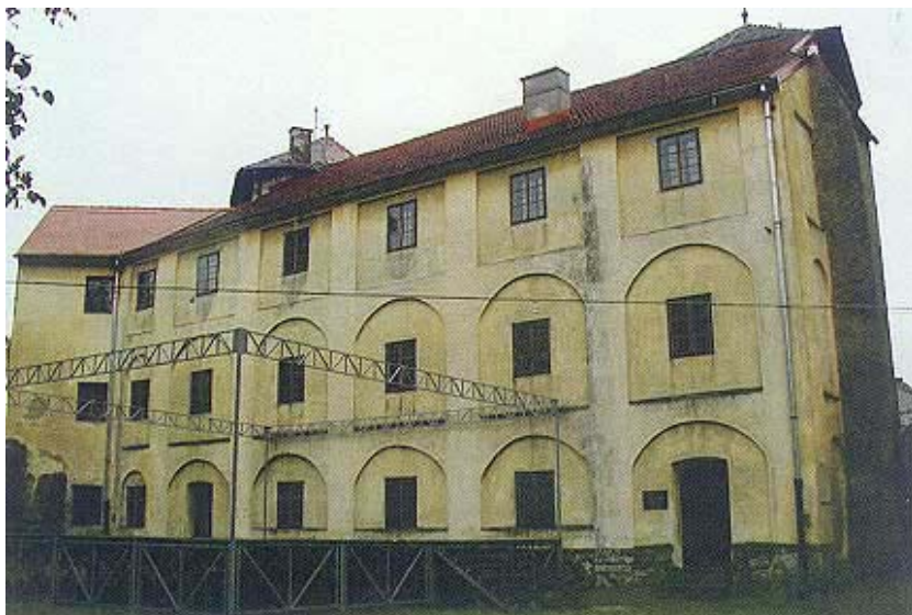
Ogulinska utvrda s dvorišne strane

novati, sijati i držati svoju stoku, a Ogulincima koji su se tim zemljištem dotad koristili zabranio pristup uz prijatnju velike globe. Spor se dugo razvlačio, a izbila je i prava buna o kojoj je bio izviješten i kralj.