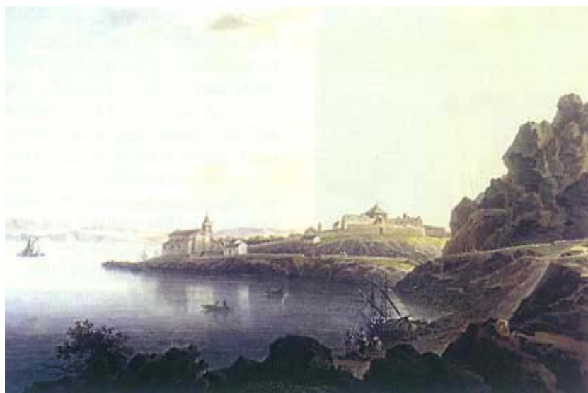
Pogled na crkvu i tvrđavu (akvarel – 19. stoljeće)

Grad je dugo ostao u ruševinama, iako je obnova predlagana u više navrata, posebno pošto su se Turci 1641. zauzimanjem dijela priobalja približili Karlobagu. To su predlagali i poznati glavni carski inženjeri Giovanni Pieroni 1639. i Martin Stier 1660. Stier je priložio crtež (prema predlošku iz 1652.) i tlocrt Karlobaga s prijedlogom obnove cijeloga grada s bastionima, što ipak nije napravljeno. Njegovi su crteži glavni izvor poznavanja ondašnje tvrđave i Karlobaga. Tada su na uglovima bile manje kule, a velika okrugla stajala je u sredini. Grad u ruševinama ima ipak i danas prepoznatljiv raster ulica grada koji su utemeljili knezovi krbavski. Inače su izvještaji, slike i crteži vojnog inženjera i kapetana Martina Stiera glavni izvor podataka o našim utvrđama, a nama su u cjelovitom obliku stigli tek 1997. u monografiji Izvještaji o utvrđivanju granica Hrvatskog kraljevstva od 16. do 18. stoljeća dr. Ljudevita Krmpotića (podrijetlom Karlobažanina i glavnog vlasnika karlobaške tvrđave).