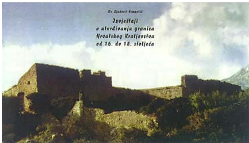
Naslovna strana knjige o utvrđivanju granica sa slikom karlovačke tvrđave