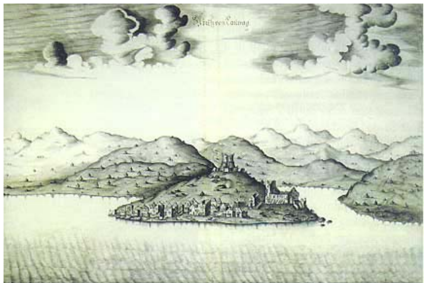
Crtež Karlobaga inženjera Martina Stiera iz 1660.

Bag je nakon prvoga temeljitoga turskog razaranja bio napušten gotovo punih 50 godina. Obnova je započela 1574. godine, a bila je potaknuta činjenicom što su se u baškim ruševinama skrivali nepokorni uskoci i venturini (izbjeglice od venecijanske vlasti) koji su po okrutnostima bili jednaki zloglasnim turskim martolozima. To je ometalo stabilnu plovidbu Velebitskim kanalom te onemogućavalo i Veneciju i ostatke Hrvatskog Kraljevstva (u sastavu Austrije) u borbi protiv Turaka. Popravljen je tvrđavica u koju je smještena manja vojna posada, a počelo je i doseljavanje stanovništva. Obnova je bila dugotrajna. Nakon osnivanja Vojne granice (Militärgrenze) 1578., iz jednog izvješća upućenog vojnoj komandi saznaje se da je i Bag uključen u crtu obrane te da ima 10 njemačkih i 6 hrvatskih vojnika. U pismu koje 1580. godine piše senjski kapetan, pod čijim je zapovjedništvom bila nova utvrda, prvi se put spominje ime Karlobag. To bi trebalo značiti da je nadvojvoda Karlo bio zas-