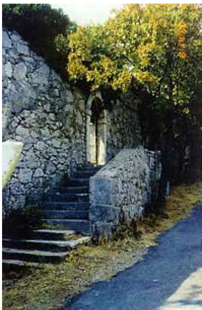
Glavni ulaz u Tvrđavu

Iako Karlobag nije bilo područje oslobođeno od Turaka, svrstan je pod upravu Dvorske komore u Beču. Više puta popravljana i obnavljana tvr-