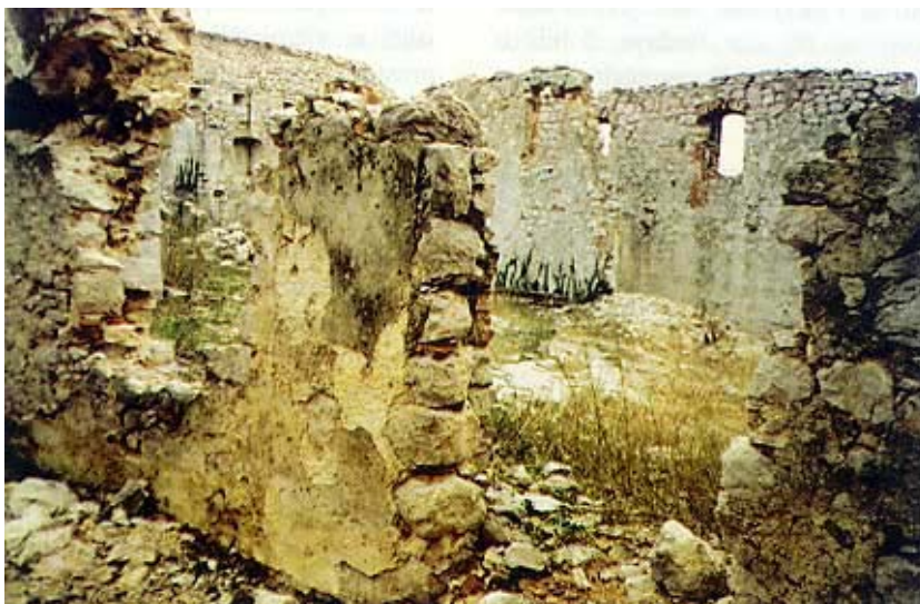
Detalj iz unutrašnjosti tvrđave

rašivanju, pucnjavi i najviše nesposobnosti Zergollerna praktički bez ikakva otpora zauzela karlobašku tvrđavu. Dio je topova onesposobljen i njihovi lafeti zapaljeni, a dio je ukrcaj na fregatu. Prastara je tvrđava iznad grada minirana, ali se u gradu nakon ovoga četvrtog (iako manjeg) razaranja život ipak nastavio. Nekoliko mjeseci kasnije nestalo je francuske vlasti i Karlobag se opet našao u sastavu carske Austrije, gdje je u sastavu Vojne krajine ostao sve do njezina razvojačenja 1871.