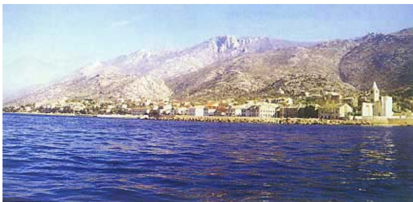
Pogled s mora na Karlobag

tor uz morsku obalu s južne strane Velebita primorskoj župi u sastavu biskupije u Rabu, ali nema pisanih tragova o postojanju bilo kakvog naselja. Pod nazivom Scrisa prvi ga put 1251. godine navodi ban cijele Slavonije Stjepan Šubić, a u vlasništvu je Tugomirića, pripadnika slavničkih 12 hrvatskih plemićkih plemena. Upravo je to spominjanje i temelj proslave 750. obljetnice postojanja održane prošle godine u Karlobagu. Nakon pada Mladena Šubića 1322. preoteli su Bag (koji se možda još nije tako zvao) krbavski knezovi Budislav, Toma i Grgur Kurjaković, sinovi grofa i kneza Kurjaka iz pras-