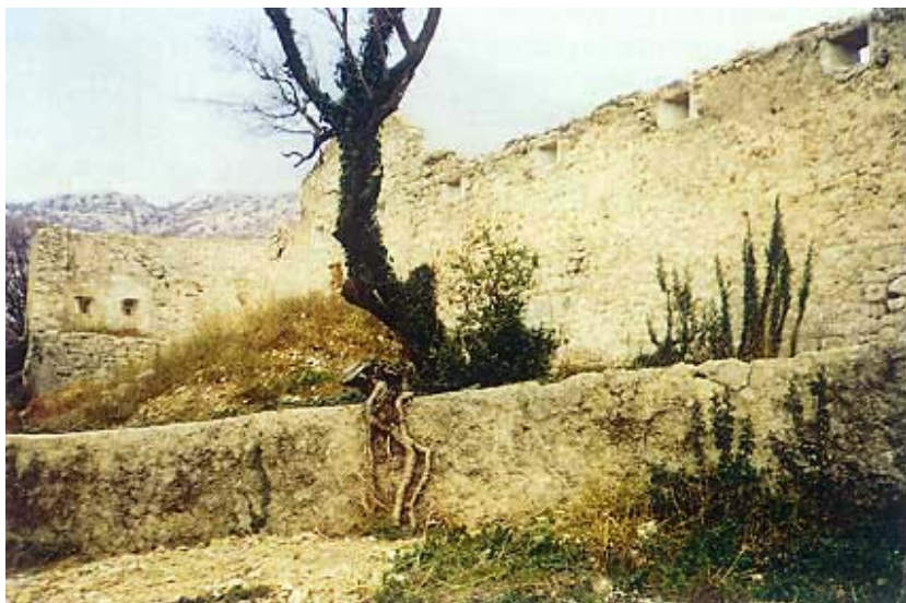
Zidine uz dio tvrđave nazvan Majorov vrt

đava velikim je ulaganjima temeljito obnovljena 1699. Svoje je vatreno krštenje doživjela već 1704. godine kada je grad napadala francusko-španjolska flota. Oštećena je bila i tek obnovljena župna crkva, ali u još polusrušenom gradu i na tvrđavi nije bilo većih šteta. Iz tvrđave je odgovoreno vatrom iz topova pa je flota držana na odstojanju. Tvrđavski se kapetan brinuo o ubiranju pristojbi, trgovini (posebno nabavi, prodaji i smještaju soli), krijumčarenju, ali i zaštiti šuma. U vremenu koje slijedi gradi se nekoliko većih cisterna (voda je uvijek bila velik karlobaški problem), djelomično se popravljaju i restauriraju oštećena rimska cesta preko Velebita, a gradi se i manja luka. U grad dolaze franjevci kapucini i gradi se nova župna crkva, a grad postupno počinje stjecati trgovačku važnost. Grad nakon pritužbi protiv velikih ovlasti kapetana dobiva 1757. i statut na talijanskom i hrvatskom jeziku. Obavljen je 1760. godine i prvi popis stanovništva pa ih je zabilježeno 868, a počinje s radom i osnovna škola.