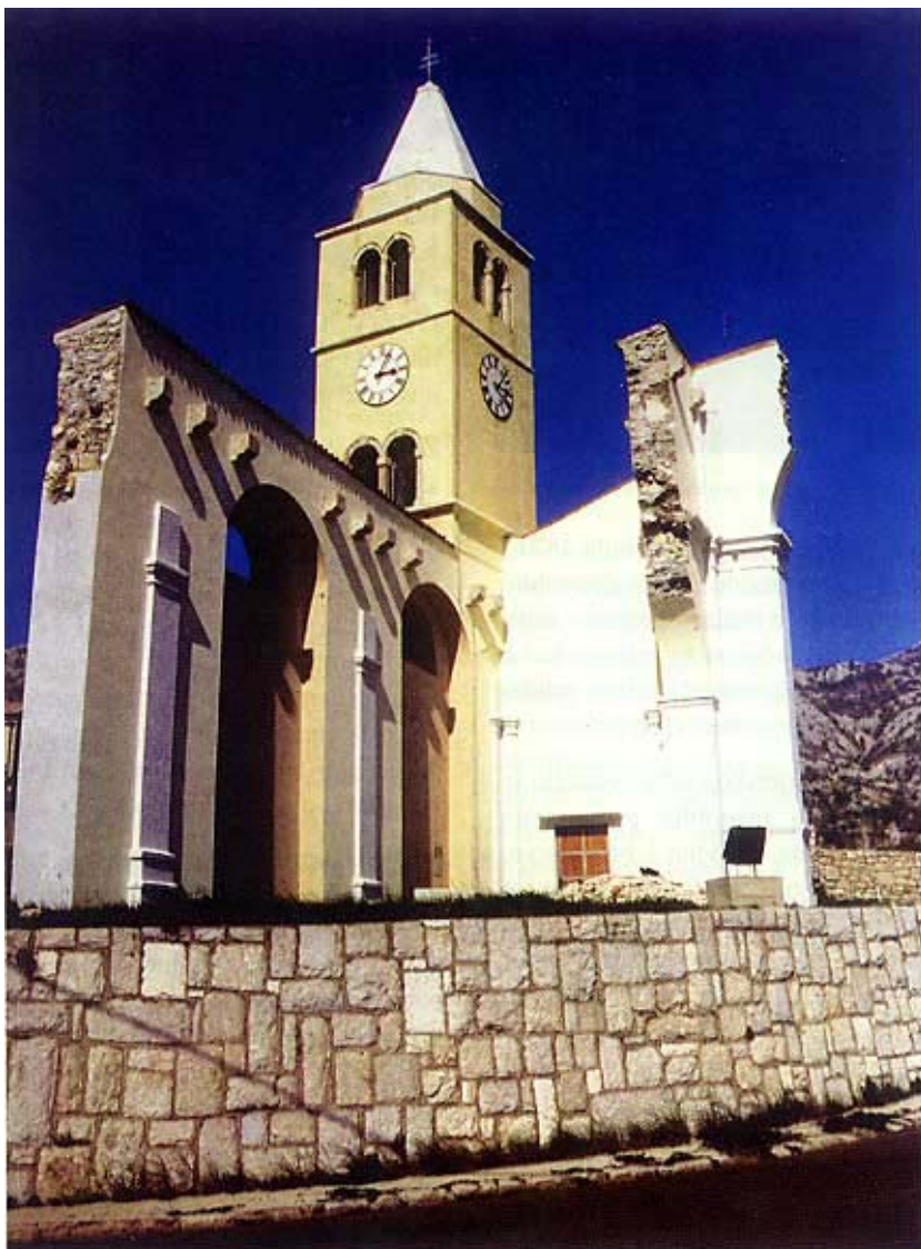
Ostaci crkve Sv. Karla Boromejskog