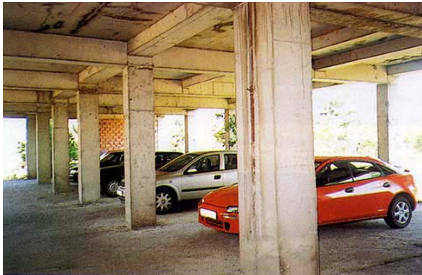
Prizemni dio zgrade Skelet

U međuvremenu je započela još jedna faza obnove, obnova infrastrukture i uređenje okoliša. Uređuju se ceste, nogostupi, parkirališta, javna rasvjeta, ograda, vodoopskrba i odvodnja.