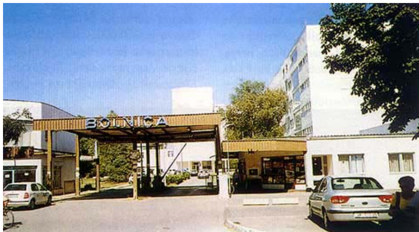
Glavni ulaz u bolnicu

U nastavku se obnavljala dilatacija 3 i E i obnova tog dijela bolnice zapravo još uvijek traje. Obnavlja se bolnička kuhinja, hitan prijem, orto-