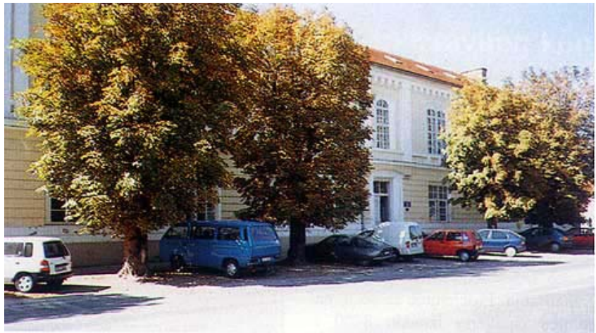
Zgrada stare bolnice u Vinkovcima

Obnova je započela već početkom 1992. godine kada su se, praktički pod granatama, obnavljala stakla i krovovi. Zanimljivo jest da je najmanje stradala zgrada nazvana Novi objekt u kojoj je sada smješteno i bolničko ravnateljstvo i u kojoj smo razgovarali o obnovi bolnice. Iako je ta zgrada smještena najistočnije, i ujedno je najbliža Mirkovcima, sačuvala ju je činjenica da je paralelna s glavnom prometnicom i što je prema Mirkovcima okrenuta bočno. Sustavnija obnova započela je prestankom agresije kada su se u grad počeli vraćati njegovi stanovnici i kada se vratilo mnogo djece. Tada su u središtu grada za bolničke potrebe obnovljene dvije stare građevine – zgrada stare vojničke bolnice ( Regiment-spital ) izgrađena 1875. godine i zgrada starog rodilišta koja se nalazi preko puta u Ulici kralja Zvonimira. Te su zgrade osposobljene te su se u