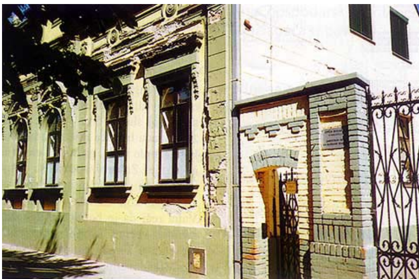
Zgrada nekadašnjeg rodilišta i ratnog odjela bolnice u središtu Vinkovaca

Obnova je počela na dilataciji A i dilataciji 1, gdje su smješteni dječji dispanzer, bolnička ljekarna, dječji odjel, otorinolaringologija, ginekologija i kirurgija. Izvoditelj radova bio je Ex compasto d.o.o iz Vinkovaca, a nadzor je obavljao Kapun d.o.o. iz Osijeka (nadzorni inženjer Dragutin Kapun, dipl. ing. arh.). Inače za obnovu ovog dijela bolnice još traje sudski postupak jer su loše obavljene završni radovi i vrlo loše izvedene podne obloge. Velik je problem bio što su u svakoj fazi obnove sudjelovali različiti izvođači.