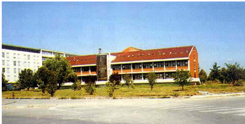
Novi objekt, lijevo je zgrada dilatacije 1

đena 1994. godine. Preostalo je da se do kraja završi i uredi zgrada Skeleta , koja se sada koristi kao prostor za parkiranje automobila djelatnika bolnice. Tu će biti smješ-