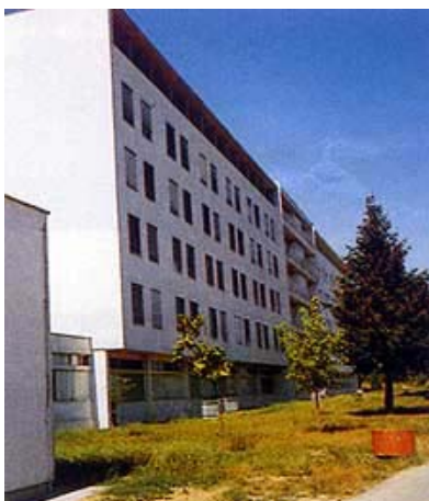
Obnovljeni dio bolnice (dilatacija 1)

pedija, rodilište, centralna intenzivna njega i kirurgija u dilataciji 3, a u dilataciji E centralni laboratorij, središnja radiologija, radionica s gine-