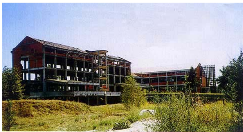
Nedovršeni dio bolnice zvan Skelet

pedija, rodilište, centralna intenzivna njega i kirurgija u dilataciji 3, a u dilataciji E centralni laboratorij, središnja radiologija, radionica s gine-