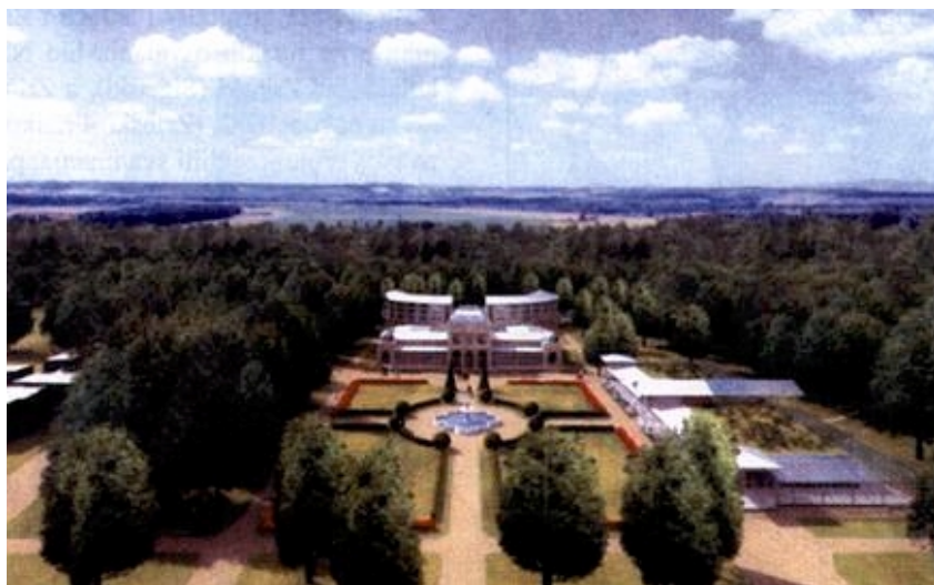
Nekadašnji izgled lječilišnog kompleksa

Nakon Prvoga svjetskog rata vlasnik lječilišta postaje Zemaljska zaklada za suzbijanje tuberkuloze iz Zagreba , koja obnavlja kupališta i perivoj u kojem su nastale mnoge promjene.