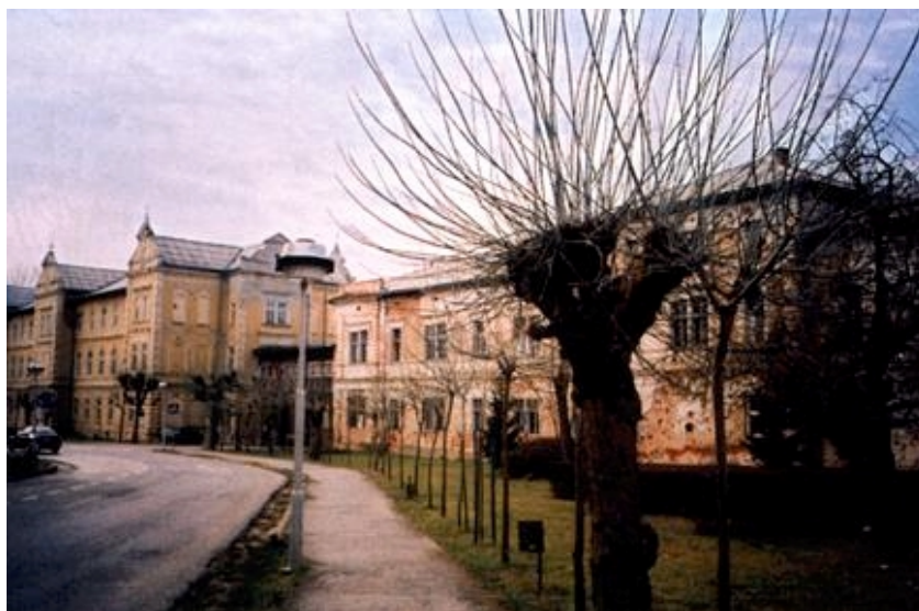
Ulično pročelje nekadašnjih hotela, a sadašnje bolnice

Nakon mnogih adaptacija 1957. godine lječilište je pretvoreno u Bolnički odjel za medicinsku rehabilitaciju, a 1960. izgrađena je nova bolnička zgrada koja se nikako nije uklapala u povijesnu ambijentalnu cjelinu. Nekoliko godina kasnije Odjel je pretvoren u Bolnicu za neurološke bolesti i rehabilitaciju, a u sastavu su bolnice bivši hoteli (sada nazvani Dom I. i Dom II. ), nova bolnička zgrada i sva kupališta. Preostali je dio lječilišta postao tzv. radna organizacija, koja je u svom sastavu imala ugostiteljsko-turističku djelatnost, ali i punionicu mineralne vode. Kasnije je punionicu preuzela Podravka koja je Kursalon bila adaptirala u tvornički pogon, no ipak je punionica 1980. preseljena na novu lokaciju. Najveći je problem nastao 1982. godine kada je na Kursalon nadograđen novi hotel Lipik , čime je narušena slika perivoja i uništena najstarija aleja hrastova. U perivoju je sagra-