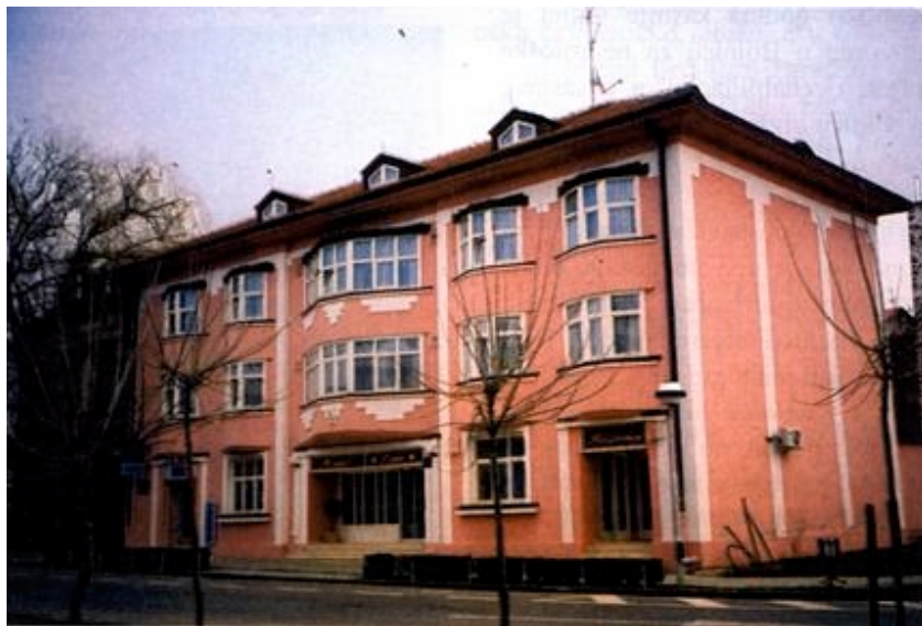
Obnovljeni hotel Lipa

Svi su se Lipičani vratili i mnogi su svoje kuće obnavljali samostalno ili uz pomoć donacija. Obnova od strane Ministarstva obnove započela je negdje od kraja 1993. godine. Poslije se zakon mijenjao i ovisio je o broju članova domaćinstva pa je u Lipiku izgrađeno mnogo malih kuća koje su dosta narušile urbanistički sklad naselja. To im u početku nije smetalo, važno je bilo da se ljudi nekako smjeste, ali danas se vidi da je grad takvim načinom obnove ipak izgubio. No najgore je ipak što ima mnogo ruševina, i to od onih koji nemaju pravo na obnovu ili se neće vraćati. Inspekcija ne dozvoljava da se takve ruševine raščišćavaju iako su htjeli, to jednostavno zakonski nije regulirano. Inače danas je na području grada u koji su uključena i brojna okolna sela obnovljeno 60 posto kuća. Mnoga su sela potpuno prazna, primjerice Subocka, Livađani i Bujavica, a Korita imaju samo jednog stanovnika. I ASB i IRC se trude da u Jagmi obnove dvadesetak kuća kako bi se ljudi vratili, jer se za manje ne isplati dovesti i uključivati infrastrukturu. Inače ima slučajeva, u Kukunjevcu ili u Lipiku, da su kuće obnovljene, a da u njima nitko ne stanuje. ASB se sprema napraviti reviziju i sve takve kuće oduzeti.