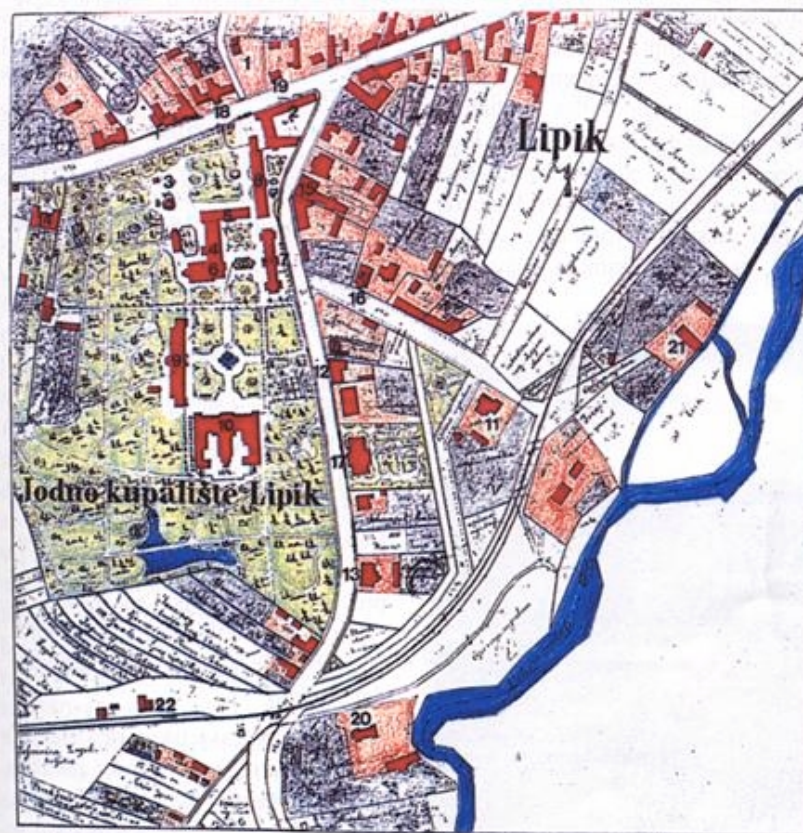
Plan Lipika s kraja 19. ili početka 20. stoljeća

Lipik used to be a renowned and highly esteemed European health spa. However, the town was almost completely destroyed when it was occupied for a brief period during the Homeland War. Its old and protected edifices have suffered extensive damage, and significant damage was also inflicted on its prized gardens. Most of the residential houses are now repaired so that the reconstruction activities have now shifted to the protected spa complex. The reconstruction of the complex - including inter alia a special hospital - is to be carried out in several stages and it is expected that, upon completion, this complex will make Lipik a much more pleasant tourist destination. It is believed that this town will rapidly regain its past glory and former clientele. German and Croatian partners are jointly investing in this reconstruction and construction of new facilities, as well as in the renewal of valuable gardens. At that, a special attention is paid to the renewal of protected heritage and natural resources.