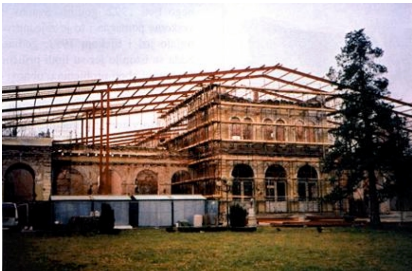
Početak radova na obnovi Kursalona

keramike koja će se uskoro održati u Zagrebu u Nacionalnoj i sveučilišnoj knjižnici. To su radovi umjetnika iz Hrvatske i Slovenije koji se izrađuju u koloniji što se u Lipiku održava svake godine. Prihod s aukcije namijenjen je obnovi Turističko lječilišnog centra u Lipiku.