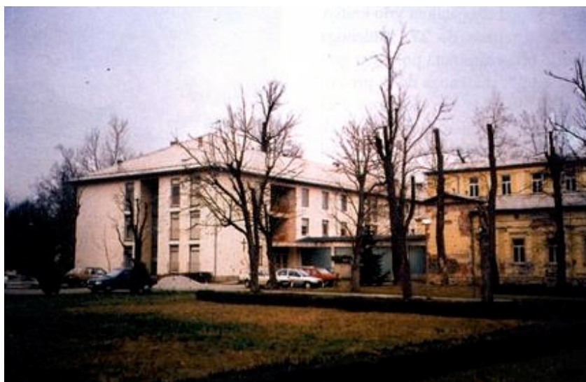
Novija zgrada bolnice

Valja reći da se u međuvremenu Lipiku znatno povećao broj stanovnika, da je otvorena i nova tvornica stakla, a značajno se povećala i kolektivna i individualna stambena izgradnja. Ipak je unatoč svim devastacijama uoči Domovinskog rata Lipik bio lijep, dinamičan i prosperitetan gradić, ali je u ratu praktički potpuno uništen. Nakon kratkotrajne okupacije nije bilo niti jedne zgrade, ni kulturno-povijesne, ni gospodarske niti stambene koja je ostala neo-