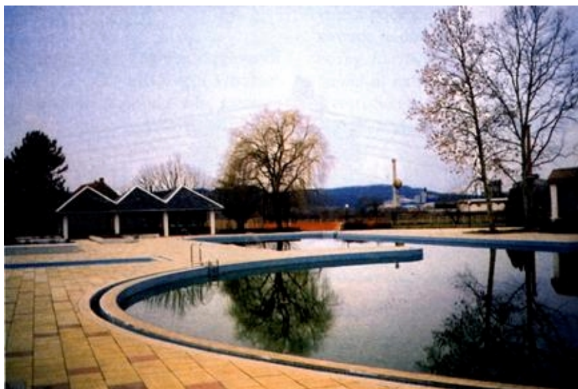
Obnovljeni otvoreni bazen

Inače gradonačelnik je upravo bio u priprema za veliku aukciju slika i