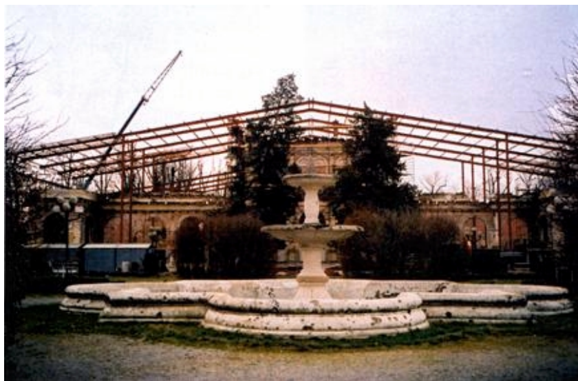
Pogled na fontanu ispred Kursalona

na Pešut, jedino su rukovodstvo neke tvrtke ili ustanove koje je to od prije rata. Njihova borba za obnovu nalikovala je onoj u ratu, a za obnovu cijelog kompleksa su se odlučili zbog izuzetno dobrog prijeratnog poslovanja, dugogodišnje tradicije i terapijske vrijednosti pitke i ekološki besprijekorno čiste mineralne vode. Za razliku od Specijalne bolnice za rehanilitaciju, ZRC Lipik obavlja turističku djelatnost, a prijašnja mu i buduća ponuda uključuje i zdravstveni turizam.