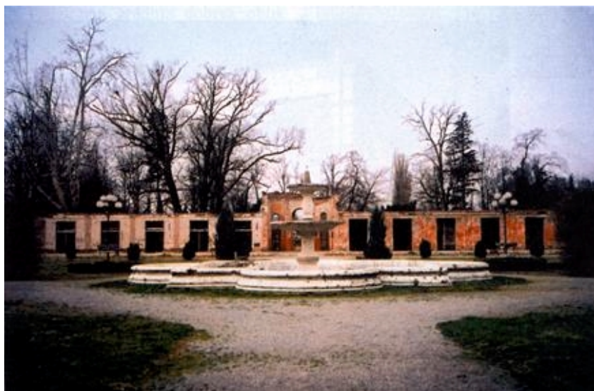
Ostaci stradalog Wandelbahna

veći je dio preživjelih konja iz lipičke ergele u Karadorđevu. No kako je riječ o već ostarjelim konjima vjerojatno će se stado obnoviti uz pomoć Španjolske škole jahanja iz Beča. Predviđa se da bi se paralelno uređivala i opremala bolnica koja bi mogla budućim posjetiteljima pružati dodatne usluge pa bi kupališno lječilišni kompleks mogao svojim uslugama zadovoljiti potrebe cijelih obitelji.