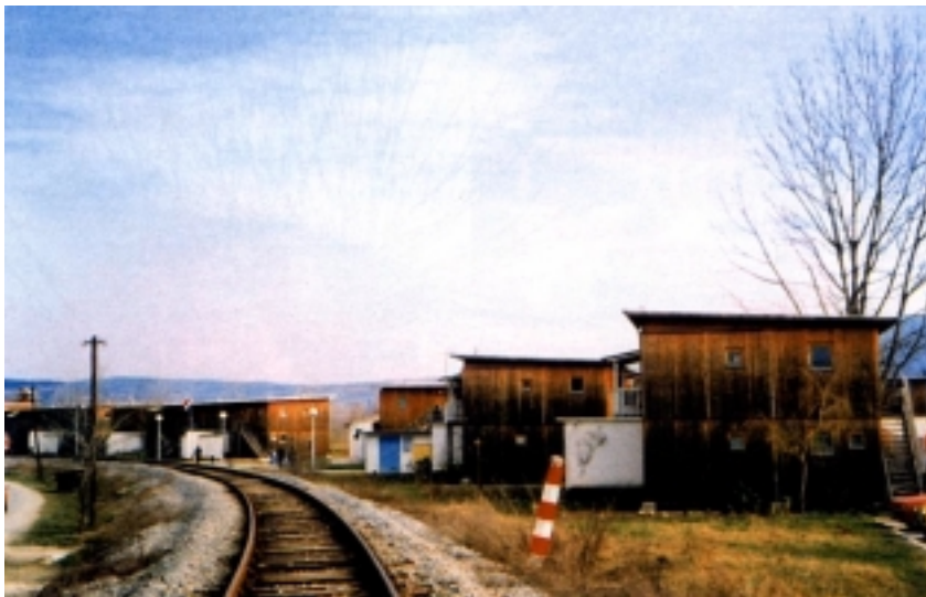
Prognaničko naselje Tonolik

štećena. Temeljito su stradali i povijesni Kursalon i Wandelbahn , ali i sve ostale građevine lječilišnog kompleksa, a potpuno je stradao i povijesni perivoj. Iako smo u ovim našim pregledima ruševina i kasnije obnove obišli zaista mnogo oštećenih i uništenih naselja, najtužniji dojam, tužniji i od razorenog ali znatno većeg Vukovara, upravo je ostavljao mali i skladni Lipik kada smo ga posjetili u tijeku rata.