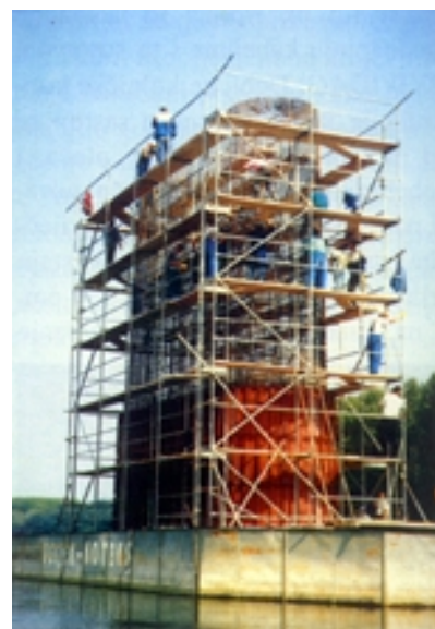
Gradnja stupa u sredini rijeke