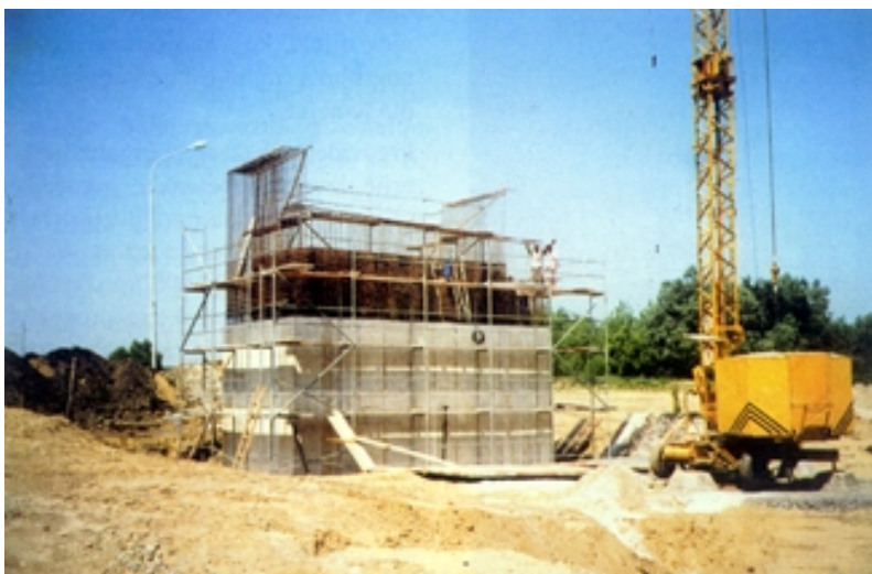
Gradnja upornjaka na slavonskoj strani

na predgotovljenih nosača je zbog zakrivljenosti nejednaka i varira između 23,55 m i 24,75. Svima je poprečni presjek jednak, a visina iznosi 1,5 m. Nosači se naknadno prednapinju kabelima i to sustavom DYWIDAG. Debljine kolničke konstrukcije iznosi 25 cm, a sastoji se od predgotovljenih omnia ploča i dobetoniranog dijela. Poprečni nosači nad upornjacima i krajnjim riječnim stupovima na kojima prestaju prilazni vijadukti visoki su 130 cm, a na ostalim stupovima najmanje