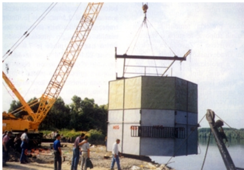
Spuštanje u vodu čelične oplata naglavne grede pilota stuba u sredini rijeke

ležajeve koji se postavljaju na kvadere idealno vodoravne površine, a visina ležajeva je usklađena s očekivanim pomacima od promjene temperature, skupljanja i pužanja betona te djelovanja vodoravnih sila izazvanih kočenjem i vjetrom.