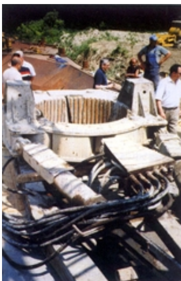
Garnitura za pobijanje pilota u riječno dno

nosača na međusobnom osnom razmaku od 5,8 m koji su spregnuti armiranobetonskom kolničkom pločom. Glavni su nosači "I" presjeka i promjenjive visine; nad krajnjim stupovima iznosi 3,3 m, a nad središnjim stupom 5,2 m. Poprečni nosači "I" presjeka dolaze u razmaku od 5,0 m, osim na krajnjim stupovima gdje iznose 5,5 m. Poprečni su nosači ujedno i nosači skele u fazi betoniranja kolničke ploče. Predviđena je, nadalje, ugradnja prijelaznih naprava za pomake izazvane temperaturnim promjenama te skupljanjem i pužanjem betona. Prijelazne naprave ugrađuju se na prijelazu rasponskog sklopa prilaznih vijadukata na upornjake te na spojevima prednapetoga betonskoga i spregnutoga čeličnog sklopa. Hidroizolacija je od zavarenih traka po cijeloj širini armiranobetonske ploče, dakle i ispod pješačkih