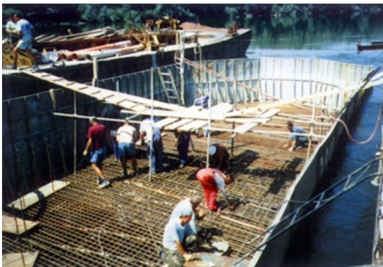
Ugradba armature naglavne grede pilota

odvodi kroz nasip. Predviđena je i zaštita pješačke staze čeličnom ogradom, a zaštitna odbojna ograda neće se izvoditi jer će biti izgrađeni povišeni rubnjaci.