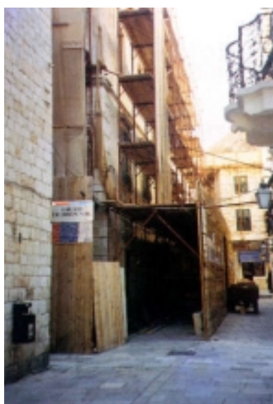
Skele na palači na uglu Široke ulice i ulice Od puča

Palača Dordić-Maineri smještena je na uglu Široke ulice i ulice Od puča. Ta impozantna barokna zgrada, građena također nakon potresa 1667. g., nastala je na uglu dviju glavnih trgovačkih ulica, što je rezultiralo brojnim trgovačkim svodovima i vratima u prizemlju. Oblikom je pomalo neobična za zgrade u Dubrovniku, posebno u svom mansardnom dijelu. Požar je uništio polovicu zgrade u kojoj je bilo zanimljivo stubište s jonskim stupovima. Zgrada će biti obnovljena do lipna 2000. godine.