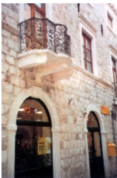
Obnovljena palača u ulici Od puča 16

projektima Arhitekta d.d. iz Dubrovnika, a radove je izvodio GP Dubrovnik d.d.