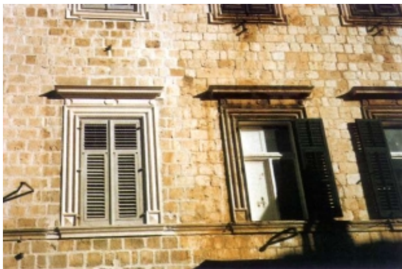
Obnovljeni i stari dio kamenih prozora palače u ulici Od sigurate 2

Palača u ulici Od puča 16 građena je također nakon velikog potresa, na mjestu nekoliko srušenih zgrada originalni zidovi kojih su diktirali poseban raspored s malim vestibulom i stubištem. Na prvom katu nalazio se balkon s lijepo izrađenom željeznom ogradom, a jedino su bili