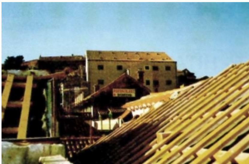
Obnova dubrovačkih krovova

sačuvani svodovi i kameni nadvratnici nad jednim vratima. Projekte obnove izradio je Alfa plan d.o.o., a radove je izvodio SIG d.d. iz Splita. Radovi su završeni 1997. godine. Palača Sorkočević u ulici Miha Pračata 6 građena je krajem 17. ili početkom 18. stoljeća, a njezin nepravilan oblik prati plan prijašnje palače na kojoj je izgrađena. Unutrašnja dekoracija ima mnogo baroknih elemenata, posebno u predvorju i na stubištu. Od požara su bili sačuvani dio stubišta, kameni ornamenti i štukaturna dekoracija. Palača je obnovljena krajem 1999. godine prema