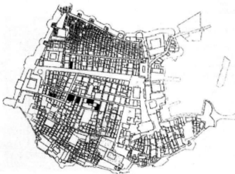
Palače koje se upravo obnavljaju označene u planu stare gradske jezgre

mi iz kojih se prije vadio kamen za gradnju građevina u Dubrovniku danas su uglavnom zapušteni i bez potrebne opreme i mehanizacije. Iako je iz njih moguće dobiti ponešto kamene građe, to je za obnovu Dubrovnika nedovoljno pa se korčulanski kamen rabi samo za najreprezentativnije objekte. Za one manje izložene objekte, a a njima pripadaju spaljene palače, rabi se brački kamen koji kakvoćom ne zaostaje za korčulanskim, a sretna je okolnost što na Braču ima mnogo klesara sposobnih da uspješno restauriraju oštećenu kamenu plastiku.