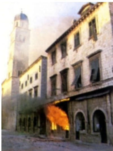
Požar palače u ulici Od Sigurate 2

Mnogo je problema bilo s nabavom kupa kanalicica za brojne oštećene krovove u gradskoj jezgri. Nekada su se te kupe proizvodile u Kuparima (odatle im i ime), a sada je bilo potrebno pronaći novog proizvođača. Pronađen je 1993. godine u Bedekovčini gdje se sada proizvode dvije vrste kupa kanalicica - "dubrovnik" i "libertas", s kojima su pokriveni svi oštećeni dubrovački krovovi. Od starih se jedno razlikuju po težini. Nekadašnje su kupe težile 7,5 kg, a sadašnje samo 3 kg. Zanimljivo jest da je kao kalup za te kupe služila natkoljenica radnika, o čemu svjedoče dlake pronađene na starim kupama kanalicama .