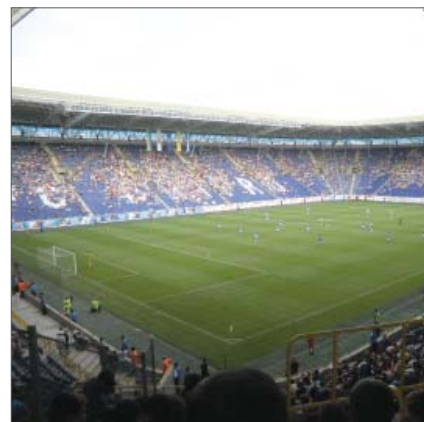
Stadion Dnipro Arena u Dnjepropetrovsku koji je ostao bez utakmica Europskog prvenstva

Stadion Metallist u Harkovu višenamjenski je stadion koji služi za nogometna i atletska takmičenja. Gradnja je počela 1925. po