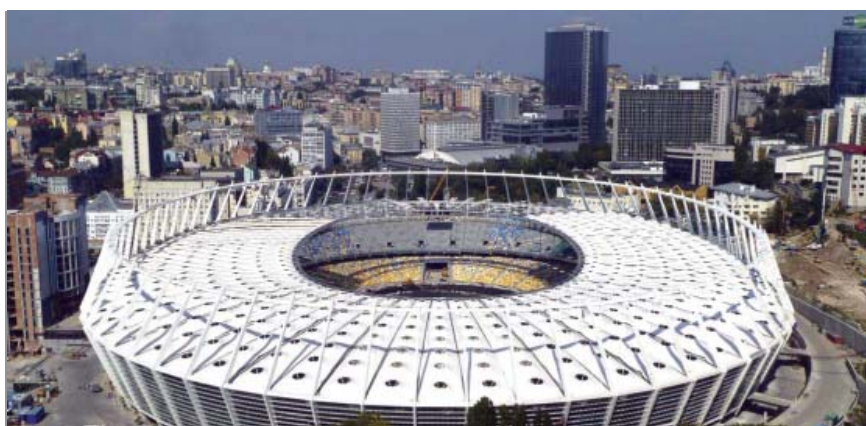
Prikaz budućega izgleda Olimpijskog stadiona u Kijevu prije obnove

Pokušali smo prikazati dosadašnje pripreme za novo Europsko prvenstvo u nogometu. Svi su veliki sportski događaji prigoda za gradnju ili potpunu rekonstrukciju novih stadiona, ali i za poboljšanje prometnih veza, proširenje i opremanje zračnih luka i gradnju novih smještajnih kapaciteta. To je i ovdje slučaj, posebno u Ukrajini koja je dosad imala samo jedan hotelski ležaja na tisuću stanovnika (u Poljskoj je to znatno bolje – 24 ležaja na 1000). Iako su izgrađeni