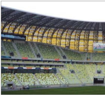
Dio travnjaka i tribina PGE Arene u Gdanjsku

Važan je datum u gradnji PGE Arene 28. svibnja 2009., kada su započeli glavni građevinski radovi. Čelični i betonski radovi zaključeni su 24. srpnja 2010., što je obilježeno i prigodnom proslavom. Zapravo je ugovoreni datum završetka bio kraj 2010., ali su se radovi nešto odužili, pa je i ugovorena prijateljska utakmica s reprezentacijom Francuske 9. lipnja 2011. odigrana u Varšavi.