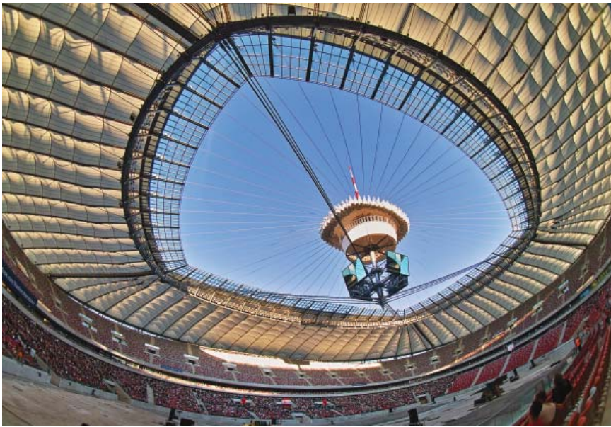
Krovnna konstrukcija novoga stadiona u Varšavi

prostor je tribina također podijeljen u 5 razina i opremljen raznovrsnim uredima, salonima, konferencijskim dvoranama, ugostiteljskim i sličnim sadržajima, sportskim i rekreacijskim sadržajima te prostorijama za novinare i komentatore. Stadion je zapravo dio budućega velikog sportskog kompleksa koji predviđa zatvorenu dvoranu za 15.000 gledalaca, olimpijski bazen za 4000 posjetitelja, vodeni park, hotel, konferencijski centar te brojne ugostiteljske i obrtničke sadržaje. Dovršetak će kompleksa ovisiti o potpunoj rekonstrukciji obližnjeg željezničkog kolodvora i otvaranju posebne linije podzemne željeznice, koja će ga povezati s ostalim dijelovima grada.