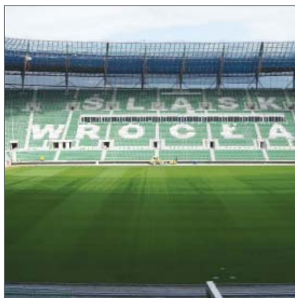
Travnjak i tribine Gradskog stadiona u Wrocławu

relativno nov (izgrađen 2008.) i vlasnici su ga bili spremni obnoviti i proširiti. Inače je Dnjepropetrovsk treći po veličini ukrajinski grad (1,04 milijuna stanovnika) i veliko industrijsko središte koje je do 1990. zbog vojne industrije i nacionalne sigurnosti ondašnjega SSSR-a bilo zatvoreno za strance.