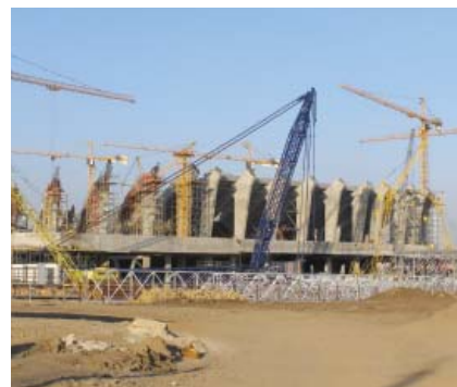
Gradnja stadiona u Lavovu

Lavov). Ta je njemačka tvrtka ujedno trebala biti i ulagač tri četvrtine iznosa u stadion vrijedan 70 milijuna eura, a preostalo je trebala snositi gradska uprava. Početkom 2008. Hochtief je zamijenila austrijska tvrtka Alpine Bau koja je s gradskim vlastima pregovarala gotovo cijelu godinu i na kraju odbila stadion izgraditi za 85 milijuna eura (zahtijevala je 100 milijuna).