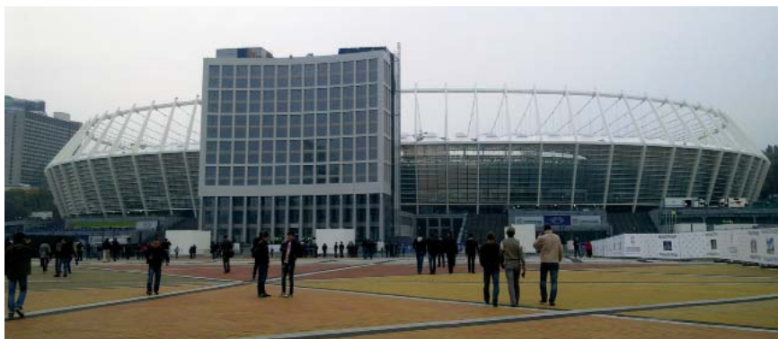
Obnovljeni Olimpijski stadion u Kijevu