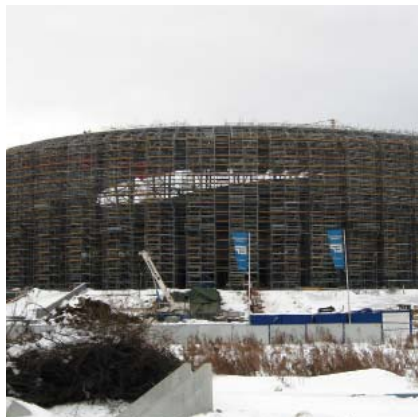
Gradnja stadiona PGE Arena u Gdanjsku

Nama u Hrvatskoj će nesumnjivo najzanimljivije biti utakmice C grupe u kojoj, uz našu i irsku reprezentaciju, nastupa trostruki svjetski i dvostruki europski prvak Italija te aktualni svjetski i dvostruki europski prvak Španjolska. Te će se utakmice igrati na novim stadionima u poljskim gradovima Gdanjsku i Poznanju. Prva se utakmica u toj grupi igra između Španjolske i Italije 10. lipnja 2012. na stadioni PGE Arena u Gdanjsku . Grad je inače važno kulturno, gospodarsko, komunikacijsko i turističko središte, smješteno uz zapadni dio ušća rijeke Visle i najvažnija poljska luka, a ima 464.000 stanovnika.