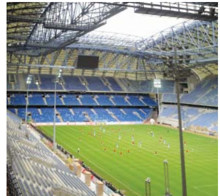
Travnjak i tribine obnovljenog stadiona u Poznanju

U obnovi se nastojalo napraviti što strmije gledalište radi bolje povezanosti publike i igrača, ali to zbog nedostatka sunčeve svjetlosti utječe na kvalitetu travnjaka koji se mora mijenjati i po nekoliko puta godišnje. Osim toga, bilo je problema i s odvodnjom, no sve je to, kako se čini, otklonjeno u temeljitoj obnovi tijekom kolovoza i rujna 2011. godine.