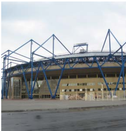
Suvremena obnova Stadiona Metalist u Harkovu

Posljednja je, četvrta, obnova uslijedila za Europsko nogometno prvenstvo 2012. godine. Temeljito je ponovo obnovljena južna tribina i izgrađena potpuno nova istočna. Zamijenjen je i krov, a do kraja 2009. su, unatoč financijskim problemima, obavljena i druga poboljšanja te nabavljena suvremena oprema. Uoči 50. obljetnice kluba otvoren je obnovljeni stadion. U sastavu je južne tribine veliki šoping centar, uredi za iznajmljivanje te uprave lokalnih tvrtki i nekih banaka, ali i ljekarna, ambulante, uredi, putničke agencije i slični sadržaji. Unatoč trudu nismo uspjeli pronaći imena projekatana i izvođača.