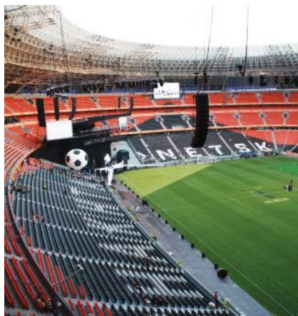
Završni radovi na krovu stadiona u Donjecku

Stadion je ovalnog oblika i ostakljenog pročelja, a golemim krovom pomalo podsjeća na leteći tanjur. Nagibi se stadiona podudaraju s krajolikom, a posebno osvjetljeno pročelje daje noću i danju dojmiv izgled.