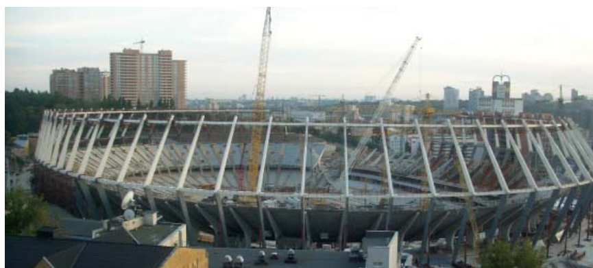
Obnova stadiona u Kijevu

je izvođač radova bila lokalna tvrtka Kievsmiskbud . Radovi su unatoč ponekim katastrofičnim najavama završeni na vrijeme i preuređeni je stadion svečano otvoren 9. listopada 2011. velikim koncertom kolumbijske pjevačice Shakire. Prva utakmica odigrana je između Ukrajine