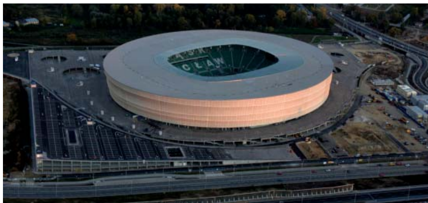
Vanjski izgled novog stadiona u Wrocławu

UEFA je u svibnju 2009. promijenila odluku i umjesto Dnjepropetrovska odredila Harkov; a službeno je objašnjenje glasilo da tamošnji stadion nema dovoljno sjedišta (31.000 umjesto 33.000). Vjerojatno to i nije bio pravi razlog jer se dugo govorilo da kasne radovi obnove gradske infrastrukture, posebno prometnih veza i smještajnih kapaciteta i u Dnjepropetrovsku i u Lavovu, te da im prijete otkazivanje. Nakon toga je otpao samo Dnjepropetrovsk, iako je stadion