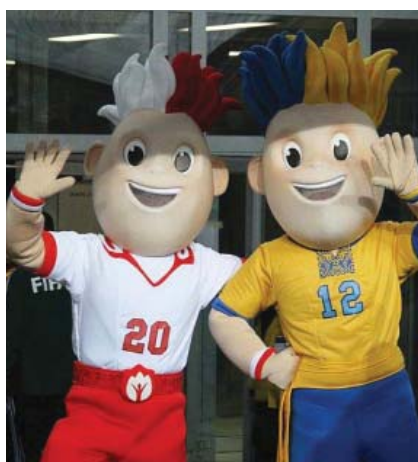
Slavek i Slavko – maskote Europskoga nogometnog prvenstva

a svi su stadioni u gradovima s mnogo stanovnika i potencijalnih navijača. Velika su sportska nadmetanja ujedno i velik posao u kojem se, kada se sve zbroji, okreće i više milijardi eura. Stoga su za novo prvenstvo već izabrane maskote,