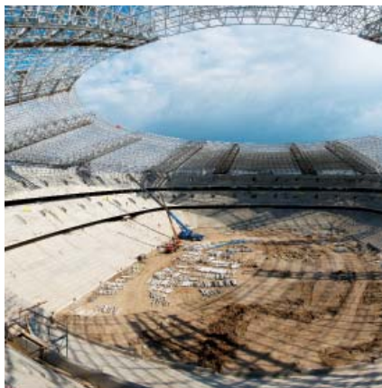
Igralište i tribine Donbas Arene u Donjecku tijekom građenja

Stadion Donbas Arena u Donjecku poznat je našim ljubiteljima nogometa jer tamo je klubu Šahtar (Rudar) nastupa naš igrač Darijo Srna koji je ujedno i kapetan Šahtara (piše se i Šahtjar i Šahtjor ) i hrvatske reprezentacije. Inače je vlasnik Šahtara najbogatiji ukrajinski (neki tvrde i europski) milijarder Rinat Ahmetov, koji je vlasnik i financijske grupacije SCM (System Capital Management) .