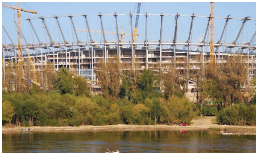
Radovi na novom Nacionalnom stadionu u Varšavi

Osnovna je značajka tog stadiona pročelje koje je oblikovano od djelomično providne ostakljene fasade i čeličnih stupova o koje je ovješena krovna konstrukcija. Stoga se izvama doimlje poput pletene košarice. Čelični kablovi ovješeni na čelične stupove spojeni su na središnji toranj koji lebdi iznad središta (krov konstruktivno slični kotaču za bicikl). Pokrov čini posebna plastična membrana ojačana staklenim vlaknima i teflonom, a dijeli se na nepokretni i pokretni dio te za nepovoljnih je uvjeta može prekriti cijeli stadion. Uz njega idu četiri podzemne razine s parkiralištima, dvoranama, svlačionicama, šetnicama i tehničkim prostorijama, a