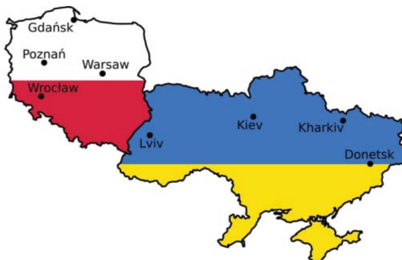
Gradovi u kojima se igraju utakmice europskoga nogometnog prvenstva

Sve ostale reprezentacije imaju po 5 ili manje nastupa. Hrvatska će na europskom prvenstvu 2012. igrati četvrti put, a dvaput je bila sudionik četvrtfinalnih razigravanja. Naša se reprezentacija kvalificirala nakon što je kao drugoplasirana u skupini F u dodatnom susretu eliminirala Tursku. Valja istaknuti da je ovogodišnje europsko prvenstvo posljednji završni turnir u kojem nastupa 16 momčadi jer je UEFA (Union of