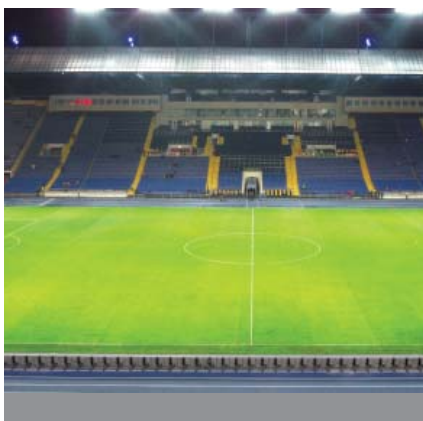
Igralište i tribina stadiona u Harkovu

Posljednja je, četvrta, obnova uslijedila za Europsko nogometno prvenstvo 2012. godine. Temeljito je ponovo obnovljena južna tribina i izgrađena potpuno nova istočna. Zamijenjen je i krov, a do kraja 2009. su, unatoč financijskim problemima, obavljena i druga poboljšanja te nabavljena suvremena oprema. Uoči 50. obljetnice kluba otvoren je obnovljeni stadion. U sastavu je južne tribine veliki šoping centar, uredi za iznajmljivanje te uprave lokalnih tvrtki i nekih banaka, ali i ljekarna, ambulante, uredi, putničke agencije i slični sadržaji. Unatoč trudu nismo uspjeli pronaći imena projekatana i izvođača.