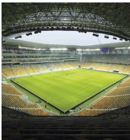
Travnjak i tribine novoga lavovskog stadiona

Stoga je gradska uprava krajem 2008. kontaktirala ISD (ukr. Industrijalna spilka Donbasu – Industrijski savez Donjeckog bazena), jednu od najvećih nadnacionalnih industrijskih korporacija u istočnoj Europi, koja obuhvaća nekoliko industrijskih grana – rudarstvo, građevinarstvo, metalurgiju, proizvodnju strojeva i sl. Ujedno su zbog kratkoga roka gradski službenici angažirali austrijskog projektanta Alberta Wimmera (autora stadiona Hypo Arena u Klagenfurtu), a u projektiranje se uključila i lokalna tvrtka Arnika . Potom je Ministarstvo gospodarstva za glavnog izvođača imenovalo građevinsku tvrtku Azovinteks iz grada Mauripolja u istočnoj Ukrajini koja je u sastavu ISD grupe. Ta je tvrtka smjesta poslala na gradilište stotinjak radnika s opremom, a gradnju stadiona i zračne luke podržala je ukrajinska vlada. Unatoč svim problemima, stadion je ipak izgrađen na vrijeme, a povremene dramatične apele u Lavovu su uglavnom tumačili kao podmetanja konkurentskih gradova koji su se htjeli domoći utakmica europskog prvenstva.