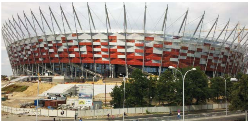
Završetak građevinskih radova na novom stadionu u Varšavi

kad će na teren izaći Legija iz Varšave i poljskog prvaka Wisla iz Krakova. Stadion može primiti 58.145 gledalaca, ima isključivo sjedeća mjesta svrstan je u najvišu – četvrtu – kategoriju, koja se određuje prema infrastrukturnoj opremljenosti. Dimenzije travnjaka su 105 x 68 m (što je standard za suvremene stadione). Stadion će služiti za utakmice državne reprezentacije i za najvažnije i najposjećenije utakmice varšavskih