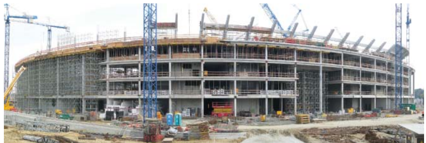
Gradski stadion u Wrocławu u gradnji

projektu njemačke tvrtke JSK Architekten koja je uključena i u projektiranje stadiona u Varšavi. Rad je odabran na javnom natječaju, a izgledom podsjeća na svjetiljku, što je odabrano zbog prepoznatljivosti i podsjećanja na dinamičan gospodarski razvoj grada. Stadion je gotovo kružnog tlocrta, a pročelje mu je prekriveno staklenom mrežom obloženom teflonom,