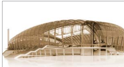
Crtež obnove Gradskog stadiona u Poznanju

trebali doći bazen i teretana, što nije nikad izgrađeno. Stadion se gradio 12 godina, a otvoren je utakmicom Lecha iz Poznania i Motora iz Lublina. U godinama što su uslijedile stadionu su pridodana četiri 56 m visoka rasvjetna stupa, suvremeni semafor i plastične stolice.