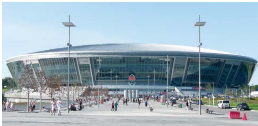
Glavno pročelje Donbas Arene u Donjecku

Izgrađen je 1923. u centru grada, na desnoj obali Dnjepira, na padinama središnjega gradskog brežuljka Čerepanov (projektant je bio L. V. Pilvinski), a svečano je otvoren 12. kolovoza 1923. i tada se zvao Crveni stadion Trockoga . Poslije je često mijenjao imena, pa se neko vrijeme