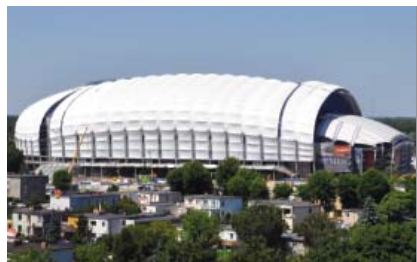
Neobičan vanjski izgled stadiona u Poznanju

Projekt rekonstrukcije izradila je tvrtka Modern Construction Design Sp. z o.o. iz Poznania, a sve su tribine i dio krova prekrivene svjetlom membranom. No zbog problema s neravnim tlom sjeverna tribina ima dvije, a južna tri razine. Bočne (zapadna i istočna) tribine imaju također dvije razine, ali prate visinu južne. To je omogućilo povećanje gledališta, ali je stadionu dalo i neobičan izgled jer podsjeća na golemoga člankovitog kukca. Rešetkasta je konstrukcija krova sidrena na uglovima stadiona i teži gotovo 7000 tona. Prozirna membrana omogućuje noću raznovrsne svjetlosne efekte.